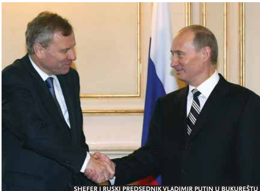
SHEFER I RUSKI PREDSEDNIK VLADIMIR PUTIN U BUKUREŠTU

U Bukureštu je predstavljena i dugoročna vizija stabilizacije Avganistana, koja podrazumeva pružanje podrške Kabulu u izgradnji oružanih snaga, obnovi civilne infrastrukture i državnih institucija, kao i bolju koordinaciju međunarodnih aktera koji pomažu izgradnju te države. O važnosti razgovora o budućnosti Avganistana govori podatak da su na radnom sastanku, pored generalnog sekretara i šefova država NATO-a, učestvovali i generalni sekretar UN-a Ban Ki Mun i zvaničnici te azijske zemlje.