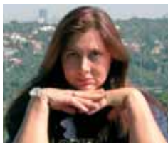
PIŠE: ALEKSANDRA MIJALKOVIĆ

Kako u Beogradu tumače najavu iz Brisela da bi sporazum sa EU mogao biti potpisan pre vanrednih parlamentarnih izbora 11. maja, šta o tome misli Holandija i kako se to odražava na gasni aranžman Srbije sa Rusijom