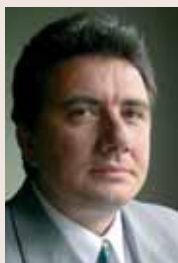
PIŠE: DR JOVAN TEOKAREVIĆ

Srbija je na brzinu pretvorena u neutralnu zemlju, kratkoročno - zbog predstojećih izbora, a dugoročno - da bi bila udaljena i izolovana od Evrope i sveta