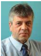
PIŠE: MILAN SIMURĐIĆ

Našim pristupanjem Ugovoru o energetske zajednici sektorski smo se uključili u Evropsku uniju i otvorili za neophodne investicije i jačanje energetske bezbednosti