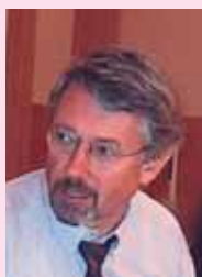
PIŠE: DR FRIDHELM FRIŠENŠLAGER

U načelu, Srbija bi mogla da insistira na nepripadanju vojnim savezima, kao što to rade Austrija, Švedska i Finska, ali bi time samu sebe ograničila na putu ka EU-u