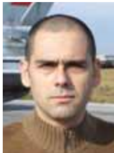
PIŠE: ALEKSANDAR RADIĆ

Neutralnost se tretira kao nespojiva sa namerom da se uđe u EU, a kao model na kome se zasniva bezbednosna arhitektura nije prepoznat ni u jednoj od država u našem okruženju, dok su je šire na kontinentu do sada održale samo visokorazvijene države sa dugom demokratskom istorijom i jakim oružanim snagama