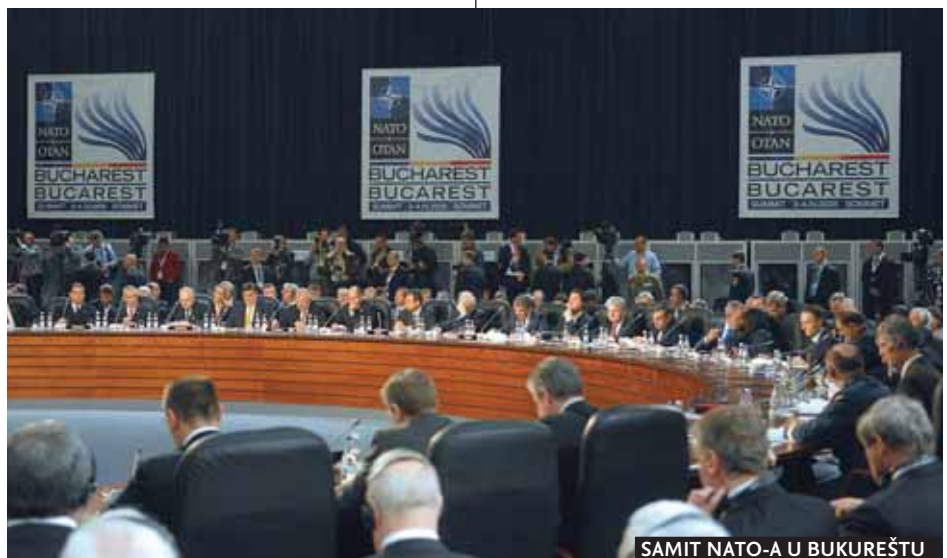
SAMIT NATO-A U BUKUREŠTU