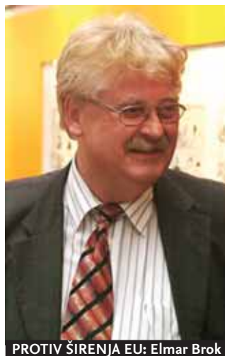
PROTIV ŠIRENJA EU: Elmar Brok

“Dalje proširenje, bez odgovarajuće konsolidacije, moglo bi da odvede Uniju ka višestrukim konfiguracijama, sa ključnim zemljama koje se kreću ka tešnjoj integraciji i drugima koji ostaju na marginama”, navodi se u Nacrtu izveštaja koji je za Spoljnopolitički odbor Evropskog parlamenta (EP) pripremio nemački poslanik EP-a Elmar Brok. Dokument o kojem bi trebalo da se u ovom odboru