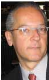
PIŠE: IVAN VEJVODA

Naša zemlja je posle 2000. krenula u evroatlantske integracije, koje su sada zaustavljene. Srbija mora da obnovi sve vidove diplomatske, vojne i bezbednosne komunikacije na svim nivoima sa za nas najznačajnijim zemljama i partnerima