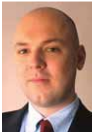
PIŠE: DANIJEL ŠUNTER

Ovogodišnji samit NATO-a obeležen je pozivom u članstvo Hrvatskoj i Albaniji, vojnim angažmanom u Avganistanu, odnosima sa Rusijom i nedostatkom konsenzusa o integraciji Makedonije, Ukrajine i Gruzije u zapadni vojni savez