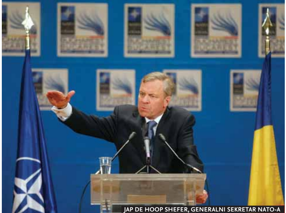
JAP DE HOOP SHEFER, GENERALNI SEKRETAR NATO-A

Autor je direktor Evroatlantske inicijative i urednik magazina "Evroatlantska revija"