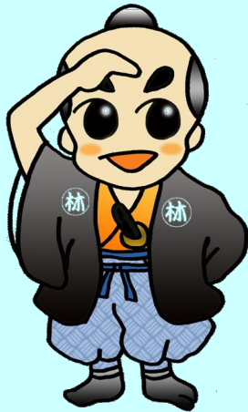
海峡を望む「りんぞうくん」