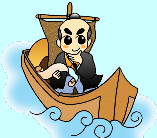
サンタン船に乗った 「りんぞうくん」