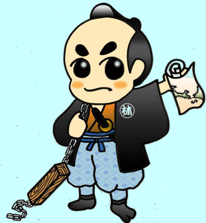
測量をする「りんぞうくん」