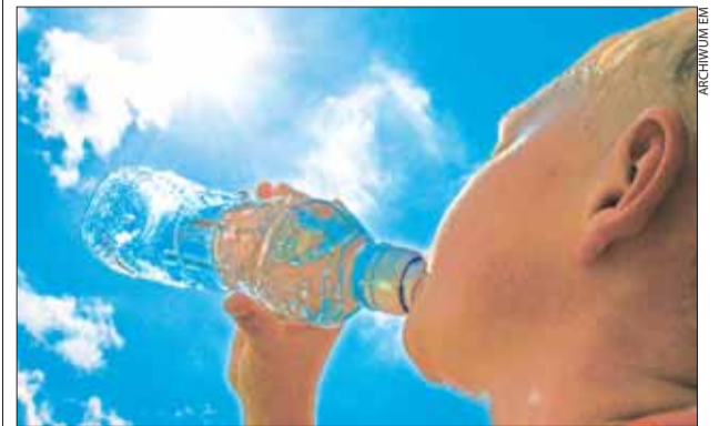
Lekarze radzą, by w czasie upału pić dużo NEGAZOWANEJ WODY MINERALNEJ . Unikniemy odwodnienia

Synoptycy zapowiadają, że lipiec będzie ciepły. Nie wszyscy jednak dobrze znoszą wysokie temperatury. Poznańscy lekarze radzą, by przygotować się do upałów.