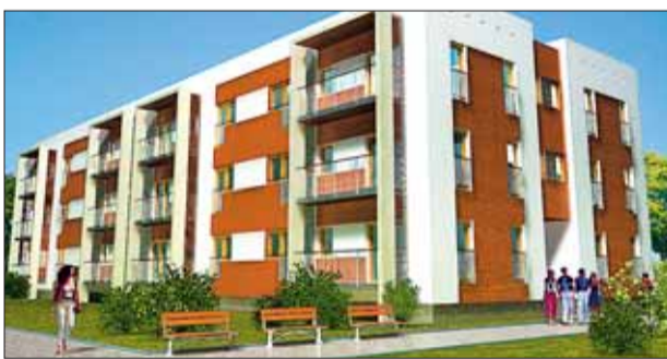
Tak ma wyglądać OSIEDLE KALINOWE w podpoznańskiej Rokietnicy

Developer zakłada, że czynsz na osiedlu Kalinowym nie przekroczy złotówki za metr kwadratowy, a ceny nowych mieszkań zaczną się