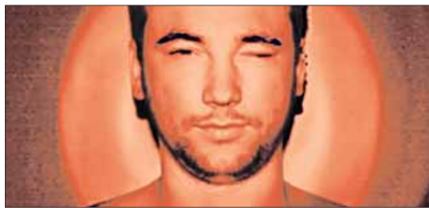
Jedno ze zdjęć, które można zobaczyć na WYSTAWIE W MESKALU

Na wystawie zobaczymy zdjęcia „Profesjo(nalnej)” grupy fotograficznej – studentów szkoły Profesja. Grupa związała się niespodziewanie, nie jest formalna, nie ma manifestu. To ludzie, których łączy chęć odkrycia własnej wrażliwości na świat. Na wystawie zobaczymy całe przekrój form fotograficznych,