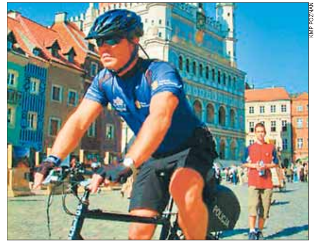
Poznański policyjny patrol rowerowy BĘDZIE CZUWAŁ NAD BEZPIECZEŃSTWEM mieszkańców aż do jesieni

W trakcie służby najczęściej legitymują rowerzystów. Sprawdzają, czy rowery mają numery identyfikacyjne. Jeśli dany pojazd takie posiada, funkcjonariusze łą-