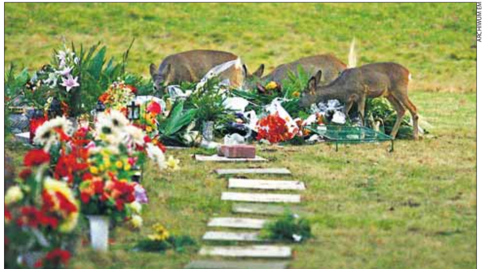
Kwiaty na cmentarzu Miłostowskim to PRYZMAK MIEJSCOWYCH SAREN