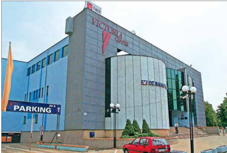
Jedną z poznańskich inwestycji Howard Holdings ma być ZBURZENIE ZAPOMNIANEGO VICTORIA CENTER i stworzenie na jego miejscu ekskluzywnego biurowca

Niedawno ten teren kupili Irlandczycy z Howard Holdings. Planują zburzyć szpetną Victoria Center i w jej miejscu wybudować luksusowy biurowiec. Inwestycję mogą opóźnić umowy najmu lokali w VC, podpisane przez po-