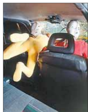
INTERNET Podczas zderzenia dziecko może WYSTRELIĆ NICZYM POCISK

Za przewożenie dzieci bez fotelika można zapłacić 150 zł i otrzymać trzy punkty karne. Jednak najważniejsze są konsekwencje w razie wypadku