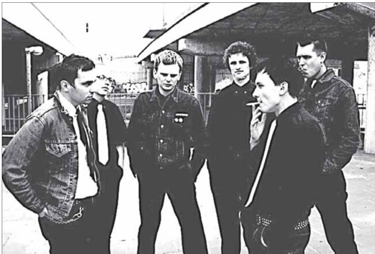
COOL KIDS OF DEATH rozpocznie cykl „Gitarowe Brzmienia” w Starym Browarze. Jako pierwsi jazzmani zagrają kwartet Maestro Trytony