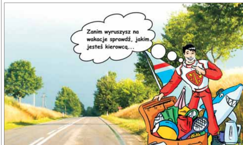
TEST Test badający skłonność do niebezpiecznych zachowań na drodze PRZYGOTOWALI SPECJALIŚCI

TEST KIEROWCYCA. Odbierz „Tarczę Bezpiecznego Kierowcy”. Na drodze dawaj przykład innym