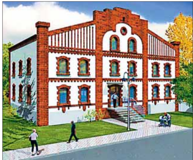
Fragment przyszłego OSIEDLA NA SYPNIEWIE

Kolejne osiedle powstanie na ul. Skoczowskiej, gdzie na cele mieszkaniowe zostanie wykorzystany zabytkowy pałacyk. Osiedle stawia firma Forbud Development. KRUL