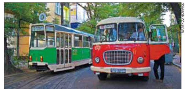
Wycieczki linią turystyczną MPK STAŁY SIĘ BARDZIEJ ATRAKCYJNE

▲ Trasy i ceny znajdziesz na www.mpk.poznan.pl