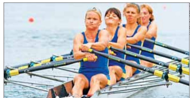
Poznaniacy wioślarze ZDOBYLI W MP AŻ 13 MEDALI. 9 z nich to zasługa pań, które aż 7 razy stawały na najwyższym podium

Mężczyźni wywalczyli cztery medale, ale tylko jeden złoty (męska czwórka bez sternika). Pozostałe medale to dorobek pań, które w dużym stopniu zdominowały mistrzostwa. Dość powiedzieć,