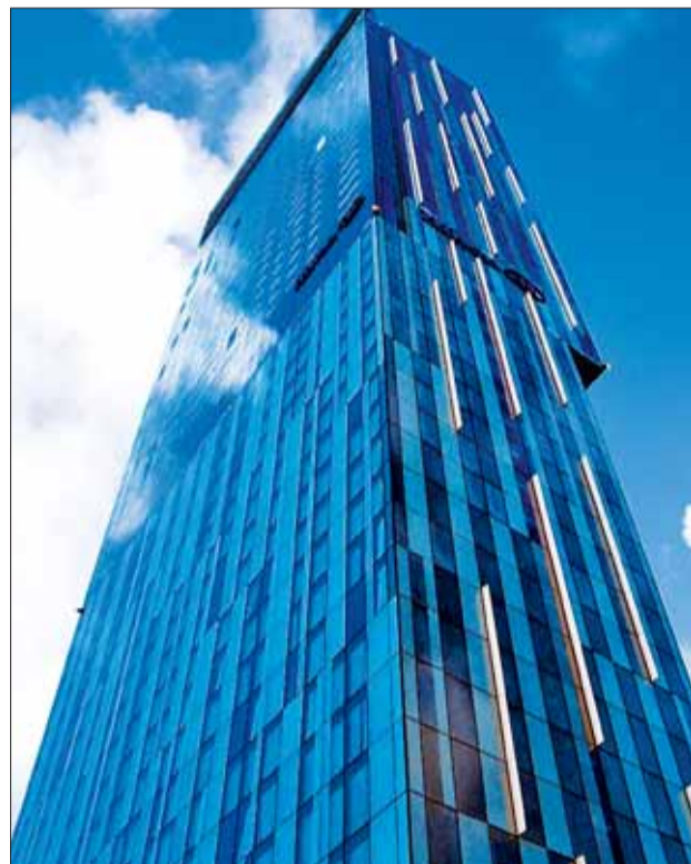
SIEĆ HILTON ma w Polsce jedynie hotel w Warszawie. Kolejne powstaną w Łodzi i Wrocławiu

Nasze miasto stało się dla firm z branży hotelowej bardzo atrakcyjne po przyznaniu Poznaniowi organizacji Euro 2012. Eksperti wskazują, że stolicy Wielkopolski brakuje jeszcze 1,5 tysiąca pokoi hotelowych, by zapewnić nocleg piłkarzom, działaczom i kibicom, którzy przyjadą na mecze do Poznania. Miejsca w hotelach są również potrzebne w związku z rozwojem targów.