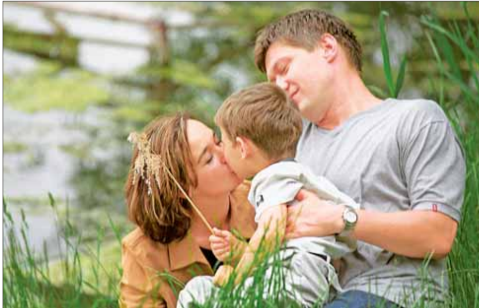
Miasto zobowiązało się SFINANSOWAĆ BADANIA SERCA młodym poznaniakom

chorób serca. Miasto przekazało na badania kwotę 500 tys. zł. Do końca roku wszystkie badania będą wykonywane w pracowniach Szpitala im. J. Strusia przy ul. Szkolnej. Z badań mogą skorzystać poznaniacy dotychczas zdrowi w wieku 30–55 lat obciążeni czynnikami ryzyka miażdżycy,