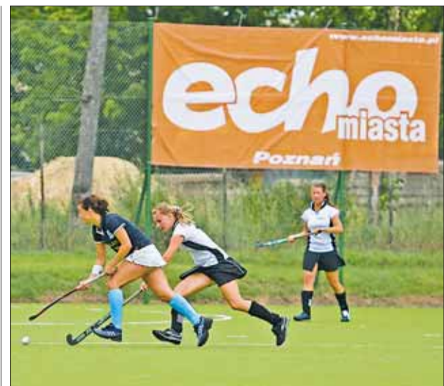
Jednym z punktów pikniku był zwycięski MECZ O TRZECIE MIEJSCE hokeistek Pocztozca z Kolejorzem Gliwice