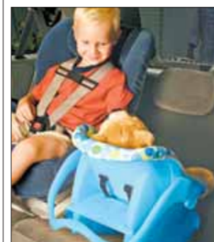
INTERNET Najmłodszy doceni obecność ULUBIONYCH ZABAWEK

Zwłaszcza podczas dłuższej podróży przydatne mogą okazać się rolety przeciwsłoneczne, które chronić będą przed promieniami i zmniejszą ewentualne objawy choroby lokomocyjnej. KUK