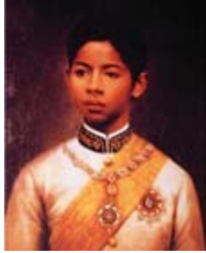
สมเด็จพระบรมโอรสาธิราช เจ้าฟ้ามหาวชิรุณหิศ สยามมกุฎราชกุมาร

มหาวชิรุณหิศ พระราชโอรสพระองค์ใหญ่ ประชวรด้วยพระโรคไข้รากสาดน้อยและเสด็จสวรรคตอย่างกระทันหัน ในวันที่ ๔ มกราคม ๒๔๓๗ ขณะมีพระชนมายุเพียง ๑๗ ชันษา เมื่อสมเด็จพระทรงทราบ ก็ทรงล้มทั้งยืนไม่ได้พระสติ เมื่อรู้สึกพระองค์ก็ทรงพระกรรแสงอย่างรุนแรง ไม่ทรงยอมเสด็จกลับพระตำหนัก ทรงกั้นพระฉากบรรทม ที่ประดิษฐานพระศพพระโอรส