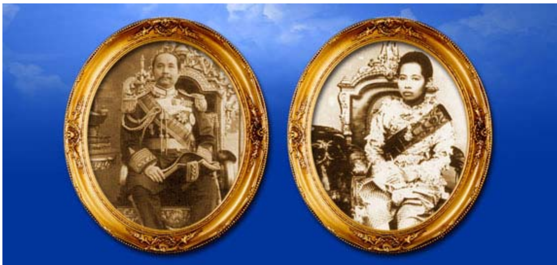
พระบาทสมเด็จพระจุลจอมเกล้าเจ้าอยู่หัวและสมเด็จพระศรีสวรินทิราบรมราชเทวี พระพันวัสสา อัยยิกาเจ้า

กล่าวโดยสรุป สมเด็จพระศรีสวรินทิรา บรมราชเทวี พระพันวัสสาอัยยิกาเจ้า ทรงดำรง พระชนมายุถึง ๖ แผ่นดิน นับจากรัชกาลที่ ๔ ถึงรัชกาลที่ ๙ ในปัจจุบัน ที่ผ่านมา ทรงผ่าน ความทุกข์ ความโศก ความวิปโยค และความอาดูร มาเกือบจะตลอดพระชนมายุของพระองค์ อันนับได้ถึง ๙๓ พรรษาเศษ แต่ก็ทรงประทับระครองพระองค์ไว้ได้ตลอดด้วยพระขันติธรรม