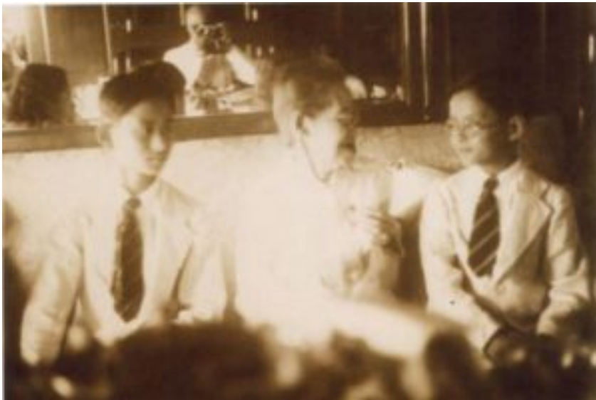
สมเด็จพระศรีสวรินทิราบรมราชเทวี พระพันวัสสาอัยยิกาเจ้า กับพระราชนัดดาทั้ง ๒ พระองค์ ฉายพระรูปโดยกรมขุนชัยนาทนเรนทร

ได้จับกุม พระเจ้าบรมวงศ์เธอ พระองค์เจ้ารังสิตประยูรศักดิ์ กรมขุนชัยนาทนเรนทร พระราชโอรส ในพระบาทสมเด็จพระจุลจอมเกล้าเจ้าอยู่หัว ในข้อหากบฏ ทั้งนี้ สมเด็จพระทรงทำนุบำรุงอภิบาล กรมขุนชัยนาทนเรนทรเสมอด้วยพระราชโอรสของพระองค์เอง โดยรัฐบาลในขณะนั้นได้ส่ง กรมขุนชัยนาทนเรนทร ซึ่งไม่ทรงมีตำแหน่งหน้าที่หรือเกี่ยวข้องกับราชการบ้านเมืองแต่อย่างใด ไปคุมขังไว้ในสถานี่ตำรวจพระราชวัง ในห้องขังผู้ต้องหาสามัญ สมเด็จพระทรงตกพระทัย และโทมนัสมาก ทรงพระกัณแสงรำพันว่า “ ทำไมจึงแก้อย่างนี้ มันจะเอาชีวิตฉันทำไม ลูกชายฉัน เห็นได้เทียบว่ารังแกฉัน “ สมเด็จพระได้โปรดให้เจ้าพระยาพิชเยนทรโยธิน (เคยเป็น มหาดเล็กในสมเด็จพระบรมโอรสาธิราช เจ้าฟ้ามหาวชิรุณหิศฯ) หนึ่งในคณะผู้สำเร็จราชการ เข้าเฝ้าและรับสั่งว่า “ เธอกับฉันก็เห็นกันมาแต่ไหน ๆ ครั้นนี้ทุกข์ของฉันเป็นที่สุดขอให้เธอ ไปช่วยบอกจอมพลที่ว่า อย่าจับกรมชัชนาทฯ เข้าห้องขัง มีผิดอะไรส่งมาให้ฉัน ฉันจะชัง ไวให้เอง ให้มาอยู่ที่บ้านนี้ ข้างห้องฉันนี้ เพราะฉันเลี้ยงของฉันมาตั้งแต่ ๑๒ วัน พระพุทธเจ้าหลวงอุ้มมาพระราชทานเอง ถ้ากรมชัชนาทฯ หนีหาย ฉันขอประกันด้วย ทรัพย์สมบัติทั้งหมดที่ฉันมีอยู่ ถ้าหนีหาย ฉันก็จะยอมเป็นขอทาน ”