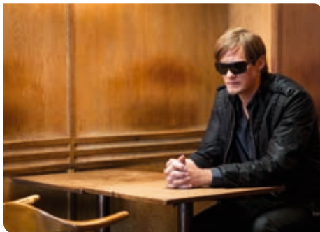
Alexander Skarsgård i Puss .