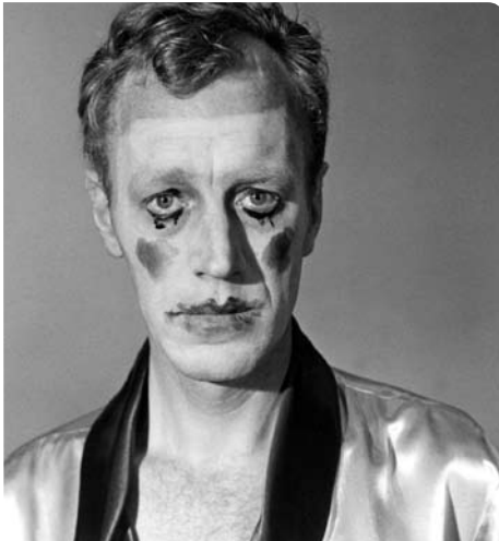
Max von Sydow i Vargtimmen .