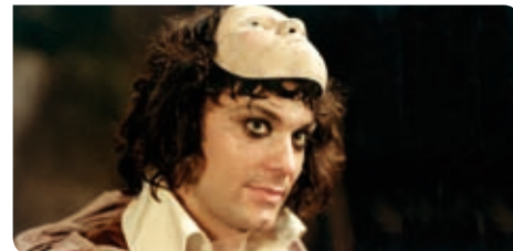
Philippe Caubère som Jean-Baptiste Pouquelin – mer känd som Molière.

Lördag 3 juli, BIOGRAFEN ROY, 17.30–22.15 Engelsktextad. OBS! Ingen paus.