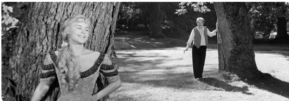
Harriet Andersson i Sommarnattens leende .