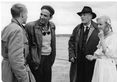
Gösta Ekman, Ingmar Bergman, Victor Sjöström och Lena Bergman under inspelningen av Smultronstället .