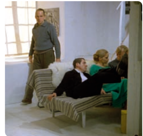
Bergman bakom soffan på bakombild från inspelningen på Fårö av En passion .

29 JUNI – 4 JULI , baksidan av FÅRÖ SKOLA, 10.00–17.00 Eva Erbenius finns själv på plats för att berätta om sin installation tisdag 29 juni, onsdag 30 juni 10.30 och torsdag 1 juli 10.00.