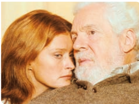
Lena Endre och Erland Josephson i Trolösa .