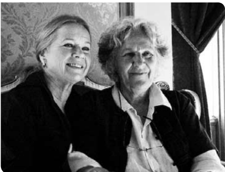
Liv Ullmann med 2009 års Ibsenpristagare Ariane Mnouchkine.