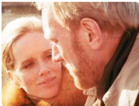
Liv Ullmann och Max von Sydow i En passion .

© 1969 AB Svensk Filmindustri