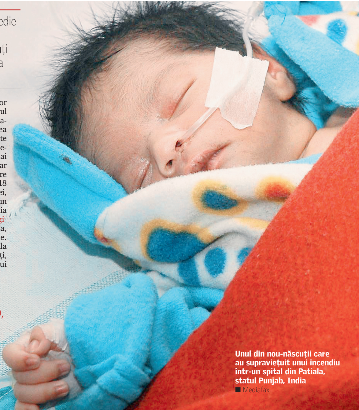
Unul din nou-născuții care au supraviețuit unui incendiu într-un spital din Patiala, statul Punjab, India

ATTILA CSEKE ministrul Sănătății Da, m-am gândit (la demisie-n.r.), între a gândi și a acționa există diferențe. (...) Din punct de vedere al răspunderii morale, eu cred că este o răspundere morală a ministrului Sănătății