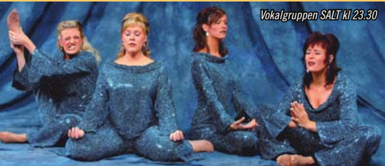
Vokalgruppen SALT kl 23.30

Restaurangtält I vårt uppvärmda restaurangtält serverar Alla Tiders Matlagare mat, vin, öl och kaffe. Här finns även ett dansgolv.