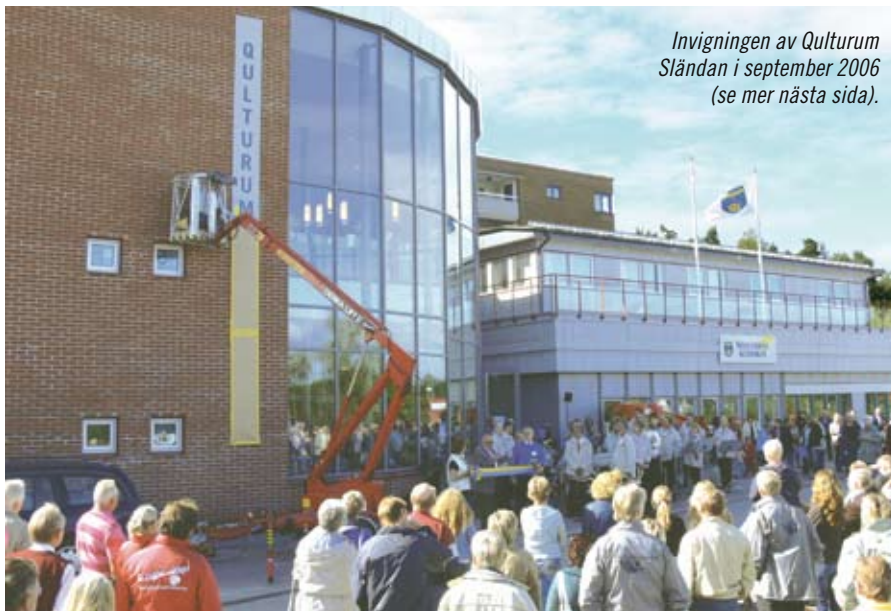
Invigningen av Kulturum Sländan i september 2006 (se mer nästa sida).

Basta Arbetskooperativ tar över driften av Folkparken, sedan man året innan först reparerat efter en brand och sedan "provkört" med verksamhet.