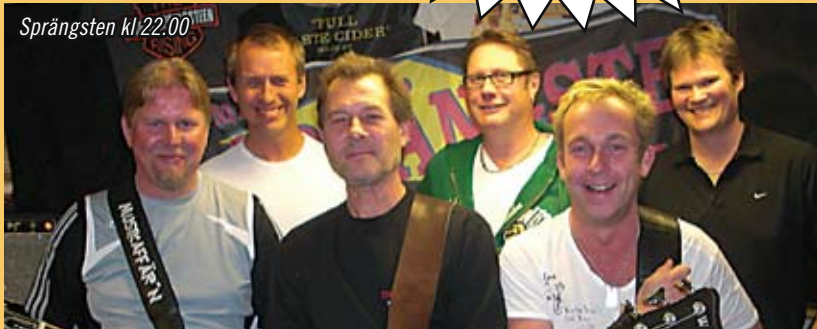
Sprängsten kl 22.00