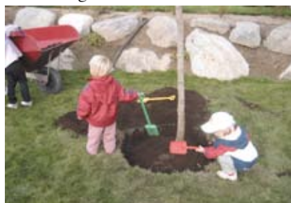
Trädplantering vid nya Taxinge förskola

Förskoleutbyggnaden fortsätter, och under året invigs Björklunda förskola och Taxinge förskola.