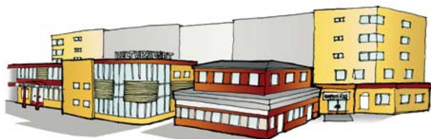
Tutans skiss på hur det nya kommunhuset skulle kunna se ut...