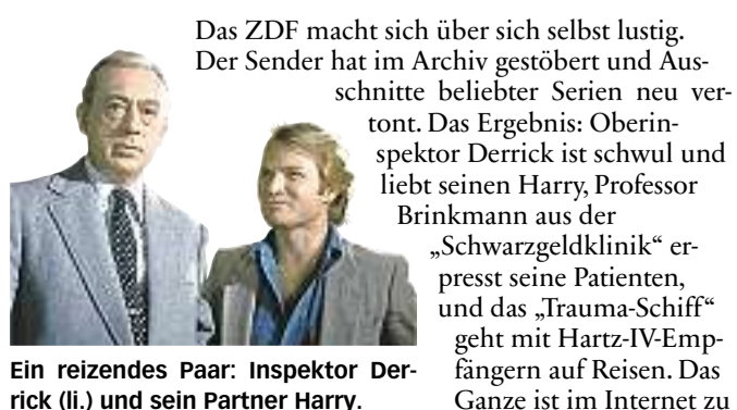
Ein reizendes Paar: Inspektor Derrick (li.) und sein Partner Harry.

Das ZDF macht sich über sich selbst lustig. Der Sender hat im Archiv gestöbert und Ausschnitte beliebter Serien neu vertont. Das Ergebnis: Oberinspektor Derrick ist schwul und liebt seinen Harry, Professor Brinkmann aus der „Schwarzgeldklinik“ erpresst seine Patienten, und das „Trauma-Schiff“ geht mit Hartz-IV-Empfängern auf Reisen. Das Ganze ist im Internet zu