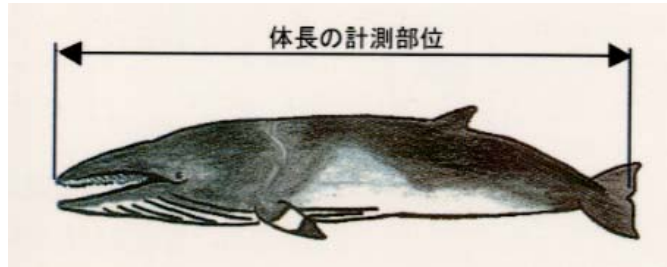
図1. 鯨の体長測定法。上顎先端—尾鰭分基部を直線で計る。図の鯨はミンククジラ（ひげ鯨）。

所定の報告書A（別添1：ひげ鯨等の混獲報告書）を作成します。鯨種名は巻末の見分け方や図鑑などを参考にして必ず記入して下さい。また混獲を証明する写真を撮影します。写真は、鯨が網の中にいる状態が写せなければ、水揚げの際に必ず撮影して下さい。現像は不要です。体長の測定は、鯨の頭部先端（上顎の吻端）から尾鰭中央の切れ込みまでを、