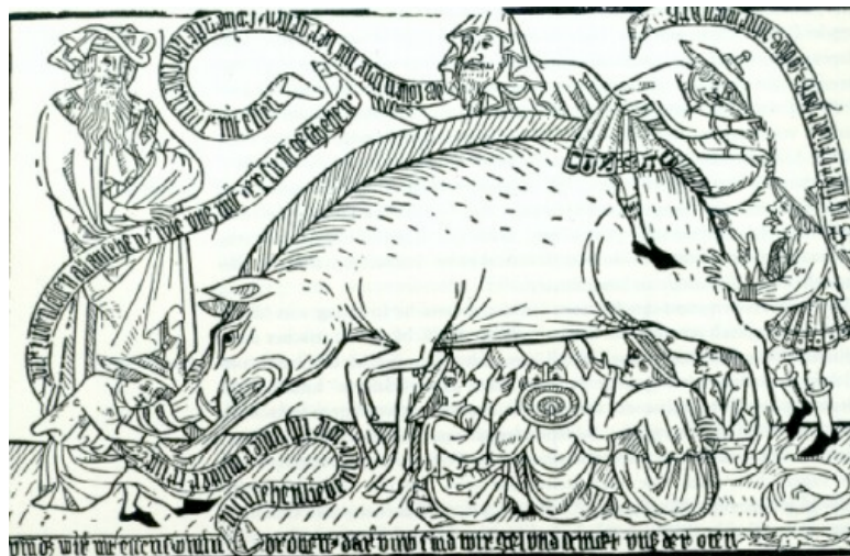
Die „Judensau“ war vor allem im 15. und 16. Jahrhundert eine verbreitete Form der antijüdischen Darstellung In: Antisemitismus, S. 22

Nun möchte ich ein Stück weitergehen und zeigen, wozu die Verteufelung der Juden letztthin führte. Zunächst einmal ist festzustellen, dass bereits zur Zeit des 2. Kreuzzuges 1146 ein berühmter christlicher Theologe Petrus Venerabilis, geschrieben hat, „Ich weiß nicht einmal, ob man die Juden als Menschen bezeichnen kann, denn sie lassen sich weder durch Argumente, noch durch Schriftbeweise überzeugen.“ Der Zisterzienser Bernhard von Clairvaux, ein katholischer Theologe und Ordensmann, verhinderte beim 2. Kreuzzug die Judenverfolgung. Er dachte nicht so wie sein Zeitgenosse Petrus Venerabilis. Er wird in den damaligen hebräischen Texten als Gerechter und Frommer bezeichnet. Er war der Meinung, dass die Juden aufgespart sind, um am Ende der Zeiten zu erkennen, dass Christus ihr Messias sei. Aber da das Ende der Zeiten noch nicht da war, sollte man sie nicht belästigen und sie auch nicht zwingen, schon vorher zu dieser Entscheidung zu kommen.