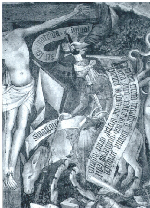
Synagoge vom Lebenden Kreuz des Thomas von Villach in Thörl/Kärnten, 1480.