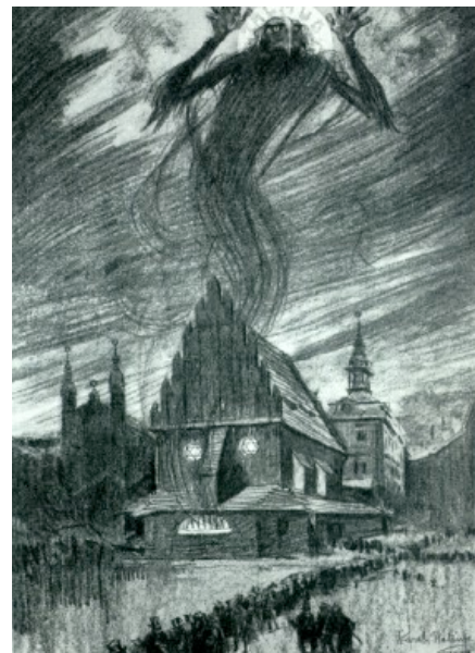
Schreckensvorstellungen von der Synagoge. Zeichnung von Karel Rělink 1923 In: Antisemitismus, S. 70

Nun zum Christentum. Zunächst ist folgendes Phänomen festzustellen. Das Judentum zur Zeit des zweiten Tempels zur Zeit Jesu, war ein Judentum, das in sehr viele Gruppen unterteilt war, die alle in Polemik gegeneinander gelebt haben. Es hat nie ein monolithisches Judentum gegeben. Zu jener Zeit schon ganz und gar nicht. Jesus war einer unter anderen, die in polemischer Auseinandersetzung mit einem Teil ihrer Umgebung lebten. Diese Polemik wurde aber im Zuge der frühchristlichen Entwicklung sehr schnell zur Polemik der anderen gegen die Juden. Man empfand also die Polemik Jesu mit seinen jüdischen Zeitgenossen, die dann verschärft in der Evangelien-Tradition als eine Polemik, vor allem bei Matthäus, von Juden-Christen gegen nicht-christusgläubige Juden eingesetzt wurde, als ideologische Begründung für die eigene Ablehnung des Judentums. Dies führte sehr bald zur Meinung, dass durch Tod und Auferstehung Jesu und der Entstehung des Christentums die Zeit des Judentums abgelaufen war. Wir haben einige Hinweise in den Evangelien, z.B. im Markus-Evangelium, wo es heißt, dass beim Tod Jesu der Tempelvorhang zerriss. Der zerrissene Tempelvorhang galt als ein Zeichen für das Ende. Dass es ganz ähnliche Aussagen auch im Talmud gibt, spielt hier keine Rolle.