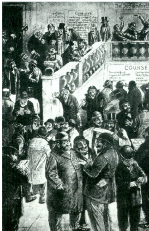
Die Börse als Symbol des Finanzkapitals und neuer Schauplatz antisemitischer Phantasien, Köln 1896. In: Antisemitismus, S. 114

Dann kam noch etwas dazu, zum Beispiel die Vertreibung der Juden aus Wien und den Ländern unterhalb und oberhalb der Enns. Es war Herzog Albrecht V. Die Juden in Linz wurden einfach in Zillen gesetzt und donauabwärts getrieben. Die wohlhabenden wurden in Wien konzentriert, brachten sich zum Teil „zur Heiligung Gottes“ selbst um in der Synagoge, die jetzt am Judenplatz in Wien ausgegraben wurde. Über 200 wurden in Erdberg am Scheiterhaufen verbrannt. Da fragt man sich zunächst einmal, was hat den Herzog dazu veranlasst, die Juden zu verbrennen. Er hätte auch, wenn er sie nur vertrieben hätte, ihren ganzen Besitz einziehen können, denn formal hat ja alles, was die Juden hatten, dem Herzog gehört, denn sie waren mit Leib und Leben Eigentum des Herzogs als seine Kammerknechte. Er hat sie aber umgebracht. Was war der Grund? Natürlich, die Juden waren in der Regel nicht so finanzkräftig, wie sie von den meisten gehalten wurden, aber sie waren in der Lage zu wissen, wie man wieder zu Finanzen kommt. So überlegte man: Wenn die Juden, die bis dahin die Finanzen für den Herzog geregelt haben, vertrieben werden, dann werden sie von den Nachbarn mit Freuden aufgenommen und rüsten sie auf für den Krieg gegen den Herzog. Folglich brauchte man einen Vorwand, sie zu verbrennen und der war die angebliche Hostienschändung in Enns.