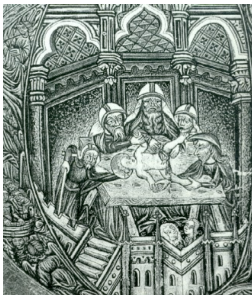
Die Beschneidung Jesu Kloster Neustift, Neustifter Buchmalerei In: Schoeps/Schlör, Antisemitismus, 1995, Seite 90