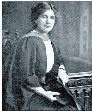
Brenhines Ein Llên - Kate Roberts