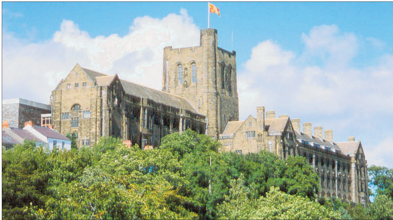
Yn ychwanegol at draddodiad hir ac anrhydeddus o astudio'r Gymraeg yn academiaidd, mae Bangor hefyd ar flaen y gad o ran datblygiadau sy'n mynd â'r iaith i feysydd cyffrous a newydd

Meddai'r Athro Lynch ymhellach: "Ryw ben bob dydd mi fydda' i'n clywed lleisiau cyn-fyfyrwyr Bangor ar Radio Cymru ac yn eu gweld nhw ar S4C. Wrth ymweld â sefydliadau fel Cyngor Sir Gwynedd a'r Cynulliad Cenedlaethol, mi fydda' i'n dod ar eu traws nhw mewn swyddi gweinyddol allweddol. Lle bynnag y bydd rhywun yn troi, byd cyfieithu, byd newyddiaduraeth, byd addysg, ac wrth gwrs, byd ysgrifennu a chyhoeddi, y mae cyn-fyfyrwyr Bangor yno'n amlwg."