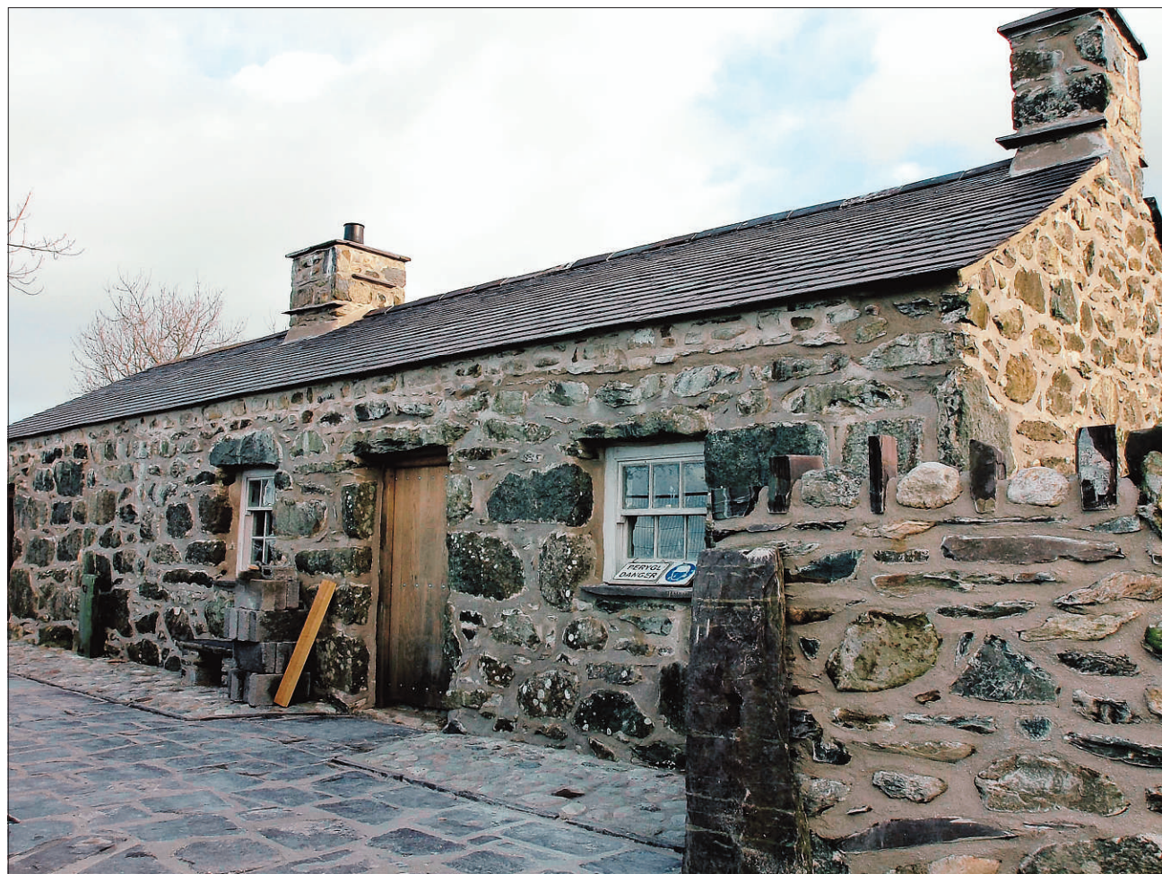
Canolfan Cae'r Gors - hen gartref Kate Roberts