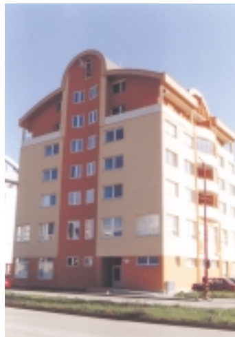
Mestskú časť oživilí aj nové obytné domy na Kazanskej ulici. The municipal part is given a new appearance by building up new houses in Kazanská street. Új lakóház a lakótelepre vezető út mellett

schools and 2 secondary special schools. The teaching language in one kindergarten and one primary school is Hungarian.