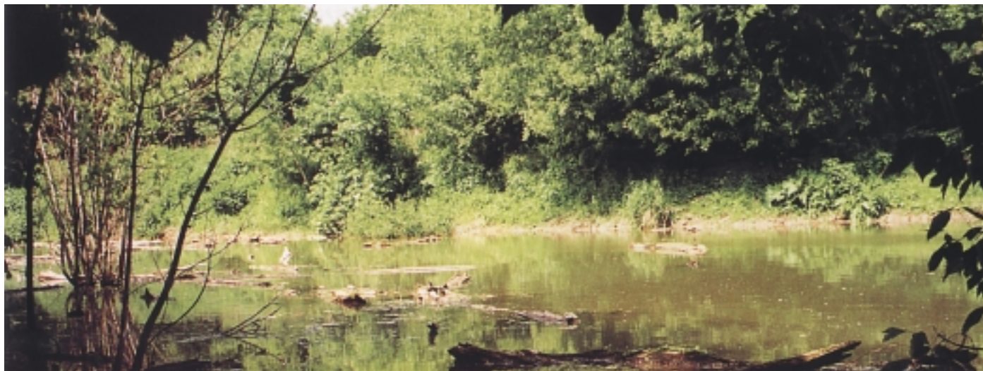
Upokojujúca krása lužných lesov. The calm beauty of a potash forests. Az ártéri erdők megnyugtató szépsége

Az utóbbi években fellendült a lakásépítkezés és lényegesen bővült az üzlethálózat. Pozsonypüspöki kataszterében vadászterület és több védett erdő rész is van védett növény és állatfajjal.