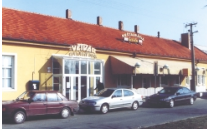
Zrekonštruovaný dom kultúry Vetvár.

Na športové aktivity slúži obyvateľom mestskej časti areál Telovýchovnej jednoty Spoje, baseballové ihrisko,