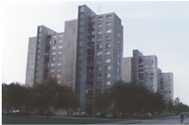
Sídlisko na Dolných honoch. The housing estate in Dolné Hony. A homorúszögi lakótelep

In the last decades Podunajské Biskupice has distinctly changed in appearance. In the municipal part a net of schools is built up: 7 kindergartens, 5 primary schools, 2 secondary grammar