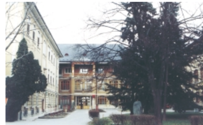
Národný ústav tuberkulózy a respiračných chorôb.

Until 1909 the municipality was called Biskupice - Püspöki, then it was renamed into Bratislavské Biskupice - Pozsonypüspöki, since 1928 its name was Biskupice at the Danube and since 1944 Podunajské Biskupice. The first inhabitants settled in the area of the municipality probably even in the Roman Empire times. The evidence may be seen in the Roman milestone dated from Biskupice, in hewed stones with a Latin inscription built in a gable wall of the St. Nicholas' parish church and in bricks and slates with a mark of the military camp of the Romans.