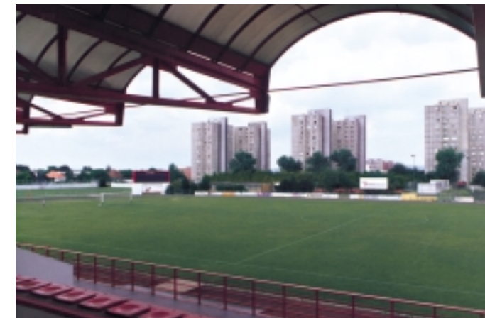
Areál Telovýchovnej jednoty Spoje. The area of the Sports Club Spoje. A Spoje sportstadion

A község hivatalos neve Püspöki, majd 1909-től Pozsonypüspöki, 1928-tól Biskupice pri Dunaji, 1944-től pedig Podunajské Biskupice, azaz Pozsonypüspöki lett. Ez a térség már a római korban lakott terület volt. Erről tanúskodnak a Szent Miklós-plébániatemplom falába beépített latin szöveggel feliratozott épületkövek, a római katonai tábor pecsétjével ellátott téglák és cseréptöredékek, melyek a Gereta dűlőben kavicsbányászás közben kerültek elő, valamint a meglévő római kori mérföldkő.