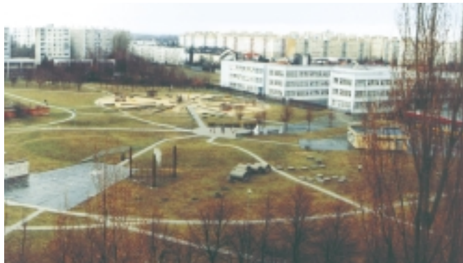
Urbanisticky zaujímavo riešené sídlisko Medzi jarky tvoria tri kruhy. The housing estate Medzi jarky is built up interestingly from the urbanistic standpoint, constructed in three circles Az árokközi lakótelep madártávlatból

An original altar from the tomb chapel of the Ormosdy family - administrators of estates of Ostergom archbishopric, is situated in the southeastern new nave of the church. It is one of the series of altars in the St.Ladislav's chapel in the Primate's Palace in Bratislava. Above the altar there is a precious cross from one piece made of black marble and the corpse of black bronze.