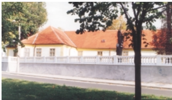
Kúria Juraja Alberta z XVIII. storočia, ktorej poslednými majiteľmi boli Linzbothovci.

Postavili sa tu nové objekty, upravilo a zveľaduje sa prostredie. V roku 1988 bol vybudovaný dom kultúry Vesna. V roku 1994 bol aj vďaka finančnej zbierke medzi obyvateľmi a miestnymi podnikateľmi zrekonštruovaný dom kultúry Vetvár.