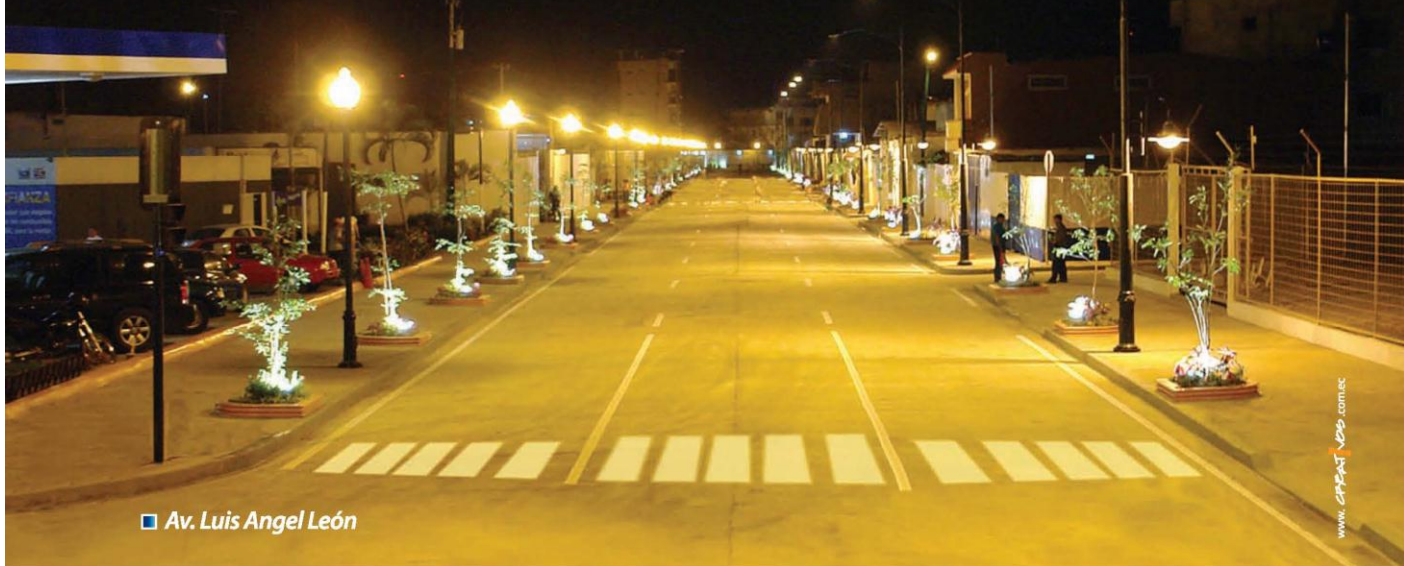
■ Av. Luis Angel León