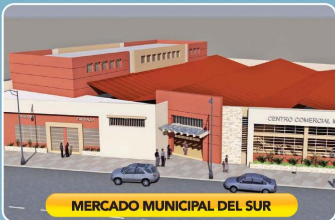
MERCADO MUNICIPAL DEL SUR