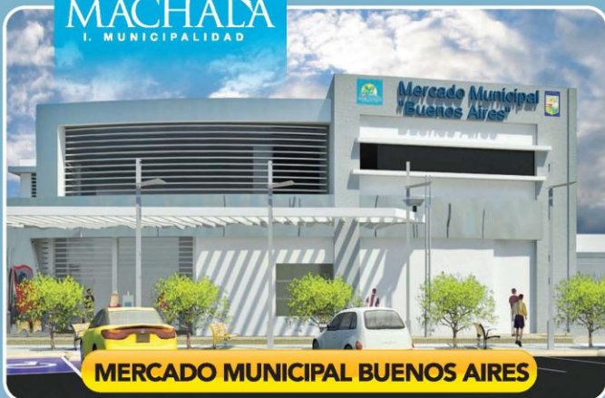
MERCADO MUNICIPAL BUENOS AIRES