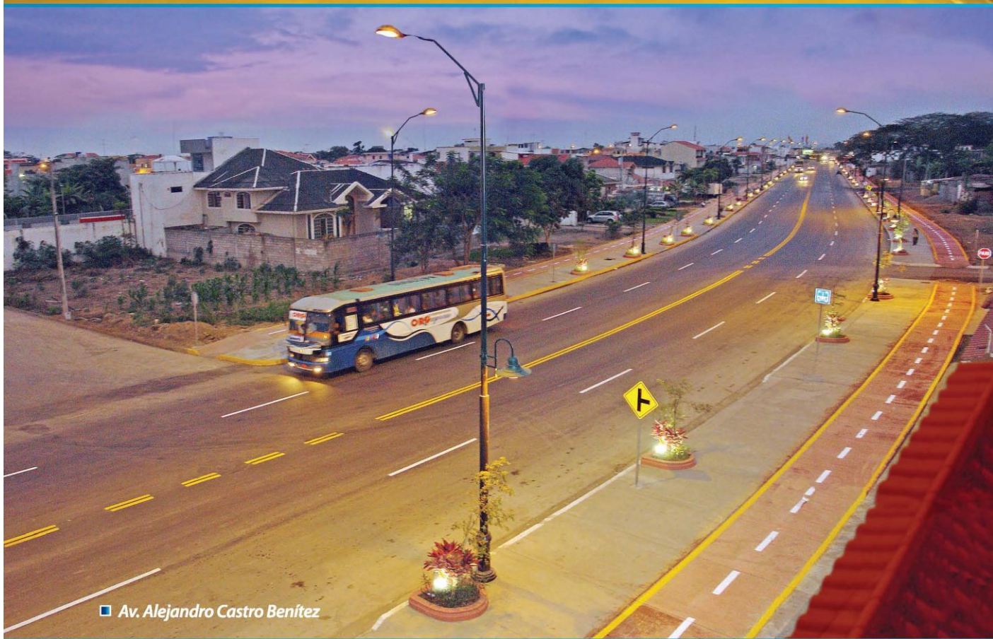
■ Av. Alejandro Castro Benítez