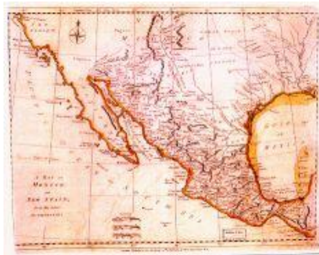
A Map Of Mexico, Or New Spain, From The Latest Authorities, 1782.

De aquella realidad geográfica y de esa nueva tendencia política nacieron nuevas configuraciones territoriales en la Nueva España. La inmensidad y lejanía de los territorios del norte del virreinato, con la dificultad consecuente para gobernarlos desde una sede tan distante como la ciudad de México, determinaron que a partir de 1769 se creara la Comandancia de las Provincias Internas, cuyo titular fue nombrado en 1776. Tal división se fundamentaba administrativamente en la autoridad representada por el comandante general, y la jerarquía de éste sufrió varios cambios durante la vigencia de dicho régimen administrativo, dependiendo alternativamente del virrey o no.