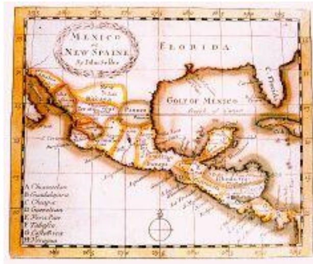
Mexico or New Spaine, 1690.