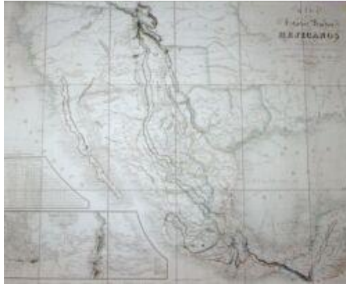
Mapa de los Estados Unidos Mejicanos, 1834.