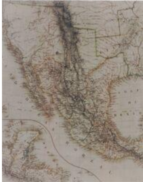
Carte Générale des États-Unis Mexicains et des Provinces-Unies des L' Amérique Centrale, 1825. Sin autor. Sin información del lugar de edición. Sin escala.

Durante la vigencia del Acta Constitutiva, la República de las Provincias Unidas de Centroamérica declaró su independencia el 24 de agosto de 1824 con base en los decretos del 7 y 22 de mayo, y el del 6 de julio; así como en las actas de las juntas del 12 y 14 de septiembre de 1824 celebradas en Chiapas, donde se declaró la anexión definitiva de esta provincia a México. La última división territorial antes de promulgarse la Constitución fue la siguiente: