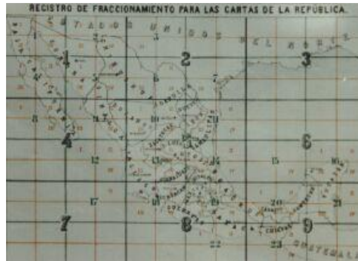
Atlas General de la República Mexicana, 1877. Publicado por el Ministerio de Fomento.