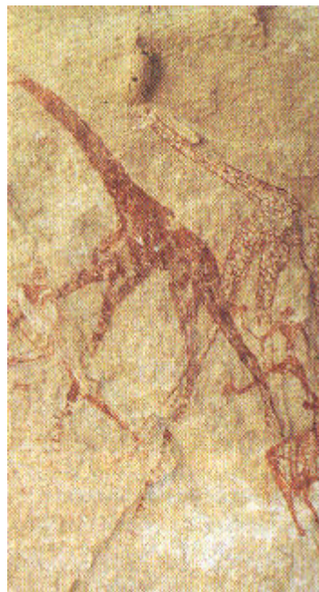
Oniri Causso", Vallée des giraffes.

Les peintures et gravures rupestres du Tibesti témoignent d'une civilisation très ancienne. Le Tibesti constituait une région privilégiée pour les populations préhistoriques et l'on y trouve des objets archéologiques témoignant de la vie au Tibesti ; la vie a commencé il y a 1 à 3 million d'années, on trouve des tombes collectives, des anciens temples. La première population du Tibesti est les clans Wozia et bordia. Les autres clans du Tibesti sont les clans actuels d'origine libyenne, nubien et du clan Garamante. L'Art de la gravure est une pratique très ancienne dans la société Toubou, jusqu'à nos jours ; faire des gravures sur des rocher c'est une expression artistique et philosophique, communiquer avec soi-même. Chaque représentation rupestre est gravée et peinte, elle exprime à sa manière une légende toubou. Il