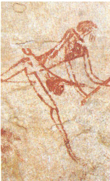
Omuri Gonea", L'homme de Gonea