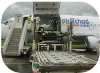
Le Boeing 737 Cargo

n. Pour le fret, un gros porteur de 60 tonnes est prévu à court terme pour le Moyen-Orient