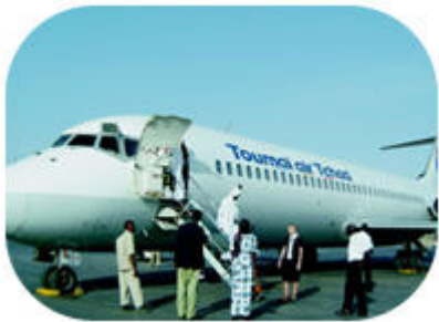
Le Fokker 28 de 63 passagers

Un DC9 de 96 passagers, les photos manquent.