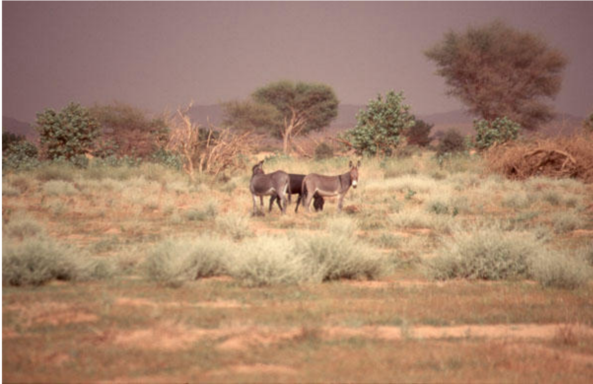
Enneri Tao dans Tibesti (extrême du nord du Tchad au cœur du Sahara)