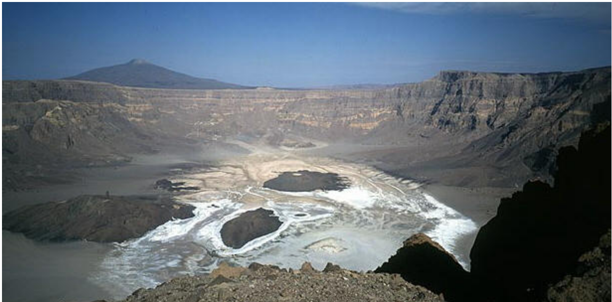
Tarsou dohone (trou entre 10 et 13 km)

Le Soborom est un petit cratère de quelques 3 km de diamètre et peu profond. Mais c'est le site volcanique qui attire le plus l'attention des visiteurs car ses fumerolles sont terrifiantes. Là également existe une piscine aménagée multi-séculaire, avec une température de plus de 40°C ; c'est un véritable «Hamman » doublé d'une clinique. Sur un rayon de 400 à 500 mètres à la ronde tout autour de cette piscine, suintent du sol des eaux aux températures variées qui contiennent plusieurs éléments chimiques comme : Acide sulfurique, Soufre, Silice, Fer, Aluminium, Calcium, Magnésium, Sodium, Potassium, Ammonium.