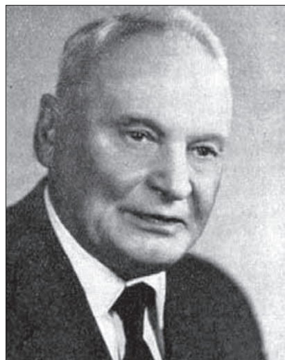
Ryc. 2. Józef Kulczycki