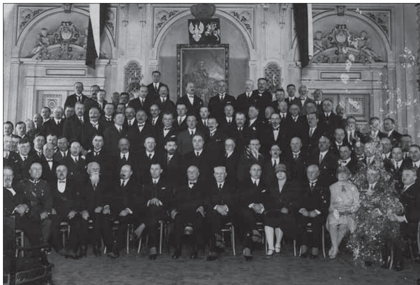
Ryc. 5. Fotografia wykonana podczas nieustalanej uroczystości. W pierwszym rzędzie, czwarty od lewej, gen. Michał Dowbor