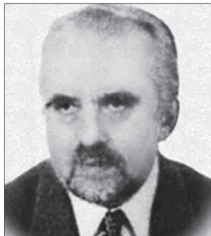
Ryc. 17. Andrzej Komorowski