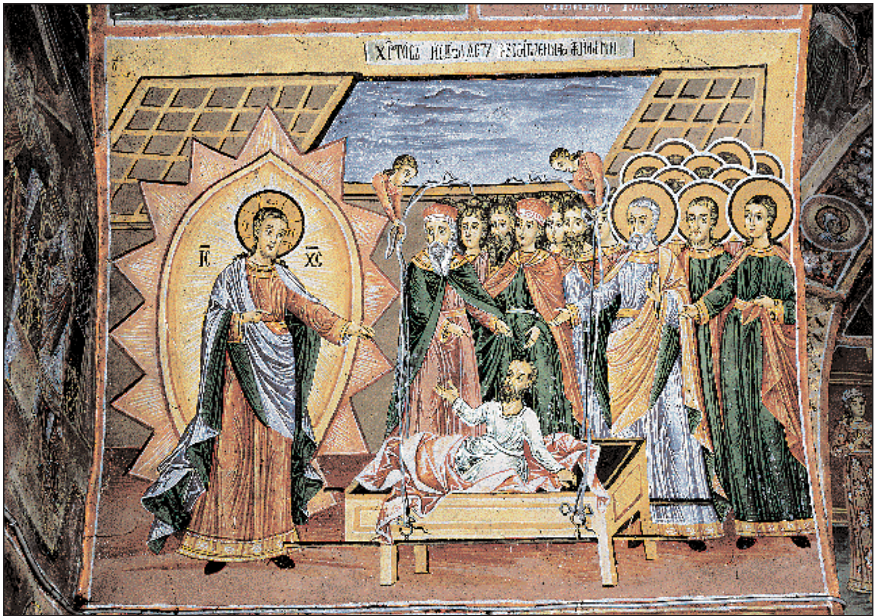
«Ο Χριστός θεραπεύει τον παράλυτο». Τοιχογραφία στο νάρθηκα του Καθολικού της μονής του Τρογιάν. Έργο του Ζαχαρία (1847).