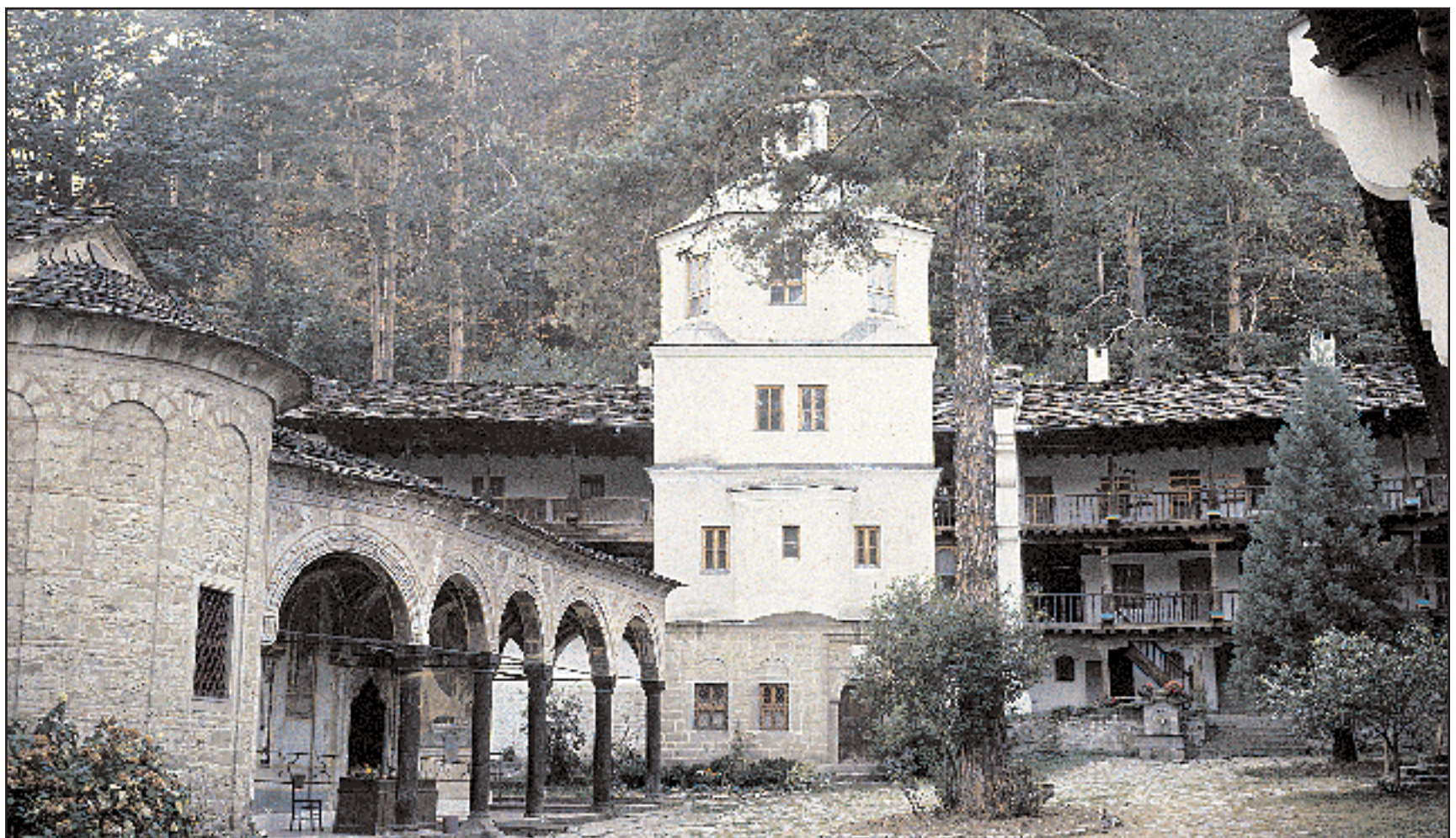
Γενική άποψη του μοναστηριού του Τρογιάν (Κοιμήσεως της Θεοτόκου). Βρίσκεται δίπλα στον ποταμό Τσέρνι Οσαμ και σε απόσταση 10 χιλιομέτρων από την πόλη Τρογιάν, μέσα σ' ένα πικνό πευκοδάσος.