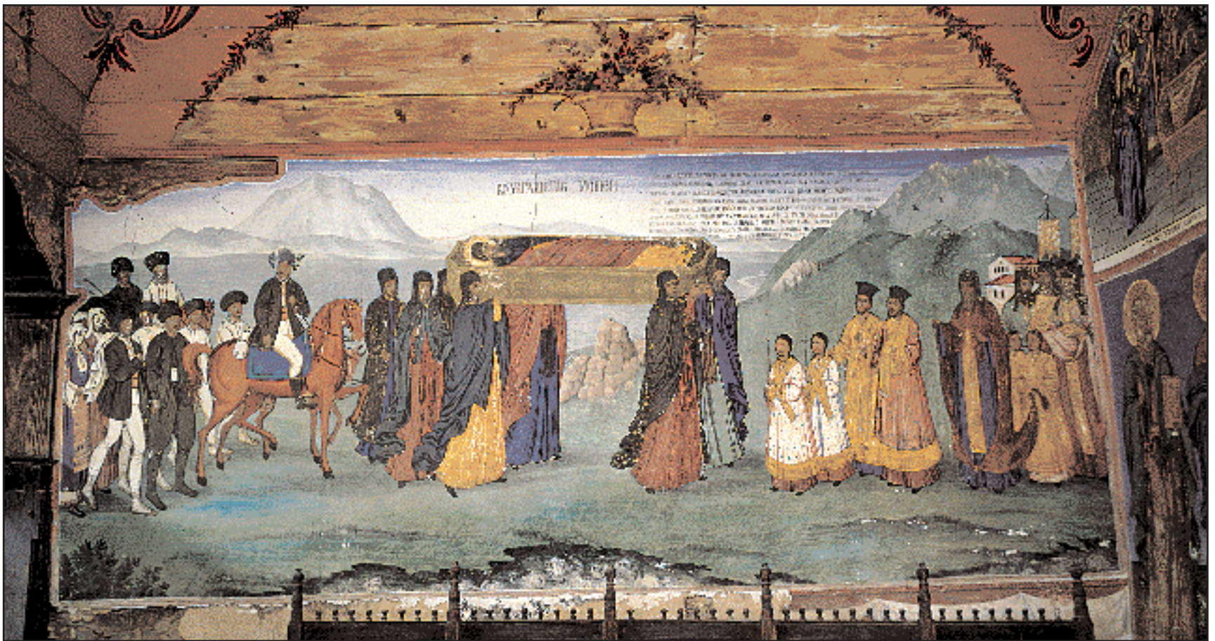
«Η μεταφορά των λειψάνων του Αγίου Ιωάννη της Ρίλας». Τοιχογραφία στο παρεκκλήσι των Αγίων Αποστόλων Πέτρου και Παύλου (1862) της μονής της Ρίλας.