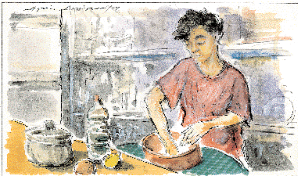
Του Ηλία Δελλόγλου

Έχει φτάσει πλέον ο καιρός για γενεσικές υπερβάσεις και κανονισμούς ακόμα και στα πιο κλασικά τραπέζια. Ωστόσο, θέλει τόλμη και φαντασία η... γαστρονομία.