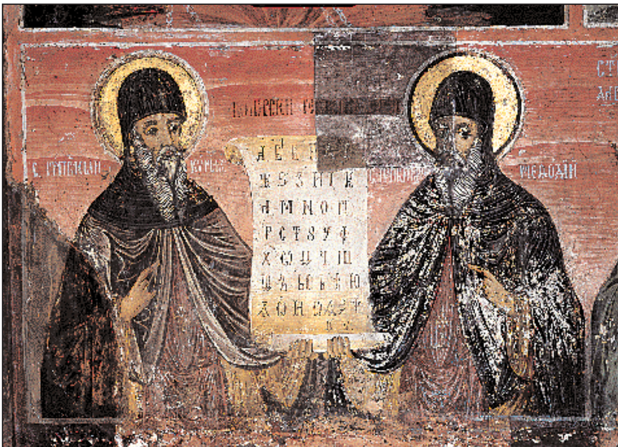
«Οι Άγιοι Κύριλλος και Μεθόδιος». Τοιχογραφία του ζωγράφου Ζαχαρία (1849), στην εκκλησία Μεταμορφώσεως του Σωτήρος.

Το μεσαιωνικό μοναστήρι-κάστρο είναι χτισμένο στη σκιά των τεραστίων βράχων του Μπελιάκοβο