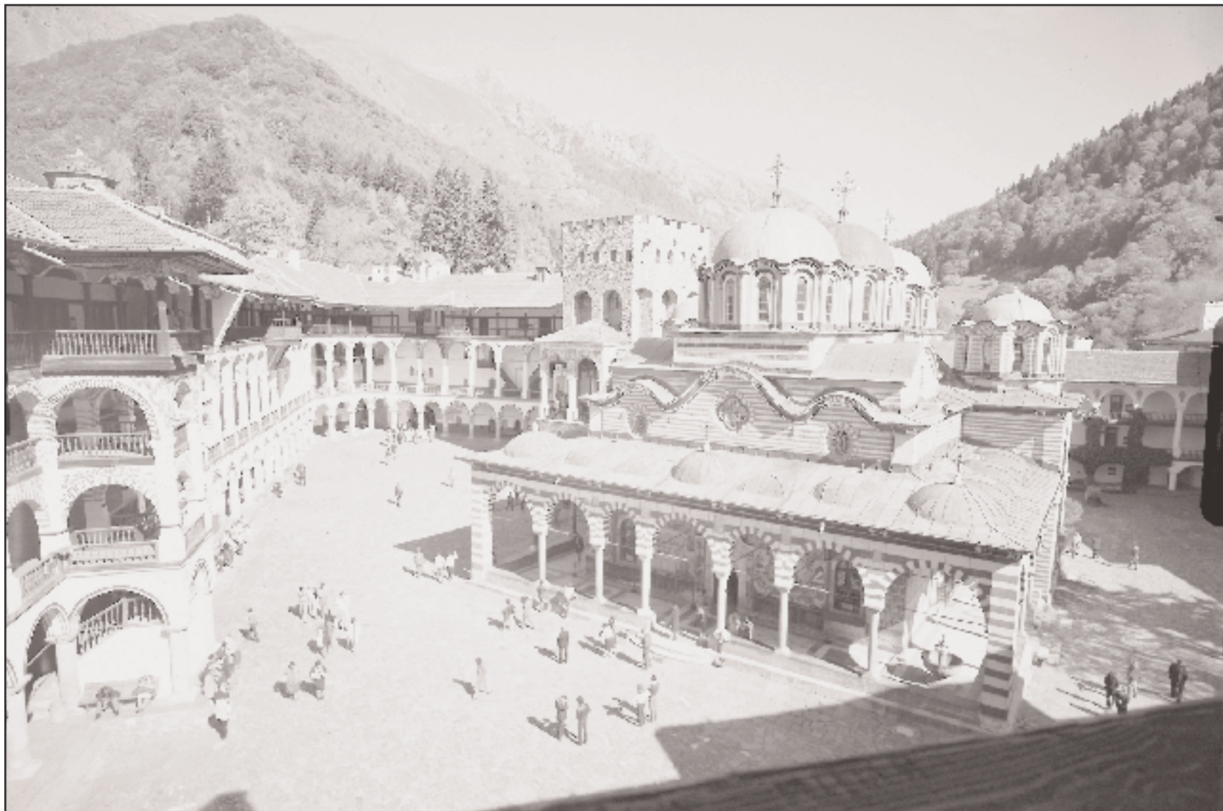
Το καθολικό της «Γεννήσεως της Θεοτόκου» και η βόρεια πτέρυγα του μοναστηριού της Ρίλας. Είναι το μεγαλύτερο θρησκευτικό, αλλά και φιλολογικό κοινόβιο της Βουλγαρίας, τόπος ιερός για το βουλγαρικό έθνος.