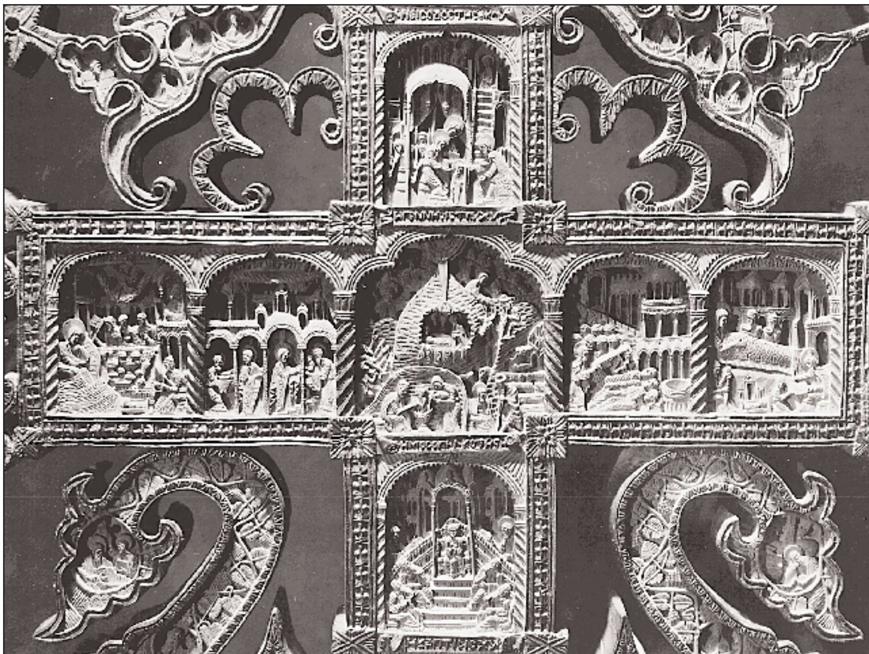
Σκηνές από τη ζωή του Χριστού. Λεπτομέρειες από τον ξυλόγλυπτο σταυρό του μοναχού Ραφαήλ, 1802. Μουσείο της μονής.

ψηλότερο επίπεδο της την τέχνη κατά την περίοδο που αποκαλούμε βουλγαρική αναγέννηση.