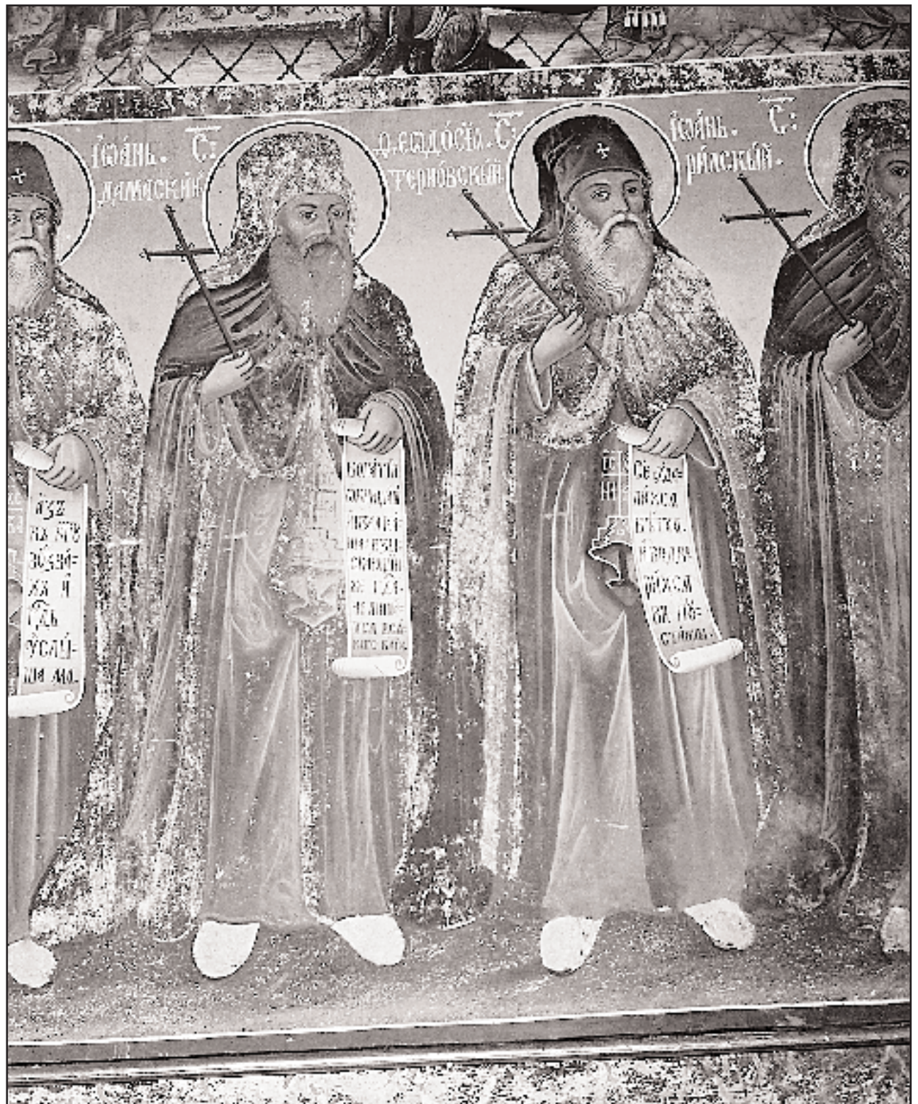
«Οι Άγιοι Ιωάννης ο Δαμασκηνός και Θεόδωρος του Τίρνοβο», τοιχογραφία του 1864 στο παρεκκλήσι των Εισοδίων της Θεοτόκου.

Τα μοναστηριακά κτίρια βρίσκονται στη βορειοανατολική πλευρά και σχηματίζουν μια στενόμακρη πτέρυγα με όμορφους εξώστες που