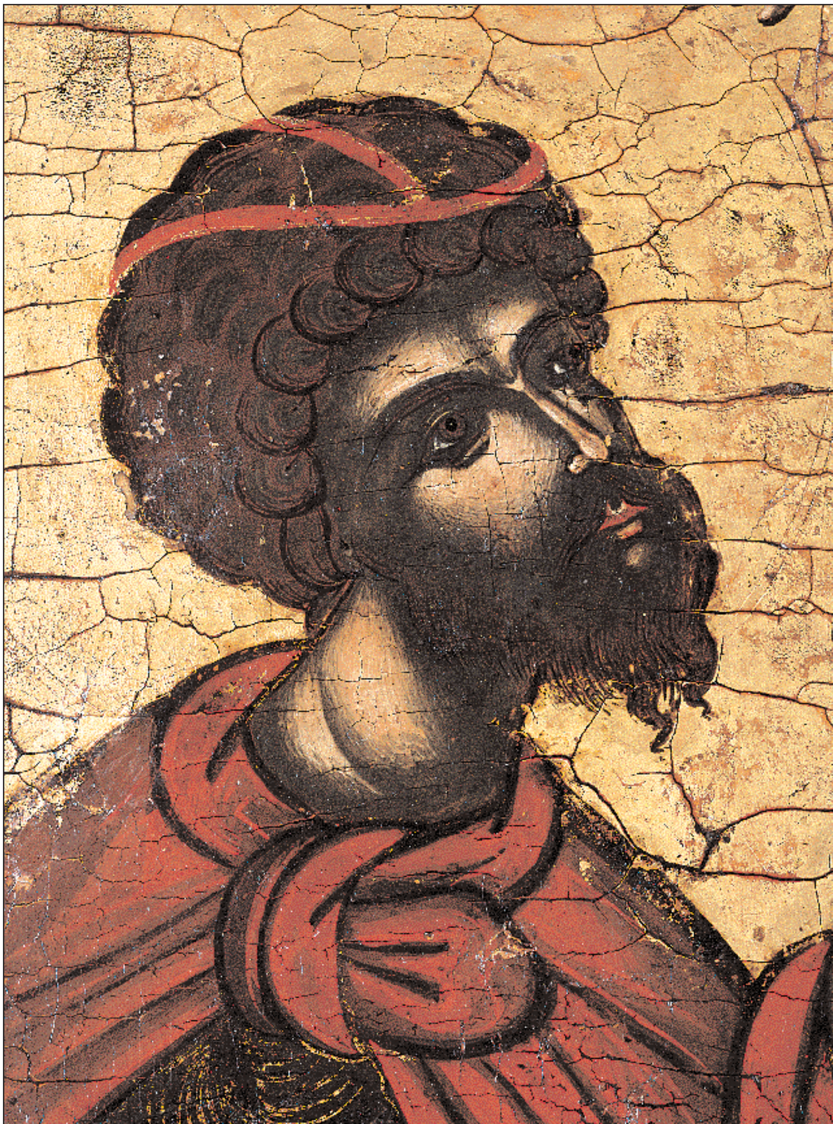
Ο Άγιος Θεόδωρος Τύρων. Λεπτομέρεια από την εικόνα «Οι Άγιοι Θεόδωρος Τύρων και Θεόδωρος Στρατηλάτης» (14ος αιώνας). Μουσείο της μονής του Ρόζεν.