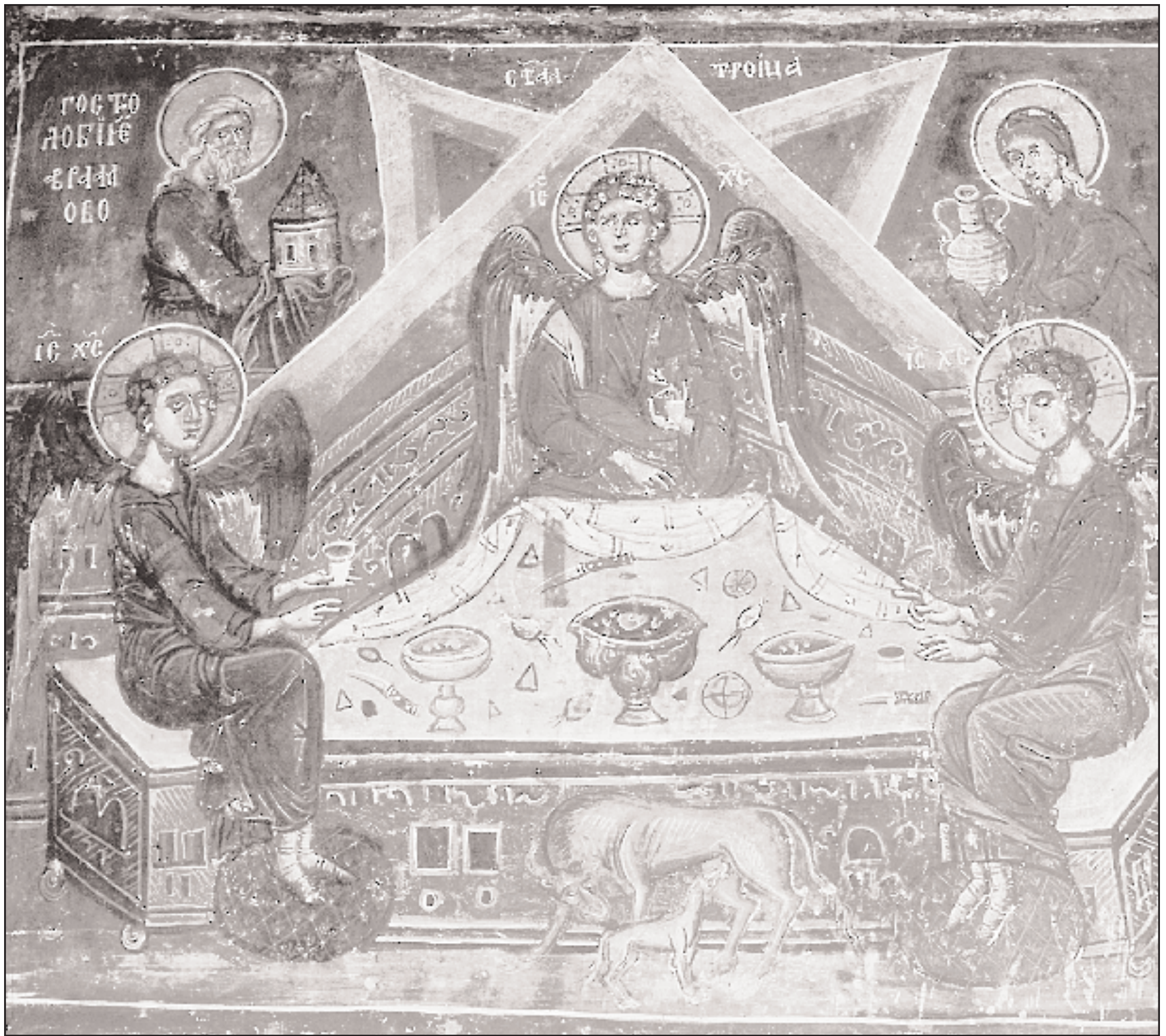
«Η φιλοξενία του Αβραάμ». Τοιχογραφία στον πρόναο της παλιάς εκκλησίας (1476).