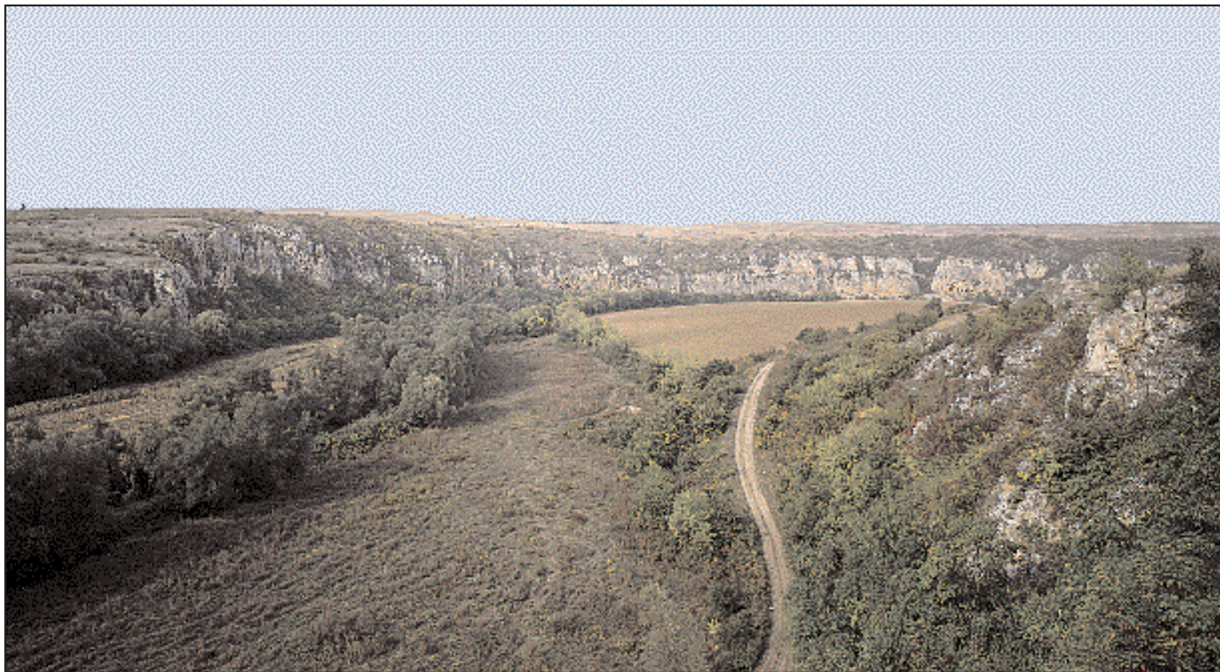
Τα βράχια των γκρεμών που ακολουθούν τις όχθες του ποταμού Ρούσενσκι Λομ, φιλοξενούν τις μικρές εκκλησίες και τα κελιά που έσκαψαν μέσα τους οι μοναχοί της περιοχής του Ιβάνοβο. Σήμερα σώζονται μόνον πέντε εκκλησίες με τμήματα τοιχογραφιών της μεσαιωνικής περιόδου.

Κελιά και μικρές εκκλησίες που δημιούργησαν μοναχοί και ερημίτες στους απότομους γκρεμούς του Ιβάνοβο