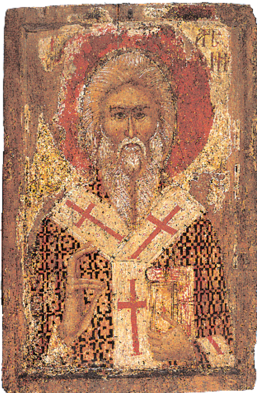
Ο Άγιος Αρσένιος. Εικόνα του 14ου αιώνα. Μουσείο της μονής.

Η εξέλιξη που σημειώνεται σ' ολοκληρωτή τη Βουλγαρία, -οικονομική, κοινωνική και πολιτική- τα πρώτα χρόνια της λεγόμενης βουλγαρικής αναγέννησης, επηρεάζει, όπως είναι φυσικό, και το μοναστήρι της Ρίλας. Η νέα αστική τάξη ενδιαφέρεται για την ιστορία και το μέλλον του μοναστηριού που δέχεται προσκυνητές από κάθε γωνιά της χώρας. Οι κτήτορες κάνουν κι αυτοί αισθητή την παρουσία τους. Στη μονή παραχωρούνται κτήματα και γίνονται κάθε είδους προσφορές: πανά-