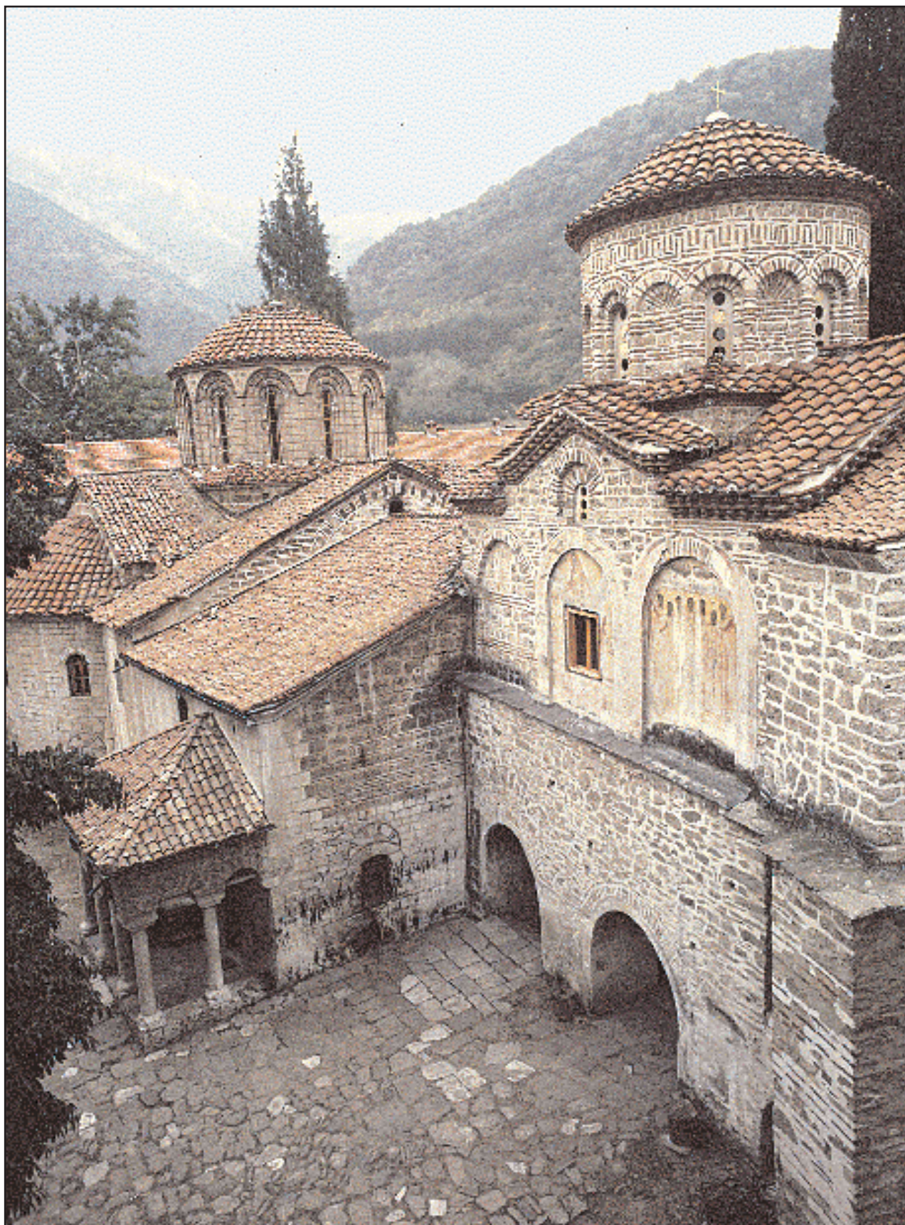
Το καθολικό της Μονής του Μπάτσκοβο (Παναγία του Πετριτού) και σε πρώτο πλάνο το παρεκκλήσι των Αγίων Αναργύρων.

Είναι αφιερωμένο στην Παναγία του Πετριτού και έχει ιστορία εννέα αιώνων