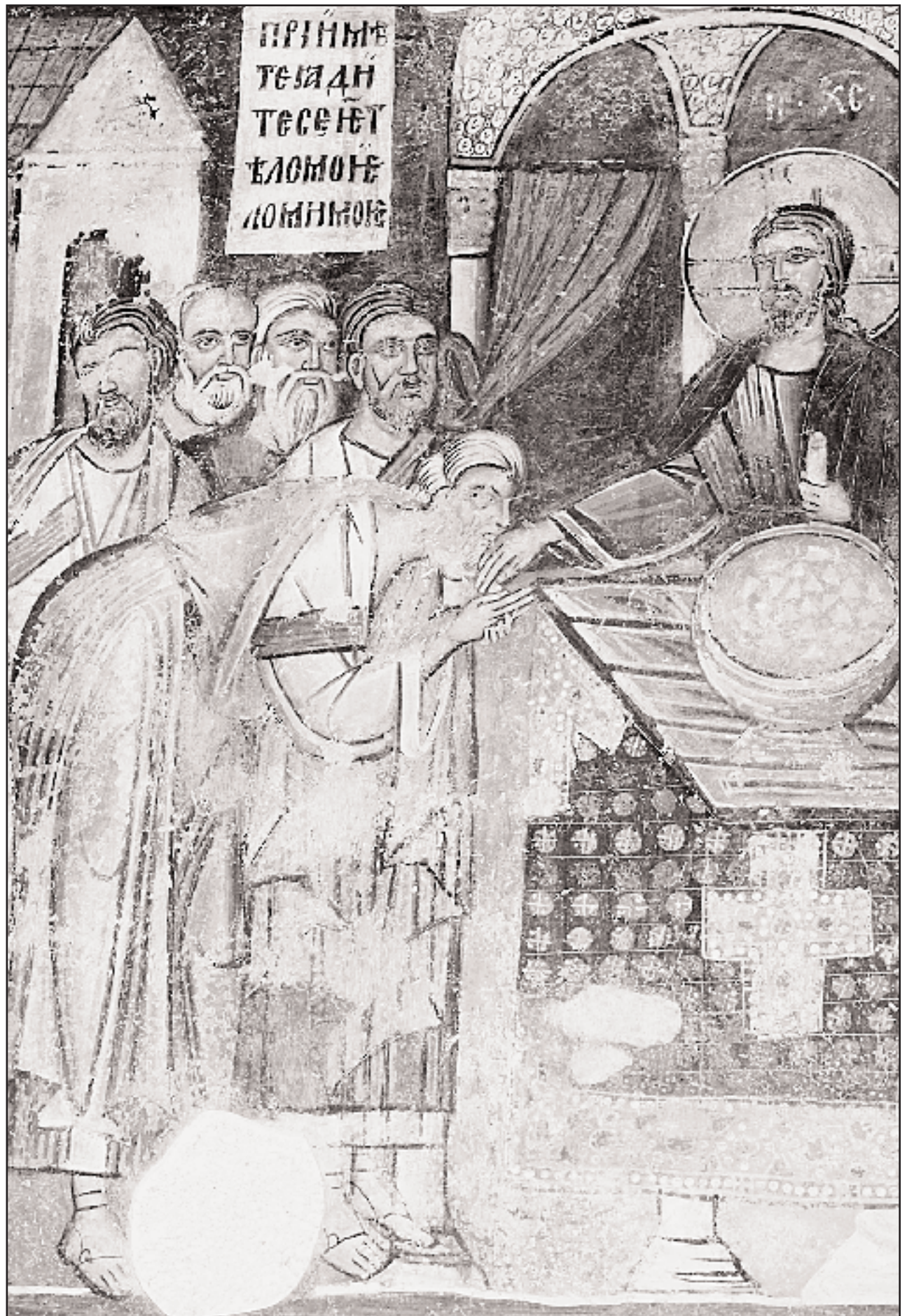
«Οι μαθητές του Χριστού παίρνουν τη θεία μετάληψη», τοιχογραφία του 14ου αιώνα στο ιερό της εκκλησίας του Αγίου Ιωάννη του Θεολόγου.

Σήμερα το μοναστήρι έχει ανακηρυχθεί σε εθνικό πολιτιστικό μνημείο.