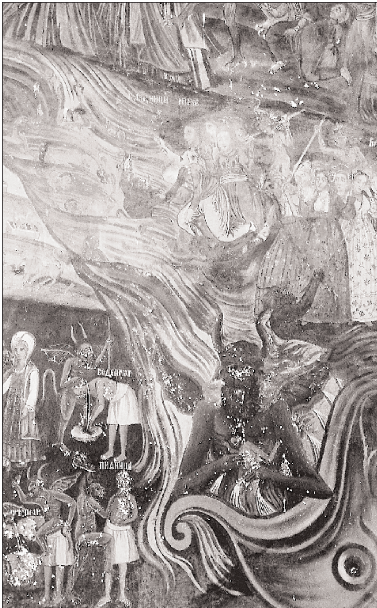
«Η Δευτέρα Παρουσία». Τοιχογραφία του Ζαχαρία, (1849) στον πρόναο του καθολικού.

μικά και τμήματα τοιχογραφιών. Δεν είναι γνωστός ο λόγος της μετατόπισης των κατοπινών κτισμάτων στη σημερινή τους θέση.