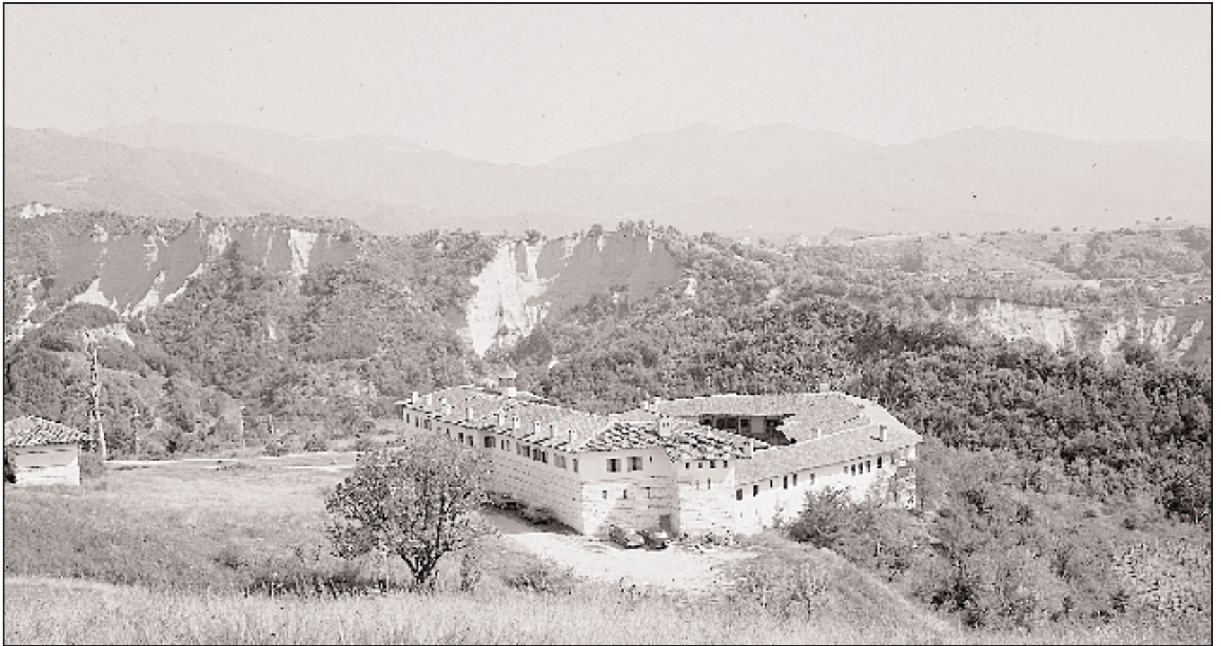
Το μοναστήρι του Ρόζεν. Βρίσκεται σ' ένα καταπράσινο ορεινό τοπίο, αρκετά κοντά στην πόλη Μέλνικ και τους περίφημους βράχους της περιοχής, στο νοτιοδυτικό άκρο της σημερινής Βουλγαρίας.