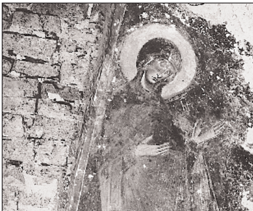
Η μορφή της Παναγίας σε τοιχογραφία του 12ου αιώνα στο οστεοφυλάκιο της Μονής του Μπάσκοβο.