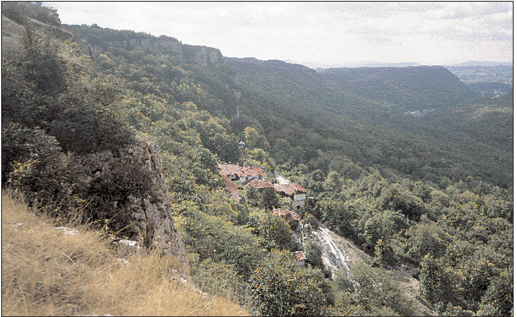
Γενική άποψη της περιοχής «Στενά του Ντερβέντ» στον ποταμό Γιάντρα και το συγκρότημα του μοναστηριού του Πρεομπραζέν.