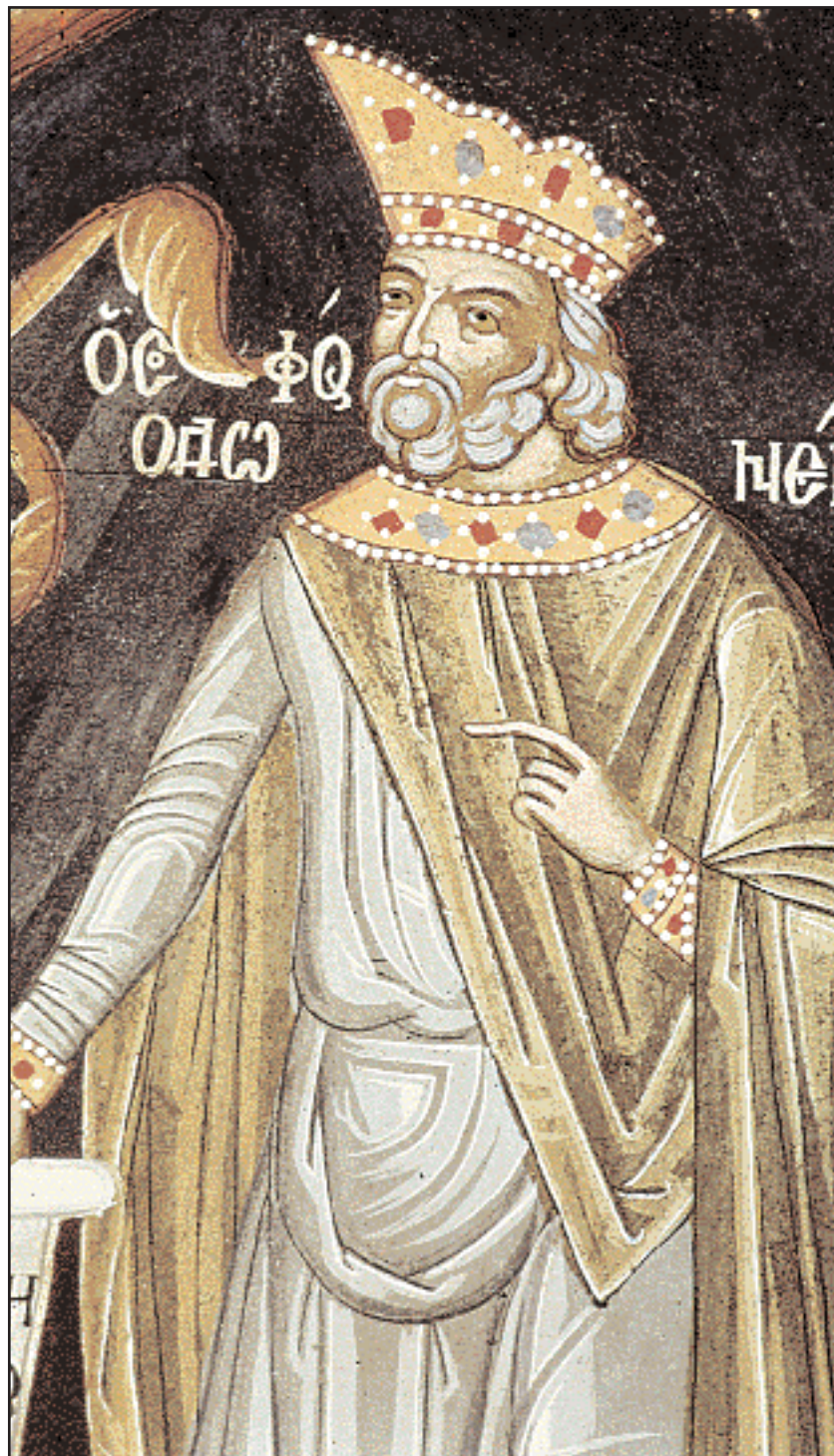
Αρχαίος φιλόσοφος, λεπτομέρεια από τοιχογραφία στην τράπεζα του μοναστηριού (1643).

ΤΟ ΜΟΝΑΣΤΗΡΙ του Μπάτσκοβο είναι, ίσως, το μοναδικό θρησκευτικό και πολιτιστικό κέντρο στο οποίο, επί αιώνες, συμβιούν και αναπτύσσονται παράλληλα τρεις πολιτισμοί: ο βυζαντινός, ο ελληνικός και ο βουλγαρικός. Η μονή είναι αφιερωμένη στην Παναγία του Πετριτού, ονομασία που πιθανότατα οφείλεται στο γειτονικό κάστρο «Πετριτός».