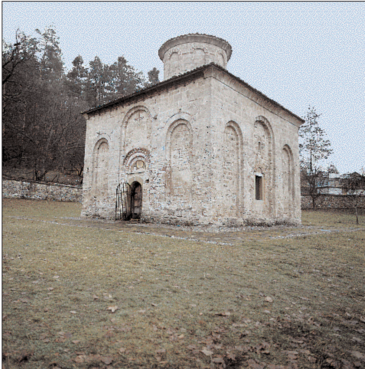
Η εκκλησία του Αγίου Ιωάννη του Θεολόγου στο μοναστήρι του Ζέμεν.

Στα χρόνια του Δεύτερου Βουλγαρικού Κράτους, (1186-1396), τα μοναστήρια συνεχίζουν την παράδοση και παραμένουν κέντρα μελέτης και διαφωτισμού. Οι μεγαλύτεροι Βούλγαροι φιλόλογοι στο δεύτερο μισό του 14ου αιώνα, όπως ο