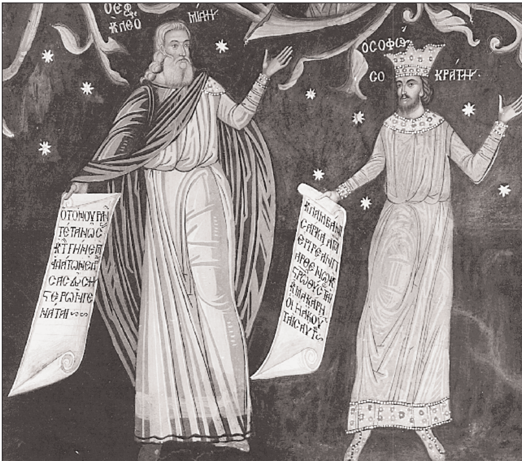
«Βασιλιάδες και φιλόσοφοι» (δεξιά ο φιλόσοφος Σωκράτης), λεπτομέρεια από τοιχογραφία στην Τράπεζα της μονής, (1643).