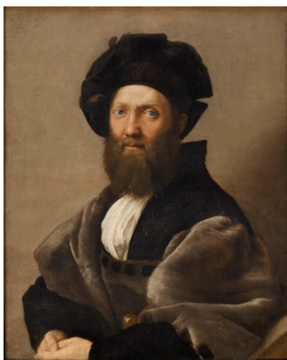
Retrato de Baldassare Castiglione, Rafael. París, Musée du Louvre

Desde el 12 de junio y hasta el próximo 16 de septiembre en el Museo del Prado se puede visitar El último Rafael , una de las exposiciones más importantes dedicadas al artista y su taller, y la primera centrada en sus años finales, etapa de su producción que le convirtió en el pintor con más influencia en el arte occidental. La muestra expone setenta y cuatro obras en total, de las cuales la mayoría no se han mostrado nunca antes en España, trazando un recorrido cronológico por la actividad del maestro, desde el inicio del pontificado de León X (1513) hasta su muerte en 1520, y de la de sus principales discípulos, Giulio Romano y Gianfrancesco Penni, hasta finales de 1524.