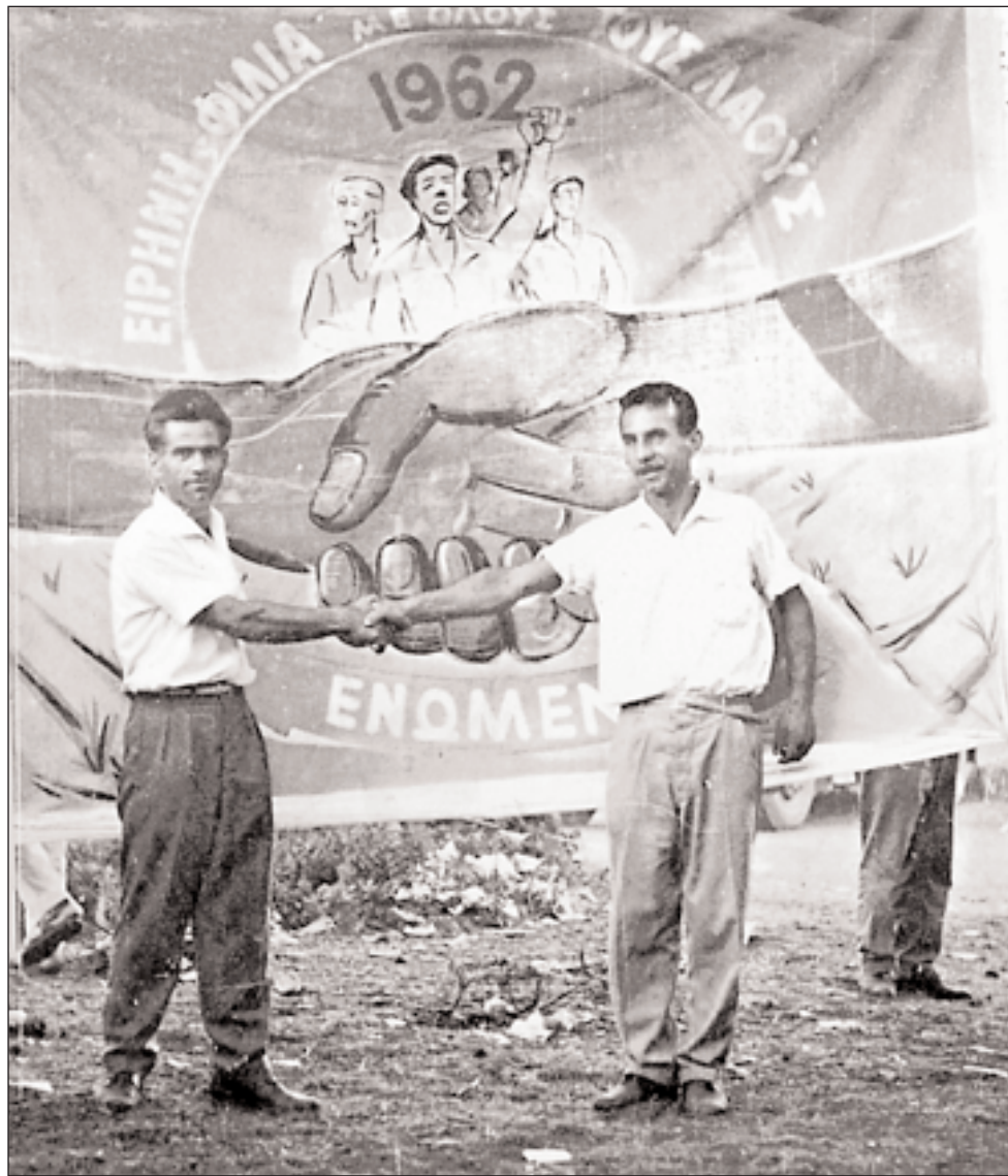
◀ Αθήνα, Εργατική Πρωτομαγιά 1962. Μέλη των Σωματείων Πλακάδων Οικοδόμων ανταλλάσσουν συμβολική χειραψία αγωνιστικής ενότητας. Ο δυναμισμός και το ειδικό κοινωνικό βάρος των οικοδόμων τις δεκαετίες 1950 και, ιδίως, 1960, ακολούθησε τον κλάδο «οικοδομή» στην πτωτική του πορεία, μετά την ασφυκτική οικοδόμηση των αστικών τσιπών.

σε «ανώτερους» και «κατώτερους», σε «καλλιεργημένους» και «άξεστους», αναδεικνύοντας την ύπαρξη κοινωνικού κεφαλαίου σε σημαντική παράμετρο κοινωνικής κατηγοριοποίησης και διάκρισης. Επομένως, η έννοια του κοινωνικού κεφαλαίου (που θα το ορίζαμε ως ένα σύστημα προδιαθέσεων του ατόμου, οι οποίες εξωτερικεύονται με πρακτικές και προτιμήσεις 9 ) καθίσταται ένα χρήσιμο εργαλείο για να κατανοήσουμε πώς τα άτομα με διαφορετική κοινωνική καταγωγή αντιλαμβάνονται την αισθητική πραγματικότητα (μουσική, τέχνη κ.λπ.), πώς εκφράζονται αισθητικά, ποια σημασία αποδίδουν στην καλλιτεχνική δημιουργία και πώς ταξινομούνται στον κοινωνικό χώρο. Όμως οι προδιαθέσεις αυτές σχετίζονται άμεσα με την κοινωνική τάξη στην οποία εκ των πραγμάτων βρίσκεται τοποθετημένο το άτομο, και, μολονότι έχουν εξατομικευτεί (δηλ. φέρονται και ενεργοποιούνται ατομικά