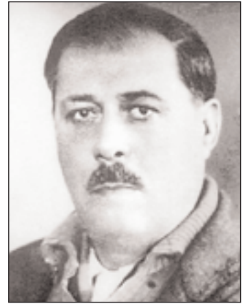
▶ ▼ Ο Μάρκος Βαμβακάρης, φωτογραφία στο ατομικό του βιβλιόραμα υγείας (κάτω), όταν, στα τέλη του Μεσοπολέμου, ο Συριακός ρεμπέτης δούλενε εκδοροσφαγέας στα σφαγεία της Αθήνας και τον Πειραιά (ιδιωτική συλλογή. «Ιστορία της Ελλάδας τον 20ού αιώνα», Βιβλιόραμα).