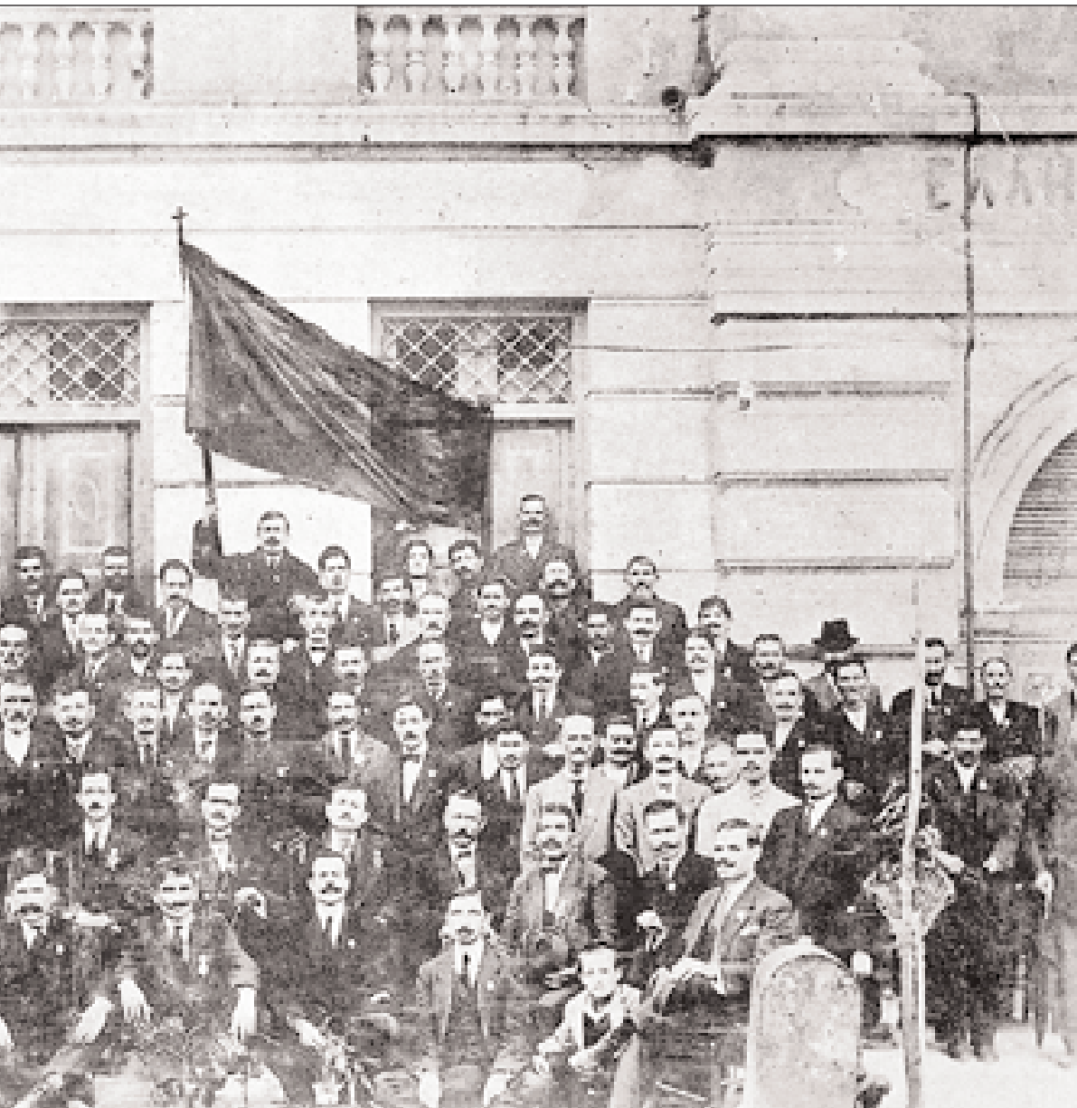
◀ Αναμνηστική φωτογραφία από το ιδρυτικό συνέδριο της Γενικής Συνομοσπονδίας Εργατών Ελλάδος, Οκτώβριος 1918. Στο συνέδριο εκπροσωπήθηκαν 60.000 οργανωμένοι εργάτες, σε σύνολο 100.000 πανελλαδικά (ΓΣΕΕ - Αρχείο Ιστορίας Συνδικατίων).

άρχιζε να γιορτάζεται από το 1893 και 1894 και στην Αθήνα, με πρωτοβουλία των πρώτων Ελλήνων σοσιαλιστών Πλάτωνα Δρακούλη, Σταύρου Καλλέργη κ.ά., υπό την καθοδήγηση του Κεντρικού Σοσιαλιστικού Συλλόγου.