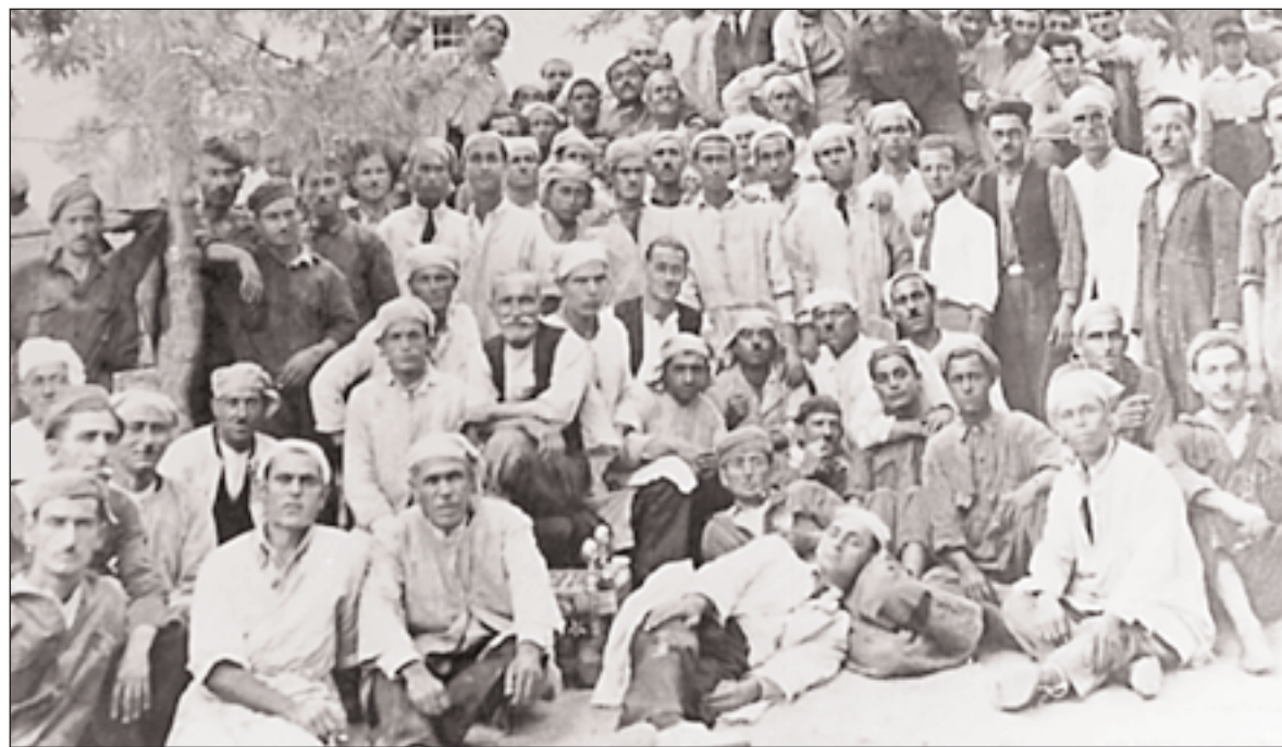
▼ Καπνεργάτες σε καπναποθήκη της Καβάλας το 1925. Οι καπνεργάτες νηήρξαν από τα πιο μαχητικά και συνειδητοποιημένα τμήματα της εργατικής τάξης τον Μεσοπόλεμο. Οι απεργίες τους το 1927-28 νηήρξαν σταθμός στην ιστορία του εργατικού κινήματος.