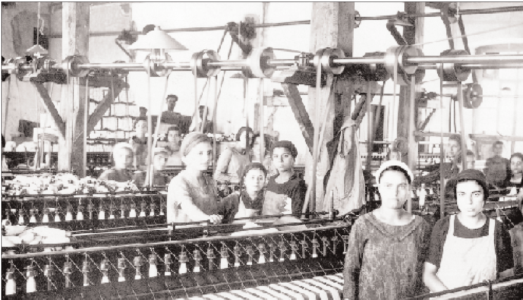
▲ Η ελληνική βιομηχανία παρουσιάζει σημαντικούς ρυθμούς ανάπτυξης το διάστημα 1921-1929. Στη φωτογραφία, εργάτριες, πολλές από τις οποίες ανήλικες, μπροστά στις μηχανές νηματοργείου της Νάουσας, δεκαετία του 1920.