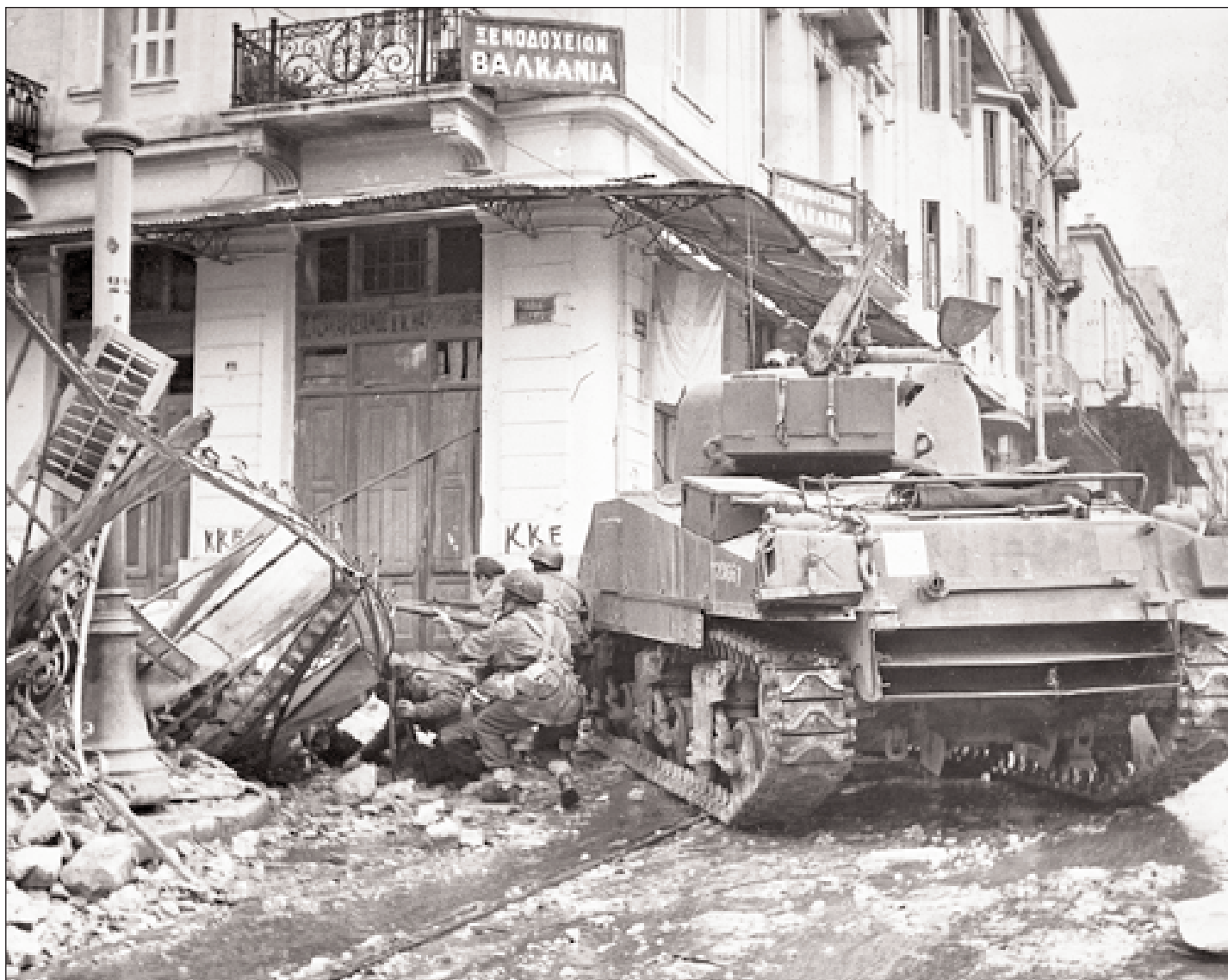
◀ Αθήνα, Δεκέμβριος 1944. Βρετανοί κομάντος στη «μάχη της Αθήνας», που σώριασε ό,τι είχε αφήσει όρθιο η γερμανική κατοχή. Ο «μικρός Δεκέμβρης του '44» ήταν η αρχή μόνο της ολέθριας εμφύλιας σύγκρουσης, που επιμόλυνε όλες τις εκφάνσεις της κοινωνικής ζωής για πολλές δεκαετίες (Ε.Α.Ι.Α.).

«Κι έτσι ύστερα από κάμποσες μέρες έμαθα πού βρίσκονταν η πατρίδα. Δεν ήτανε διόλου χαμένη όπως πιστεύανε μερικοί.»