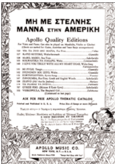
▲ Το εξώφλλο της παρτιτούρας του τραγουδιού των Γ. Καμβύση-Α. Σέμου «Μη με στέλνεις μάννα στην Αμερική». Εκδόθηκε στις ΗΠΑ το 1935.

το 1924 έχει απαγορευθεί η ελεύθερη μετανάστευση στις ΗΠΑ, και εν γένει έχουν περιοριστεί σημαντικά οι μετακινήσεις των Ελλήνων προς το εξωτερικό για μόνιμη εγκατάσταση.