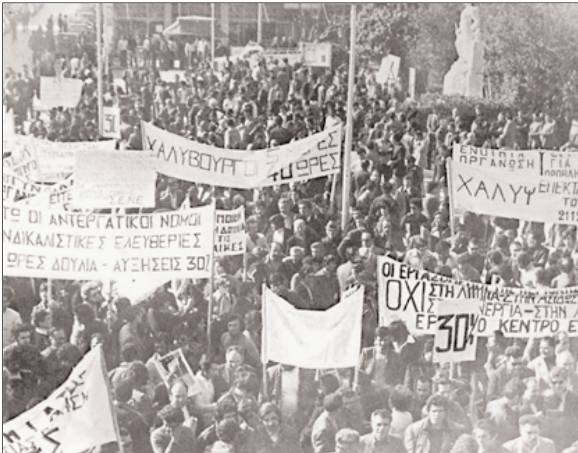
◀ Πρωτομαγιάτικη εργατική συγκέντρωση των εργαζομένων στην Ελεούσα, 1978. Η Ελεούσα ανήκει χαρακτηριστικά στους βιομηχανικούς οικισμούς που δημιουργήθηκαν για την άμεση πρόοδοση του εργατικού δυναμικού στην επιχείρηση, χωρίς συνολική και μακροπρόθεσμη αναπτυξιακή σκόπευση και προοπτική.

λέντο, κλίση, έφεση κ.ο.κ.), πράγμα που όμως ισοδυναμεί με φυσιοποίηση των κοινωνικών διαφορών.