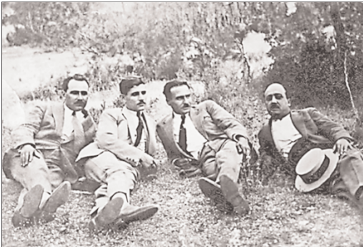
◀ Τέσσερις μεγάλοι δημιουργοί του λαϊκού τραγουδιού τη δεκαετία των 1930, σε μια σπάνια κοινή φωτογράφιση. Από αριστερά: Κώστας Καρίπης, Κώστας Τζόβανος, Γιάννης Αραγάτισης ή Ουδονιάκης, Μήτσος Αραπάκης.