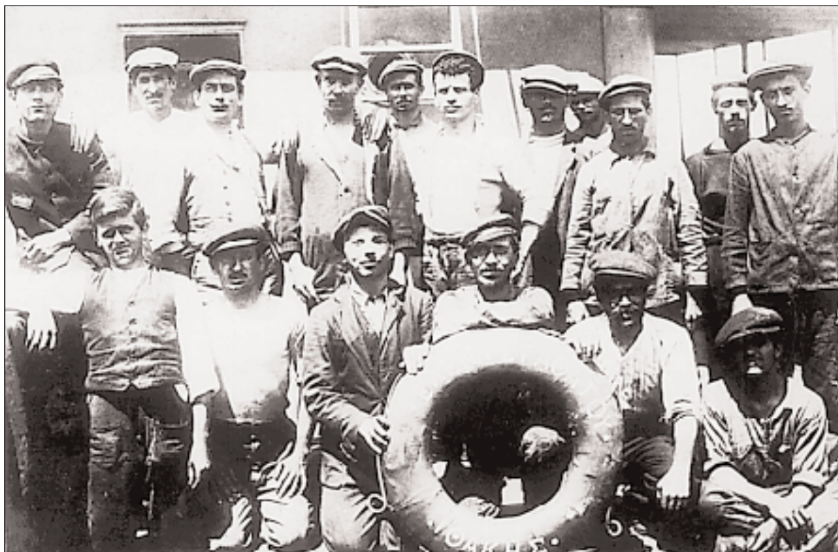
◀ Μεσοπόλεμος. Έλληνες ναυτικοί, πλήρωμα εμπορικού πλοίου της προπολεμικής ακμής της υπερπόντιας ελληνικής ναυτιλίας.

Α. Μπερνάρη, «Διερεύνησις Ελληνικής Διαρθρώσεως και Επεκτατικής Οικονομική Πολιτική», Αθήνα 1947.