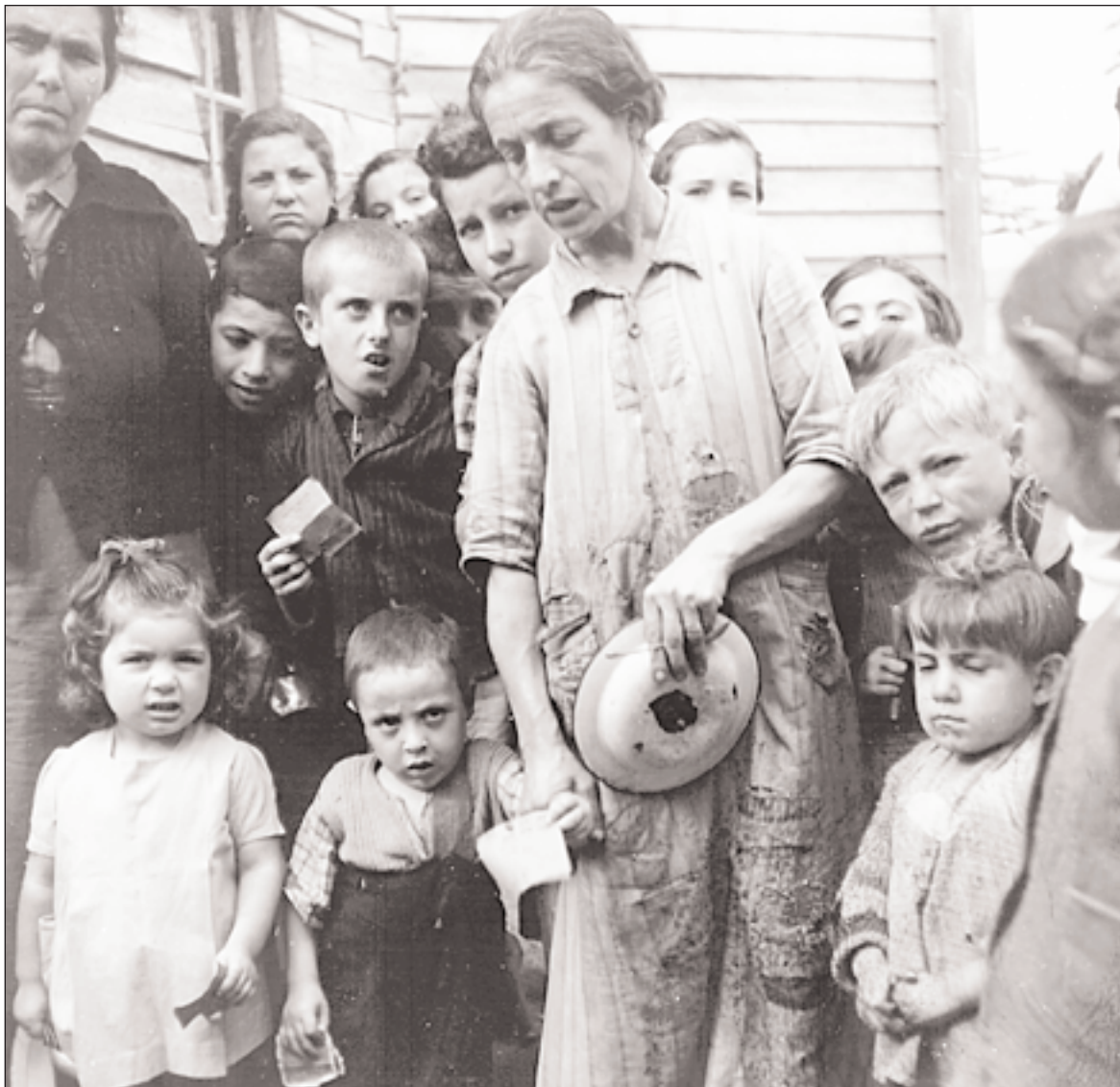
◀ Στην κατεχόμενη Ελλάδα, η πείνα και η εξαθλίωση έπληξαν κυρίως τις πόλεις και την εργατική τάξη. Οι νεκροί από αστία ή υποσιτισμό έφτασαν το 1941-45 τις 300.000.

Σύμφωνα με την απογραφή του 1928, ο ενεργός πληθυσμός της χώρας ήταν 2.603.553 άτομα, οι εργάτες και οι εργάτριες ήταν 686.532 (26,4%). Η βιομηχανία απασχολούσε 252.924 άτομα, 51.146 απασχολούνταν στις μεταφορές ενώ οι αγεργάτες/τριες ήταν 95.618· 170.000 άτομα απασχολούνταν σε διάφορους άλλους κλάδους. Οι υπάλληλοι, δημόσιοι και οι ιδιωτικοί, ήταν 165.773, το 6,4% του οικονομικά ενεργού πληθυσμού.