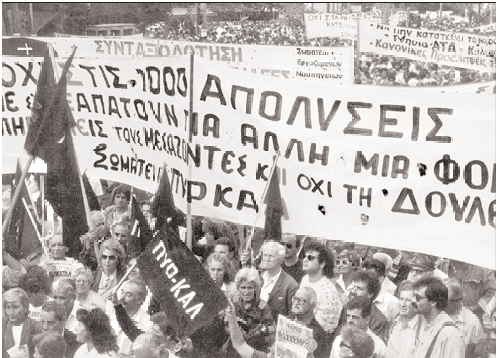
▲ Αθήνα 1990. Συγκέντρωση διαμαρτυρίας των εργαζομένων στην ΠΥΡΚΑΛ κατά των σχεδιαζόμενων απολύσεων. Το κύμα αποβιομηχανικής και η προϊόδια «τριτογενή παραγωγή» προκάλεσαν ανασύνθεση της ελληνικής εργατικής τάξης και διαίωναση της αουέχιας που χαρακτήριζε ανέκαθεν την κοινωνική της ύπαρξη (ΓΣΕΕ - Αρχείο Ιστορίας Σνδικάτων).

νίκευση, από το 1974 και μετά, της μισθωτοποίησης και η εμφάνιση του κράτους πρόνοιας (συλλογικές συμβάσεις, κοινωνική ασφάλιση, κοινωνικός μισθός, οικιστικά προγράμματα κ.λπ.) –επιλογή υπαγορευμένη από την ανάγκη νομιμοποίησης του πολιτικού καθεστώτος– υποκαθιστούσε παραδοσιακά εργατικά περιβάλλοντα και συμβιωτικές πρακτικές με γραφειοκρατικές δομές. Επιπλέον, η εκπροσώπηση της εργατικής τάξης από ένα νέο σώμα συνδικαλιστών προερχόμενων κυρίως από τα υπαλληλικά στρώματα της ελληνικής εργατικής τάξης, με διαφορετικές αντιλήψεις και τρόπους ζωής, εξασθένιζε παραπέρα και εκείνο το κλίμα εργατισμού (εργατική περηφάνια, έμφαση στην χειρωνακτική εργασία κ.λπ.) που έδενε πολιτισμικά τις εργατικές υποκουλτούρες της ελληνικής εργατικής τάξης. ❀