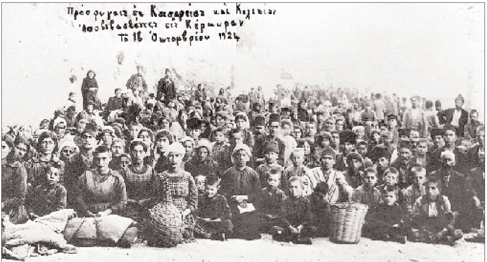
▲ Κέρκυρα, Οκτώβριος 1924. Πρόσφυγες από την Καισάρεια και την Κιλικία λίγο μετά την αποβίβασή τους στο νησί. Το προσφυγικό κύμα επέφερε ριζική τομή στην ελληνική οικονομία και κοινωνία (Αθήνα, Κέντρο Μικρασιατικών Σπουδών).

διακρίνουμε καθαρά δύο φάσεις: 1900-1922 και 1922-1940. Όλοι οι παράγοντες (οικονομικοί, κοινωνικοί, πολιτικοί και πολιτισμικοί) που συνέβαλαν στη διαμόρφωση της εργατικής τάξης επηρεάζονται σε τέτοιο βαθμό από τις συνέπειες που είχε πάνω στην οικονομία και την κοινωνία η προσφυγική πληθυσμιακή εισροή –οδυνηρό αποτέλεσμα της Μικρασιατικής Καταστροφής– ώστε να μιλάμε για μια μεγάλη τομή που επέρχεται το 1922. Έτσι, η περίοδος 1922-1940 καθίσταται ένα νέο αφετηριακό σημείο για τη μελέτη της συγκρότησης της εργατικής τάξης, αλλά και των πολιτικών και κοινωνικών αλλαγών που θα επέλθουν την επόμενη δεκαετία, εκείνη του 1940.