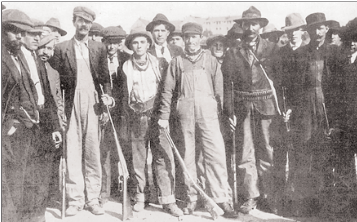
◀ Ενοπλιοι απεργοί ανθρακωρύχοι στα δραματικά γεγονότα του Κολοράντο των ΗΠΑ, το μαιωμένο Ελληγικό Πάοχα τον 1914, στα οποία πρωτοστάτησαν Ελληγες συνδικαλιότητες, με επικεφαλής τον Λούη Τίκα, από το Ρέθηνγο, που δολοφονήθηκε άνανδρα.