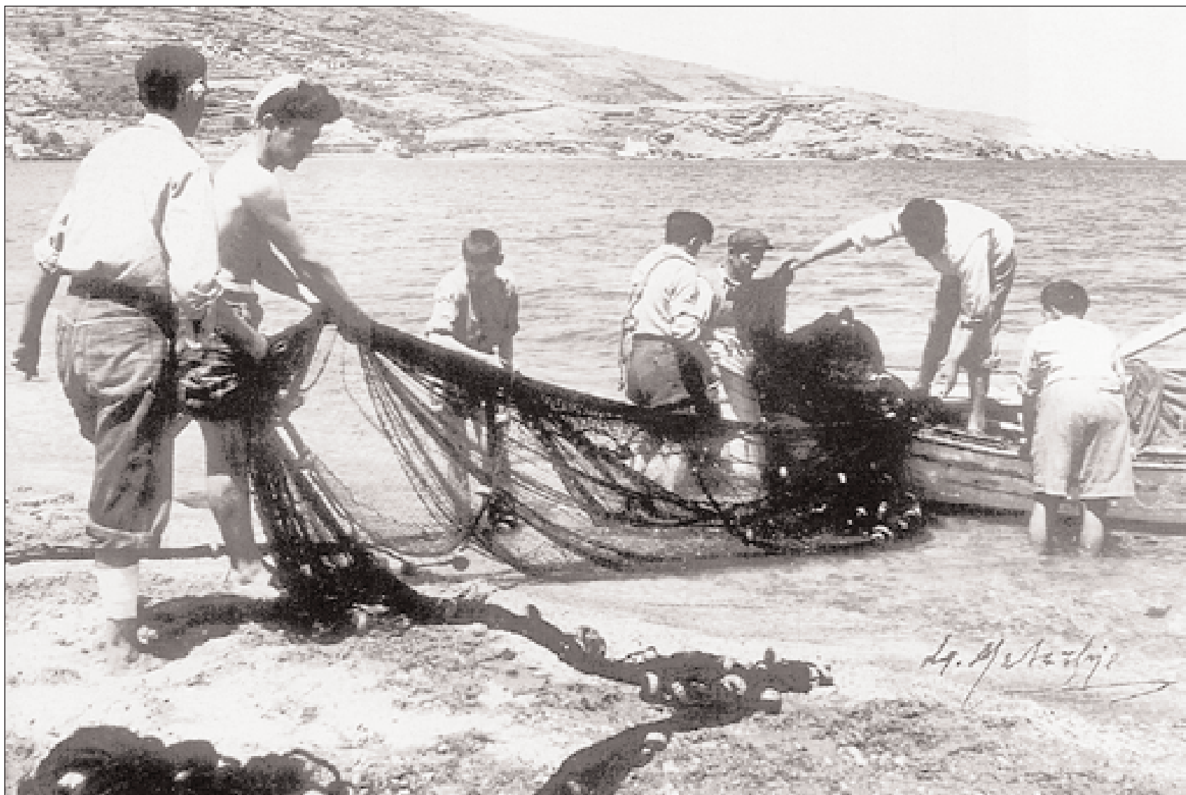
▲ Φαράδες στην Πρέβεζα. Τα επαγγέλματα της θάλασσας έχουν περίοπτη θέση σε θεματολογία του λαϊκού τραγουδιού τόσο πριν όσο και μετά τον Μεγάλο πόλεμο.