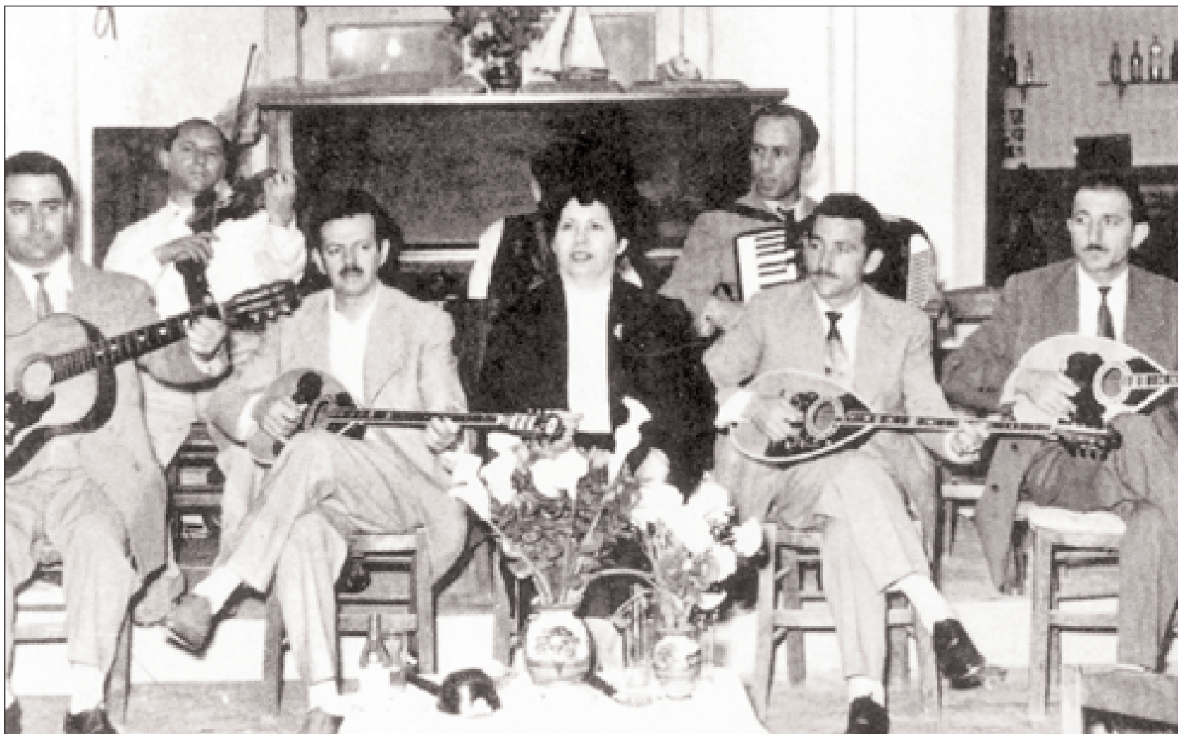
▲ Ο Βασίλης Τσιτσάνης, με τη Μαρίκα Νίνου και τον Γιώργο Μανιασή, στον «Γζίμη του Χονδρού», στο 77 της οδού Αχαρνών, το 1950. Πολλά από τα καλύτερα τραγούδια του κορυφαίου των Ελλήνων λαϊκών δημιουργών μαράζωναν στις λίστες Λογοκρισίας της αστυνομικής διεύθυνσης Αθηνών, ως έχοντα «αλληγορικήν σημασίαν, εξ ου δύνανται να δημιουργηθούν αντεγκλήσεις και διασάλευσις της τάξεως».