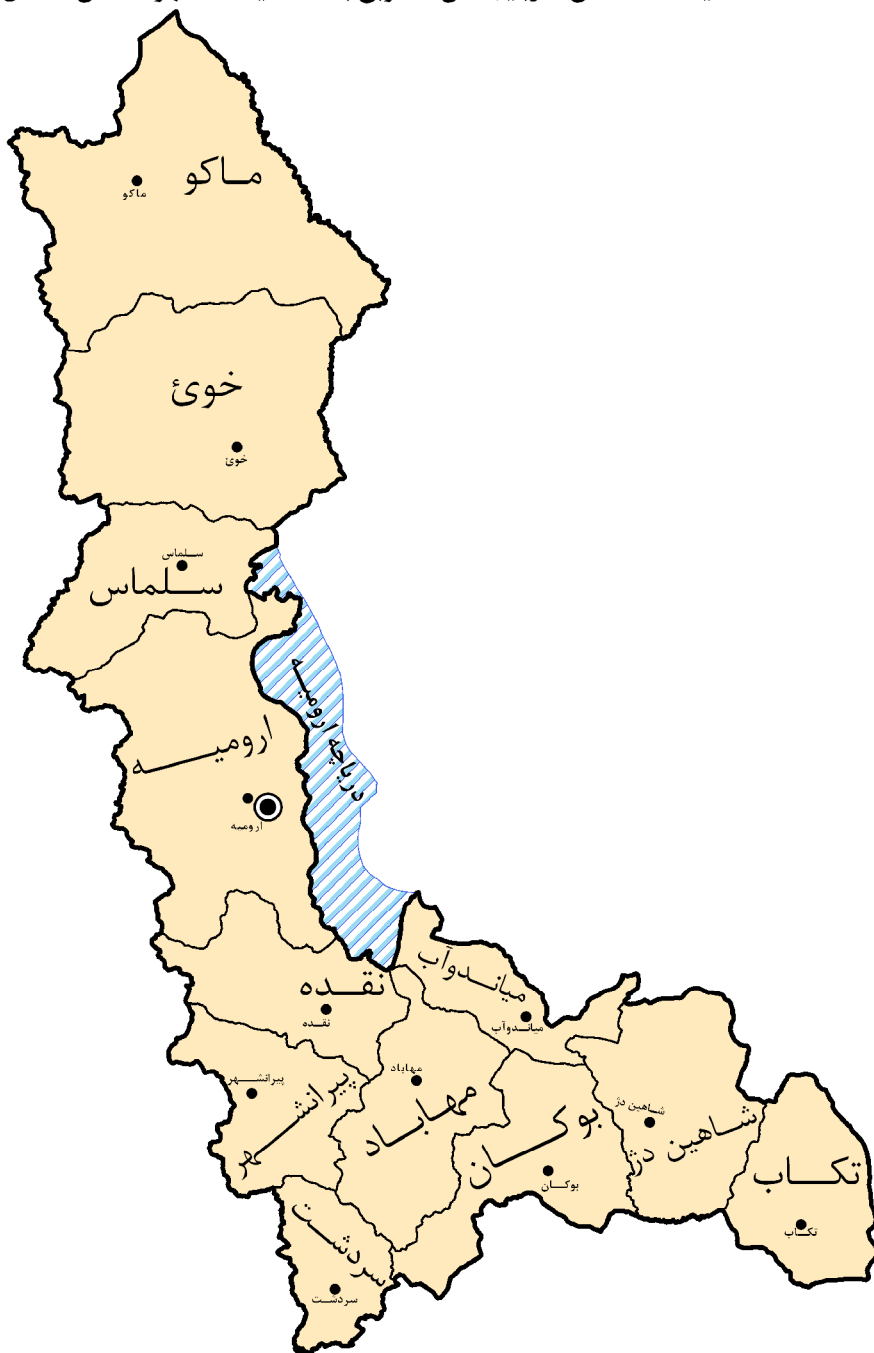
نقشه تقسیمات استان آذربایجان غربی به تفکیک شهرستان سال ۱۳۷۵