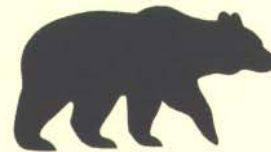
Apumakokeessa käytettävä karhukuvio