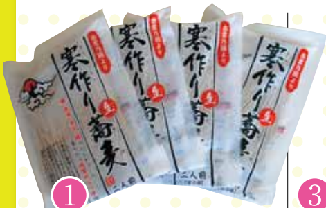
1 出雲生そば 要冷蔵 [冷蔵・200g×4袋(つゆ付)]

山陰中央新報を新規に購読していただける方を紹介していただければ、感謝の気持ちを込めて、ちょっと気のきいたグッズ(7点の中から希望の品1点)をプレゼント