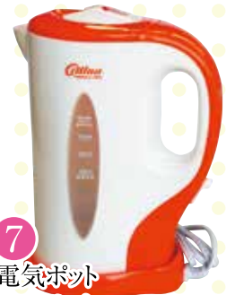
7 電気ポット オルディナ [0.8L]