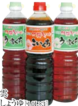
3 奥出雲 紅梅しょうゆ [1.0L×3]