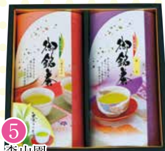
5 森山園 お茶詰め合せ [80g×2]