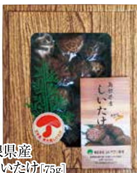
4 島根県産 乾しいたけ [75g]