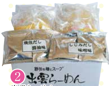
2 出雲らーめん [100g×8袋(スープ付)]