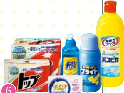
6 トップクリーン ライフセット