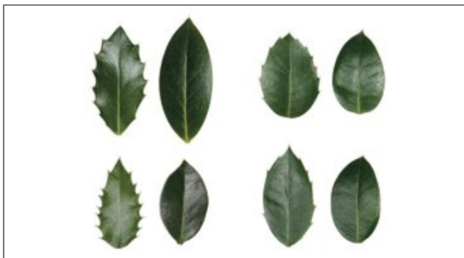
Vier Paare von Stechpalmenblättern mit und ohne Stacheln von unterschiedlichen Sträuchern. Jedes Paar stammt vom selben Zweig.

Stechpalmen ( Ilex ) besitzen zwei Arten von Blättern: stachelige und kaum stachelige. Jetzt entdeckten spanische Biologen, dass die Pflanzenteile ihr epigenetisches Programm und damit ihre Gestalt ändern können. Die Forscher analysierten Blätter von 40 Stechpalmen und fanden, dass an der DNA der stacheligen Blätter deutlich weniger Gene per Methylierung abgeschaltet sind, als bei den anderen Blättern. Entscheidend dafür, welche Entwicklung ein Blatt wählt, ist offenbar das Risiko, gefressen zu werden. Denn je weniger Fressschäden ein Zweig besitzt, desto mehr stachellose Blätter trägt er. |