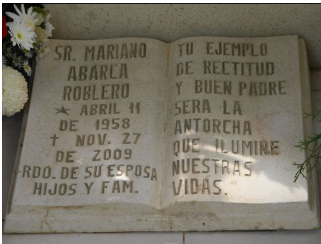
Epitafio para Mariano, noviembre de 2012.

Sin embargo, en comunicaciones internas el comisionado de Comercio sugirió utilizar un tono más suave: “Aquí [en México] es delicado que Canadá haga una declaración mediante la cual ‘exhorta’ a México [a realizar una investigación], ya que podría entenderse que sin nuestro requerimiento no habría investigación.” 83 No obstante, por esas mismas fechas Amnistía Internacional había advertido de la existencia de impunidad generalizada en México ante los ataques perpetrados contra defensores y defensoras de derechos humanos, la cual atribuía en parte a la falta de “esfuerzos sustantivos [...] por investigar sus casos o por brindar protección efectiva,” persistiendo la “impunidad ante las violaciones anteriores y actuales a los derechos humanos.” 84