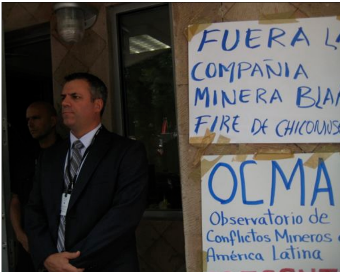
Afiches sobre la embajada canadiense en México, Julio del 2009.

De los documentos divulgados se desprende que, al menos durante las etapas iniciales de la operación de Blackfire, el apoyo de la Embajada resultó esencial para la exitosa apertura de la mina y, además, que ese apoyo incluyó la presión diplomática sobre funcionarios del gobierno de Chiapas. Por otra parte, no existe evidencia de que la Embajada haya alentado el acatamiento de las directrices de RSC y mucho menos de que lo haya exigido como condición para obtener su asistencia. Tampoco existe indicación alguna de que la Embajada haya dado seguimiento a los temas planteados en torno a la falta de una consulta previa adecuada a las comunidades afectadas; por el contrario, la Embajada intervino frente al gobierno estatal para impulsar la operación de la mina.