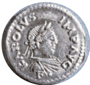
▲ Διηγήριο του Καρλομάγνου μετά την αναγόρευσή του σε αυτοκράτορα το 800. Στον εμπροσθότυπο διαβάζουμε: KAROLUS IMP(ERATOR) AVG(USTUS) . Βερολίνο, Νομισματική Συλλογή.

ρίς σταθερά όμως και μακροχρόνια αποτελέσματα.