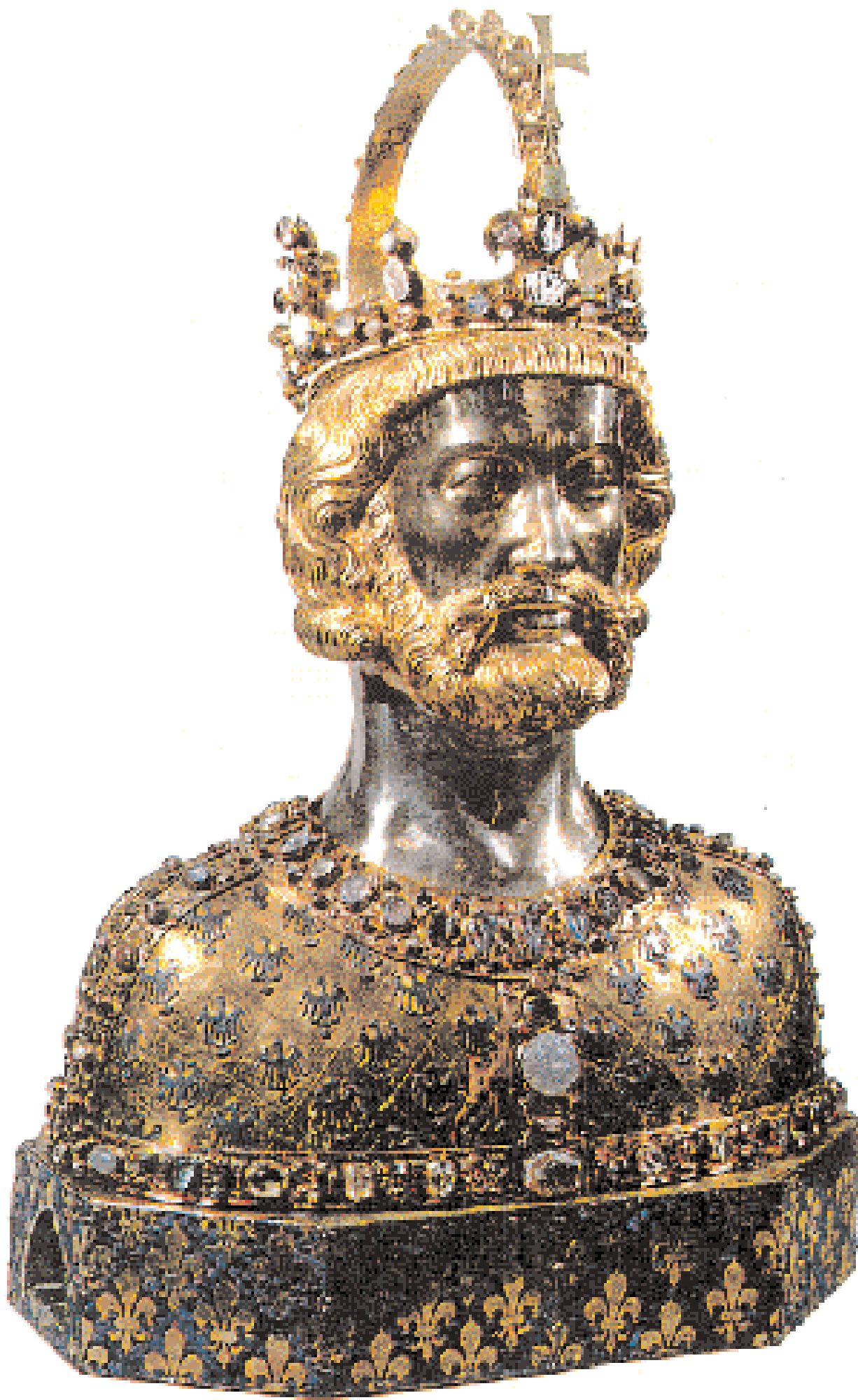
▲ «Λειψανοθήκη» (1348) από το Θησαυρό του καθεδρικού ναού του Ααχεν. Εγινε με παραγγελία του Γερμανού αυτοκράτορα Καρόλου Δ΄ για να περιλάβει το κρανίο του Καρλομάγνου. Αυτή την εποχή η αυτοκρατορία περιορίζεται στα γερμανικά της όρια και ο αυτοκράτορας θέλει να αποκλείσει τη Ρώμη από οποιαδήποτε ανάμειξη στη διαδικασία της στέψης.

ου επικράτησε. Με τον Καρλομάγνο, τέλος, παφές με την ελληνική ανατολή επιταχύνονται. Η τελευταία κερδίζει πολλά με τη μεταφορά του.