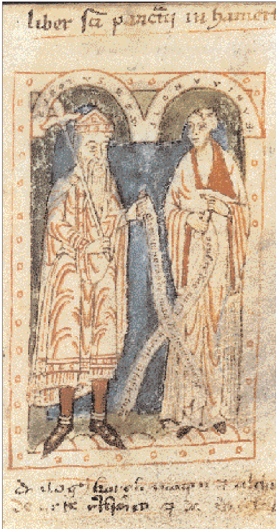
◀ Απεικόνιση του Καρλομάγνου και του Αλκούνιου, λόγιου Αγγλοσάξονα κληρικού, ο οποίος ανέλαβε τη διδασκαλία του αυτοκράτορα και της οικογενείας του. Αγωνίστηκε με πάθος εναντίον του Υιοθετισμού στις ονόδοις της Φρανκφούρτης (794) και Ααχεν (800). (Αννόβερο, Μοναστήριό Κέουινερ).

Μέσα σ' αυτό το ιδεολογικό κλίμα, η δεκαετία του 780 είχε αρχίσει με ευοίωνες προοπτικές για τις σχέσεις Καρλομάγνου-Βυζαντίου. Ο Φράγκος βασιλέας είχε συμφωνήσει το 781 στον αρραβώνα της κόρης του Ροτρούδης με τον νέο αυτοκράτορα Κωνσταντίνο ΣΤ΄. Όμως οι πολιτικές και στρατιωτικές κινήσεις του Βυζαντίου στην Κάτω Ιταλία σε συνδυασμό με τις βλέψεις του Καρλομάγνου προς τον ίδιο χώρο