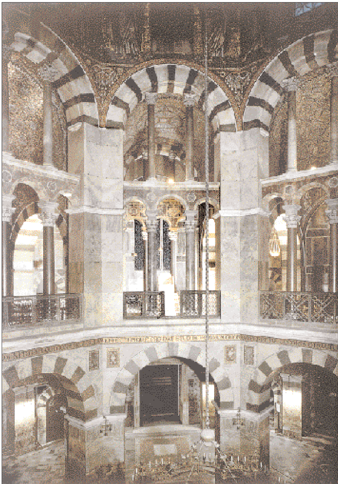
▲ Εσωτερικό του παρεκκλησιού του παλατιού στο Ααχεν. Πρόκειται για το σημαντικότερο θρησκευτικό κτίσμα της εποχής του Καρλομάγνου. Αντιγράφει σε πολλά μέρη τον εκκλησιολόγο Αγ. Βυαλίον στη Ραβέννα, κτίσμα της ιουστινιάνειας περιόδου.