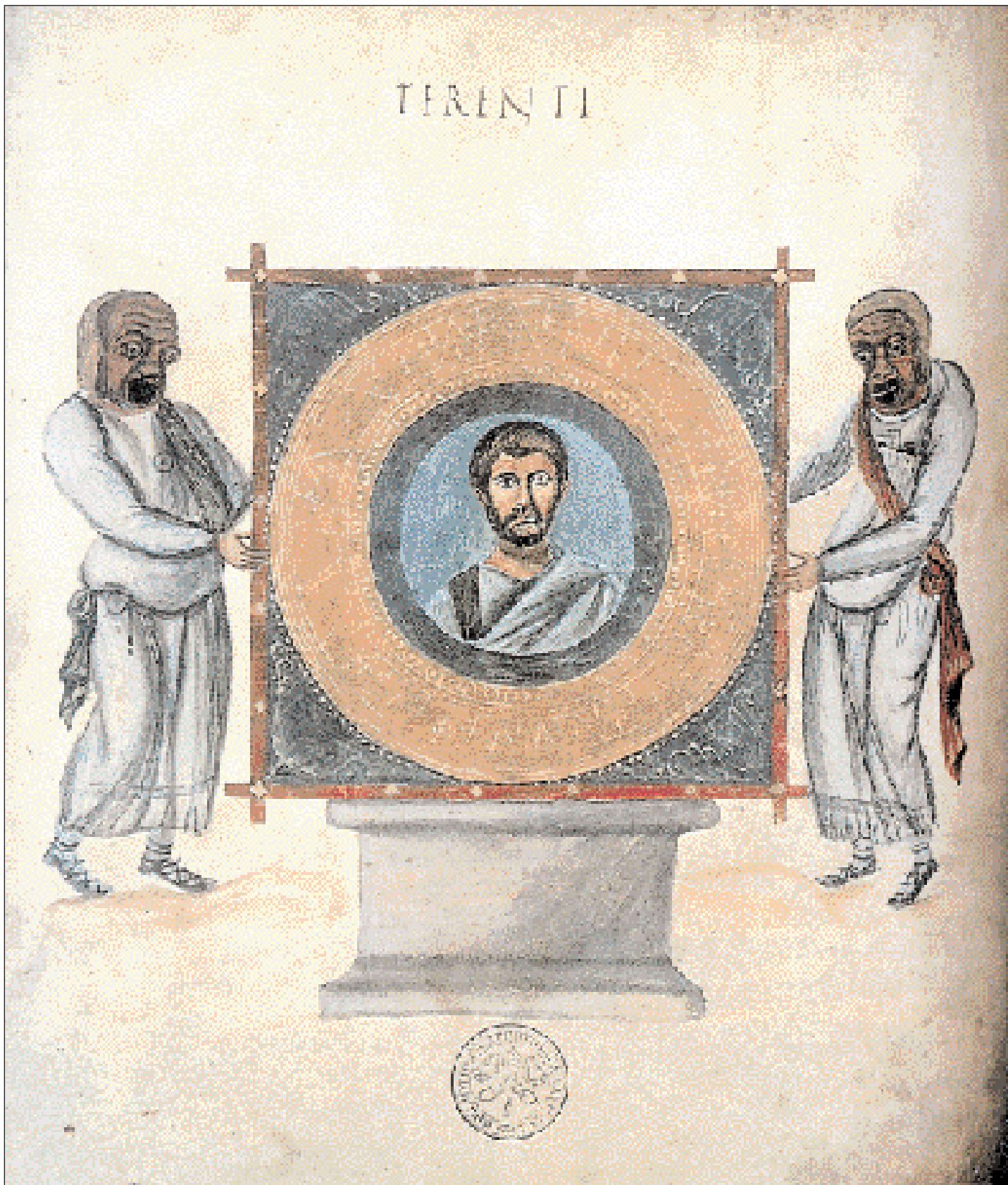
◀ Εικονογραφημένο χειρόγραφο από έργο του Λατίνου κωμωδιογράφου Τερεντίου. Το πορτρέτο του συγγραφέα απεικονίζεται μέσα σε μετάλλιο, το οποίο κρατούν δύο ηθοποιοί με μάσκες. Το χειρόγραφο χρονολογείται το 825 και αντιγράφει παλιότερο (Βαυκανό, Αποστολική Βιβλιοθήκη).

Ασφαλώς οι αρχιτέκτονες του Καρόλου θα είχαν μελετήσει διάφορα κτίρια στη Ρώμη, Ραβέννα, Μιλάνο, Τρεβήρους (Trier). Όμως ο ναός των ανακτόρων του βασίσθηκε στο περίφημο Χρυσοτρικλίνιο που είχε κτίσει ο αυτοκράτορας Ιουστίνος Β΄ (565-578), ως αίθουσα ακροάσεων και τελετών, στο Ιερόν Παλάτιον της Κωνσταντινουπόλεως. Η αίθουσα αυτή, γνωστή από τις πηγές, είχε μορφή οκταγώνου, ψηφιδωτή διακόσμηση και το θρόνο του Βυζαντινού αυτοκράτορα στην ανατολική αψίδα, στη θέση της Αγίας Τράπεζας. Στο παρεκκλήσι όμως του Aachen ο Κάρολος παρεχώρησε την ανατολική αψίδα στην Εκκλησία και