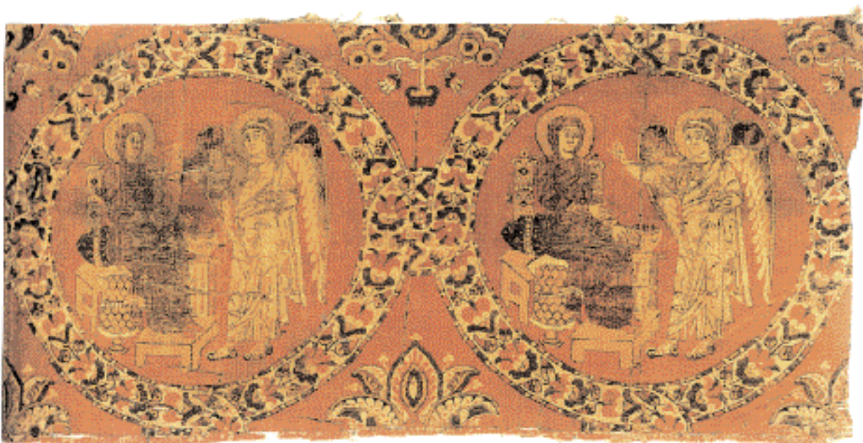
◀ Τμήμα μεταξωτού υφάσματος με παράσταση του Ευαγγελισμού της Θεοτόκου. Βυζάντιο (ή Συρία) 8ος ή αρχές 9ου αι. (Βατικανό, Αποστολική Βιβλιοθήκη).

Οι απόψεις του Καρλομάγνου όμως για την προσκύνηση των εικόνων δεν ήταν τόσο ριζικά εικονοκλαστικές. Σε γενικές γραμμές, οι Libri Carolini απέρριπταν τη «λατρεία» των εικόνων (το ίδιο και την προσκύνσή τους). Ανα-