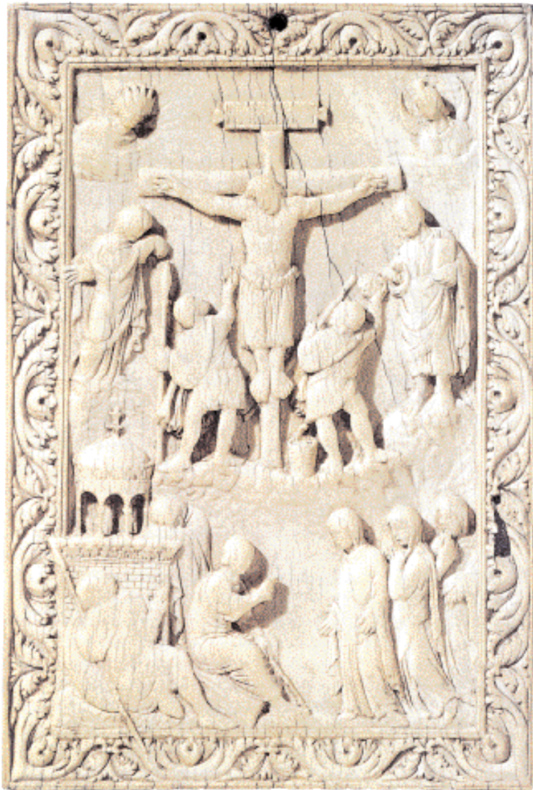
▲ Ελεφαντοστέινο κάλυμμα εαγγελίου με παράσταση της Σταύρωσης (νφ. περ. 16 εκ.). Βόρεια Γαλλία, 825-50.

◀ Ελεφαντοστέινο κάλυμμα βιβλίου με παράσταση Ιησού θριαμβευτή στο κέντρο, περιτοιγισμένη από σκηνές της Βίβλου, περ. 800 (Οξφόρδη, Βιβλιοθήκη Bodleian).