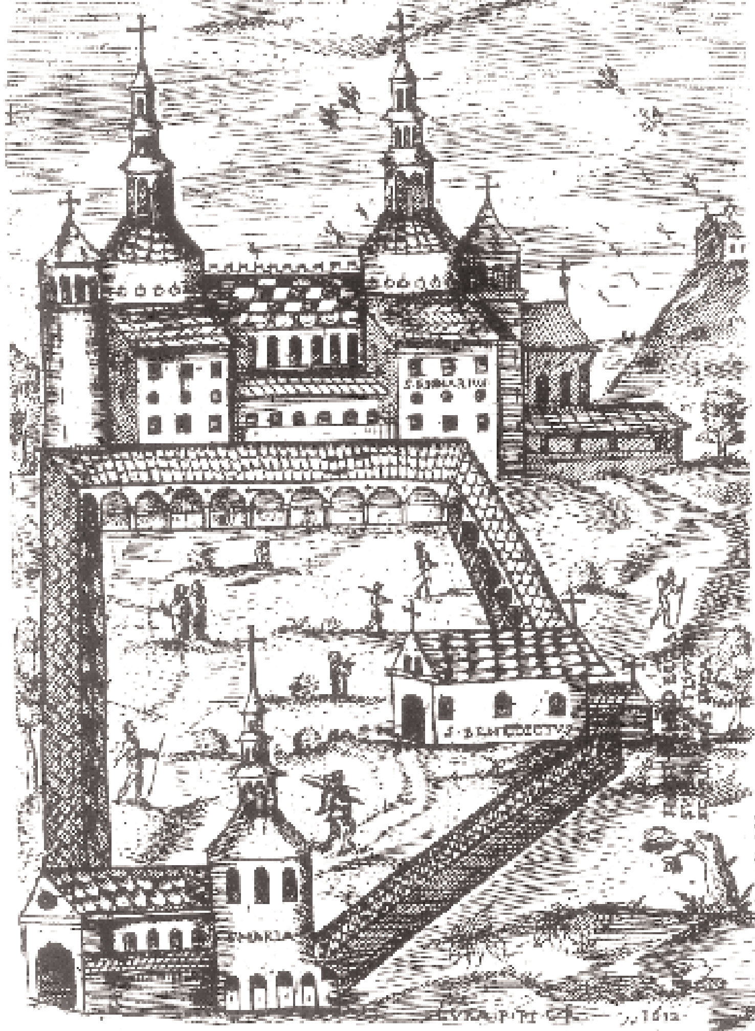
► Αββαείο στην Centula (στο έδαφος του σημερινού Βελγίου) στα τέλη του 8ου αι. Χαρακτικό του 1612.

ECCLESIAE AB ANGLIBERTO APOD CENTVLAM AN DCC XCIX CONSTRUCTARVM : E SCRIPTO CODICE EKMATÉION