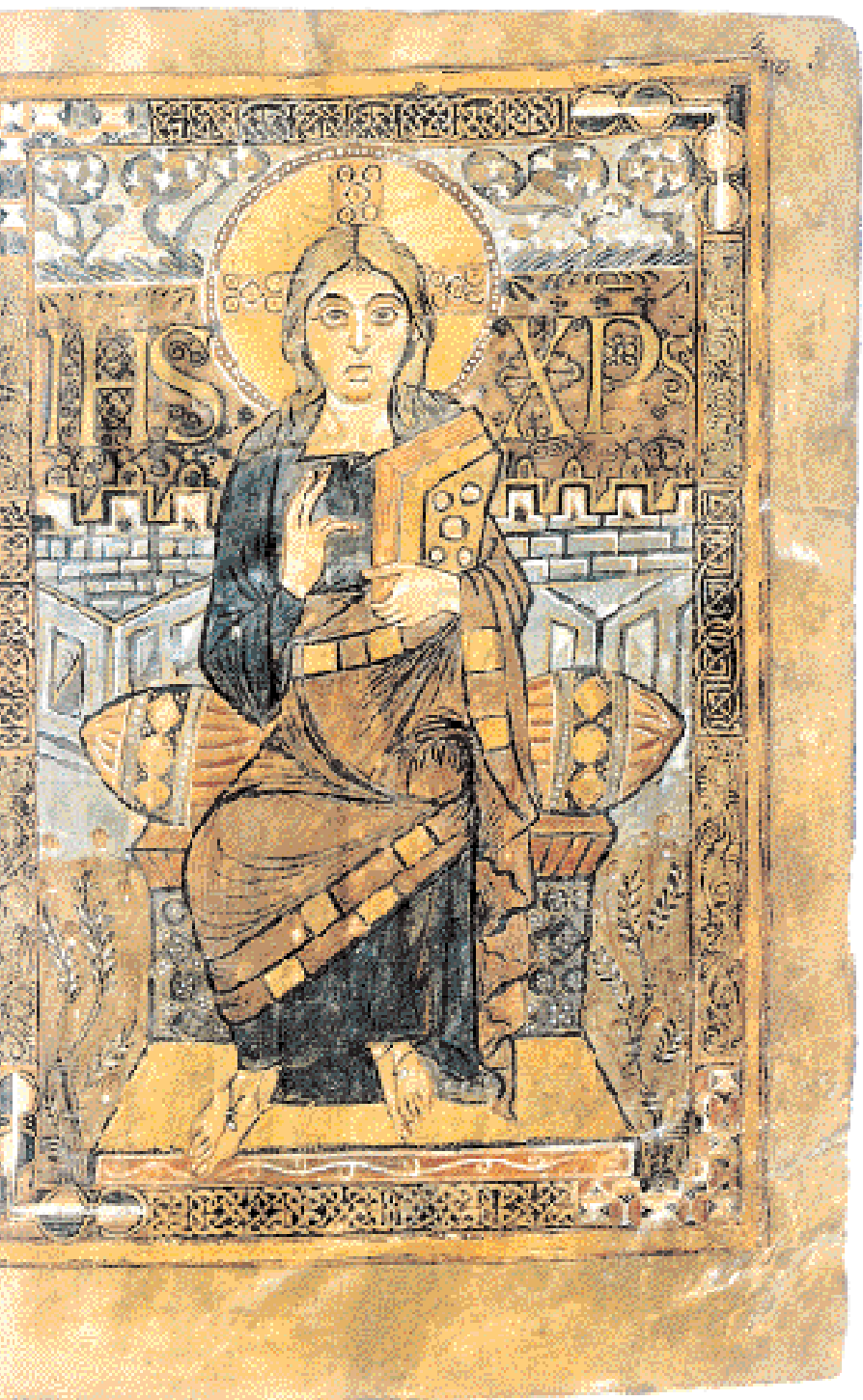
◀ Παρόσιαση έθρονου Χριστού από το εναγγελιστάριο που πήρε το όνομα του γραφέα του, Godescalc, παραγγελία του ίδιου του Καρλομάγνου και της γυναίκας του Hildegard, το 781 (Παρίσι, Εθνική Βιβλιοθήκη).