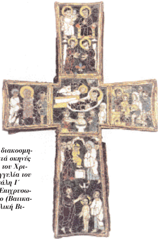
► Σταυρός διακοσμημένος με επτά σκηνές από τη ζωή του Χριστού, παραγγελία του πάπα Πασχάλη Γ' (817-24). Επιχρυσωμένο οβάλιο (Βατικανό, Αποστολική Βιβλιοθήκη).