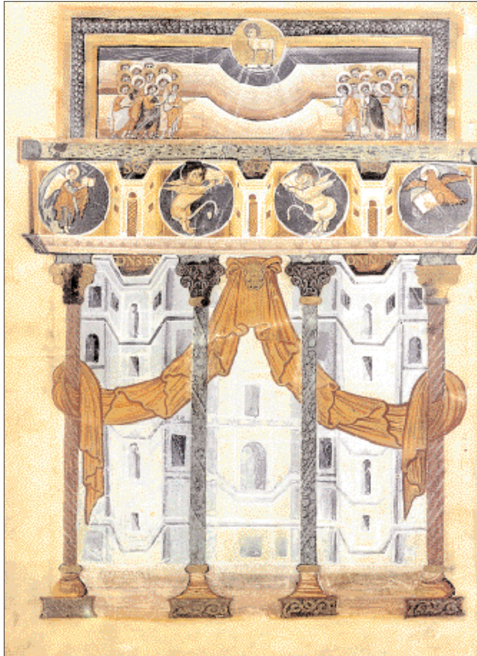
◀ Σελίδα από το εικονογραφημένο χειρόγραφο του Saint-Medard στο Soissons (Γαλλία), πρώιμος 9ος αι., με θέμα την Προσκύνηση του Αμνού. Με έργα σαν κι αυτά η εικονογράφηση των χειρογράφων στην καλλιτεχνική αυλή του Καρλομάγνου αγγίζει το ζενίθ της.

Στην Tours (Γαλλία), όπου έζησε τα τελευταία χρόνια της ζωής του ο Alcuin, φιλοτεχνήθηκαν πολυτελείς Βίβλοι όπως η Moutier-Grandval Βίβλος (Λονδίνο) και η Βίβλος του κόμητα Vivian, κοσμικού ηγούμενου της Tours (Παρίσι). Οι ολοσέλιδες μικρογραφίες τους από τη Γένεση μέχρι και την Αποκάλυψη αποτελούν αποσπάσματα μεγαλύτερων εικονογραφικών κύκλων. Πρότυπο των Βιβλίων αυτών, έχει αποδειχθεί, ήταν μία Βίβλος του 5ου αι.