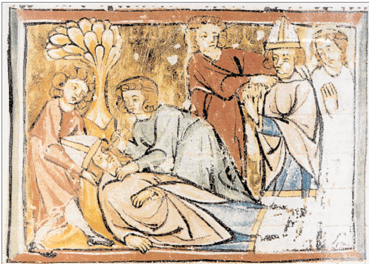
◀ Οι αντίπαλοι του Λέοντα Γ' επιχειρούν να τον τυφλώσουν (799). Ο Πάπας θα διαφύγει, θα αναζητήσει καταφύγιο στον Καρλομάγνο, τον οποίο ένα χρόνο αργότερα θα στέψει αυτοκράτορα στον Άγιο Πέτρο της Ρώμης. Μικρογραφίες από εικονογραφημένο χειρόγραφο του «Σαξονικού Παγκόσμιου Χρονικού», πριν από το 1290 (Βρέμη, Πανεπιστημιακή Βιβλιοθήκη).

Θάλασσα. Η σημαντικότερη όμως επιτυχία του υπήρξε η νικηφόρα απόκρουση στο Πουατιέ, το 732, μιας επικίνδυνης διείσδυσης των Μουσουλμάνων της Ισπανίας. Η νίκη αυτή εξασφάλισε στον Μαρτέλο το φωτισμένο του σωτήρα της Ευρώπης από το Ισλάμ. Να υπενθυμίσω ότι λίγα χρόνια πριν, το 718, ο Λέων Γ' ο Ισαυρός είχε απωθήσει επίσης τους Άραβες που πολιορκούσαν την Κωνσταντινούπολη. Οι εν λόγω δύο χρονολογίες θεωρούνται ως σημαντικές τομές στη ροή του ιστορικού γίγνεσθαι, για την αποτροπή του ισλαμικού κινδύνου, τόσο στη δυτική όσο και στην ανατολική Ευρώπη.