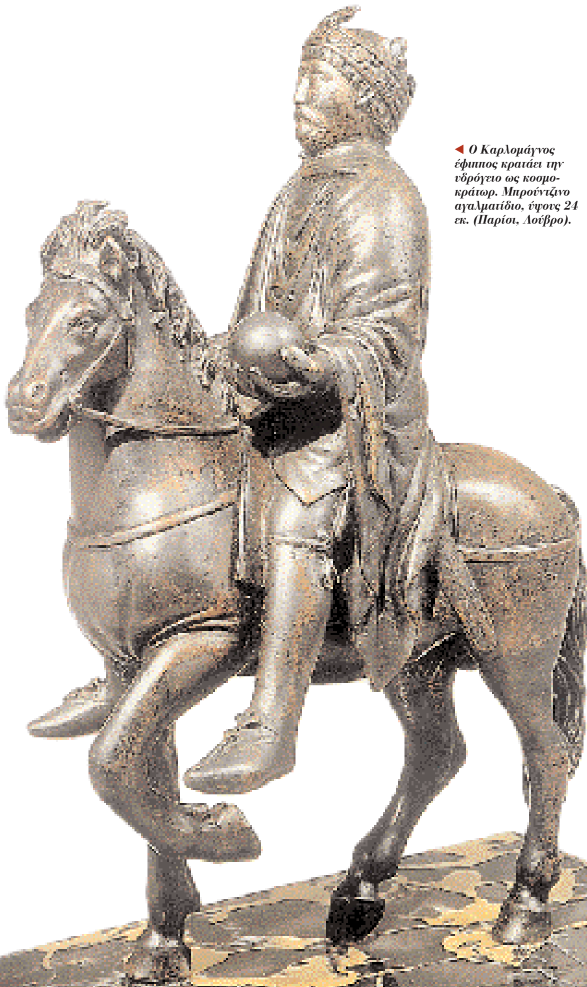
◀ Ο Καρλομάγνος έφιππος κρατάει την υδρόγειο ως κοσμοκράτορα. Μπρούντζινο αγαλματίδιο, ύψους 24 εκ. (Παρίσι, Λούβρο).

Η πρωτεύουσά του θα γινόταν η Roma secunda. Το Παλάτι του θα το ονομάσει Λατερανό, διότι, σύμφωνα με την παράδοση, το Λατερανό στη Ρώμη ήταν το παλάτι του Μ. Κωνσταντίνου που το δώρισε στην Εκκλησία. Στο Παλάτι του θα στεγάσει, μεταξύ άλλων, και ένα άγαλμα έφιππου αυτοκράτορα, πιθανώς του Ζήνωνα (470-491), που το είχε μεταφέρει από τη Ραβέννα, ως αντίστοιχου του ανδριάντα του Μ. Κωνσταντίνου (δηλ. του Μάρκου Αυρηλίου), που τότε βρισκόταν στο Λατερανό.