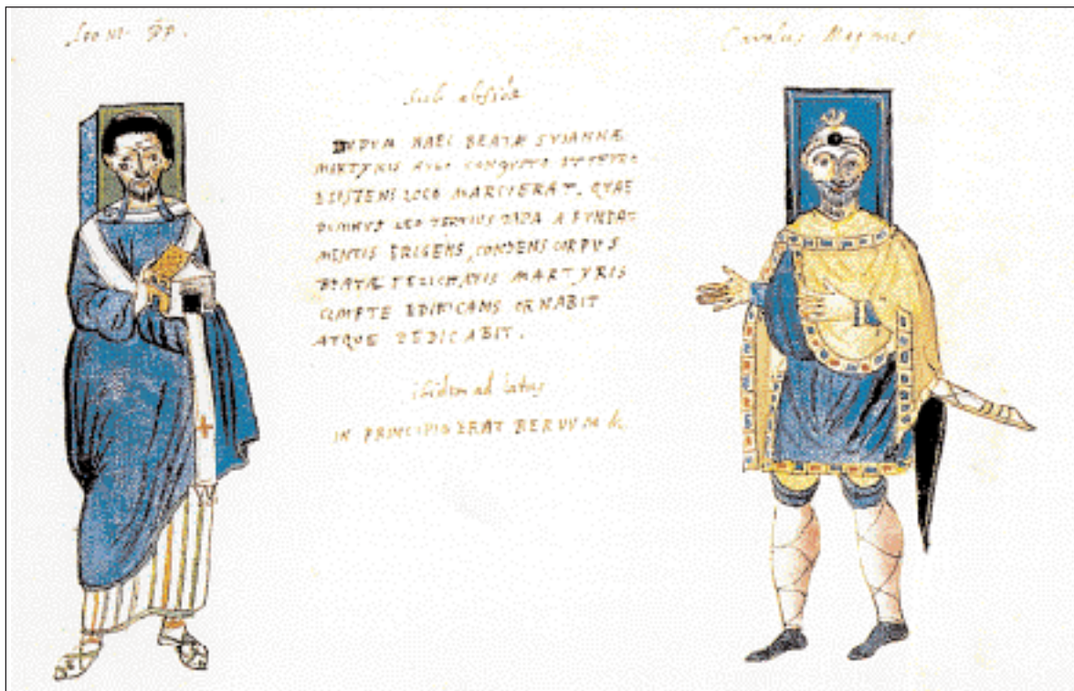
◀ Ο Πάπας Λέων Γ' και ο Καρλομάγνος, Ακουαρέλα τον 17ο αι. (Βαϊκανό, Αποστολική Βιβλιοθήκη).