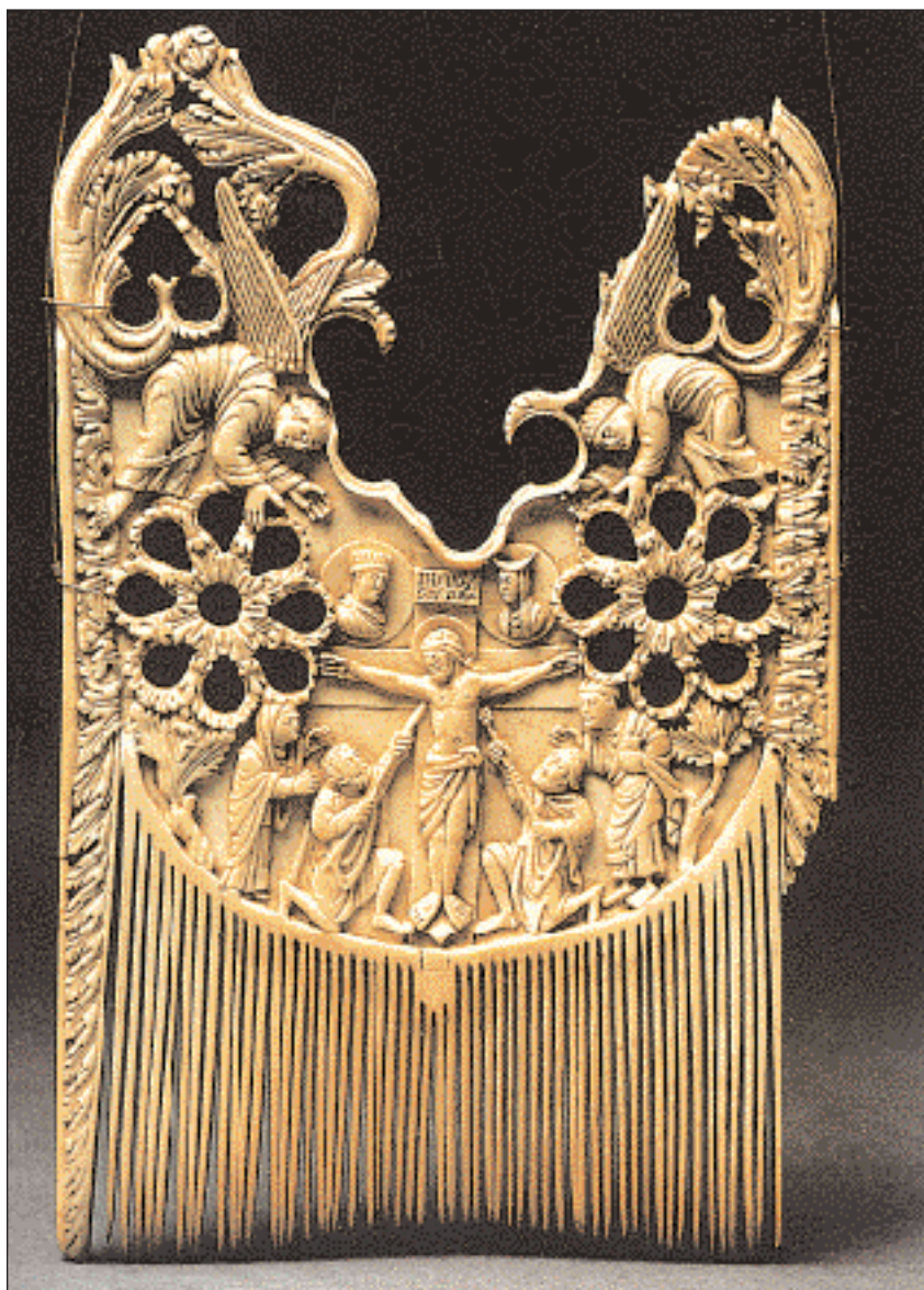
◀ Χτένα από ελεφαντόδοντο με παράσταση Σταύρωσης. Εξαιρετικό δείγμα μικροτεχνίας των χρόνων του Καρλομάγνου (Κολωνία, Μουσείο Schnuetgen).

Στα 781, για πρώτη φορά συστήνεται το Regnum Italicum πάνω στα προαναφερθέντα εδάφη, με βασιλιά τον Πιπίνο, έναν από τους (νόμιμους) γιους του Καρλομάγνου.