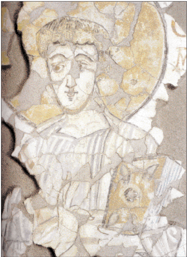
▲ Νωπογραφία με απεικόνιση νεαρού αγίου από το μοναστήρι του Αγίου Βικεντίου κοντά στον ποταμό Βολτούρνο βόρεια της Νάπολης, περ. 800. Η παράσταση κομμοίσε αίθονσα υποδοχής επίσημων επισκεπτών του μοναστηριού.

γνώριζαν όμως σε αυτές το ρόλο ενός «εκπαιδευτικού» και ίσως «πθικοπλαστικού» μέσου, άποψη την οποία είχε πρώτος εκφράσει περίπου τριακόσια χρόνια πριν ο Πάπας Γρηγόριος ο Μέγας. Η «ήπια» οικονομία που υποστήριζαν οι Libri Carolini προσιωνίζονταν τη μορφή που αρχικά πήρε η δεύτερη φάση της Βυζαντινής Εικονομαχίας. Όσον αφορά τη Δύση, οι Libri Carolini δικαιώθηκαν προς στιγμήν στην παρισινή Σύνοδο του 824/5, αλλά δεν φαίνεται να διέδωσαν εικονοκλαστικές ιδέες ανάμεσα στους χριστιανούς της Δύσης.