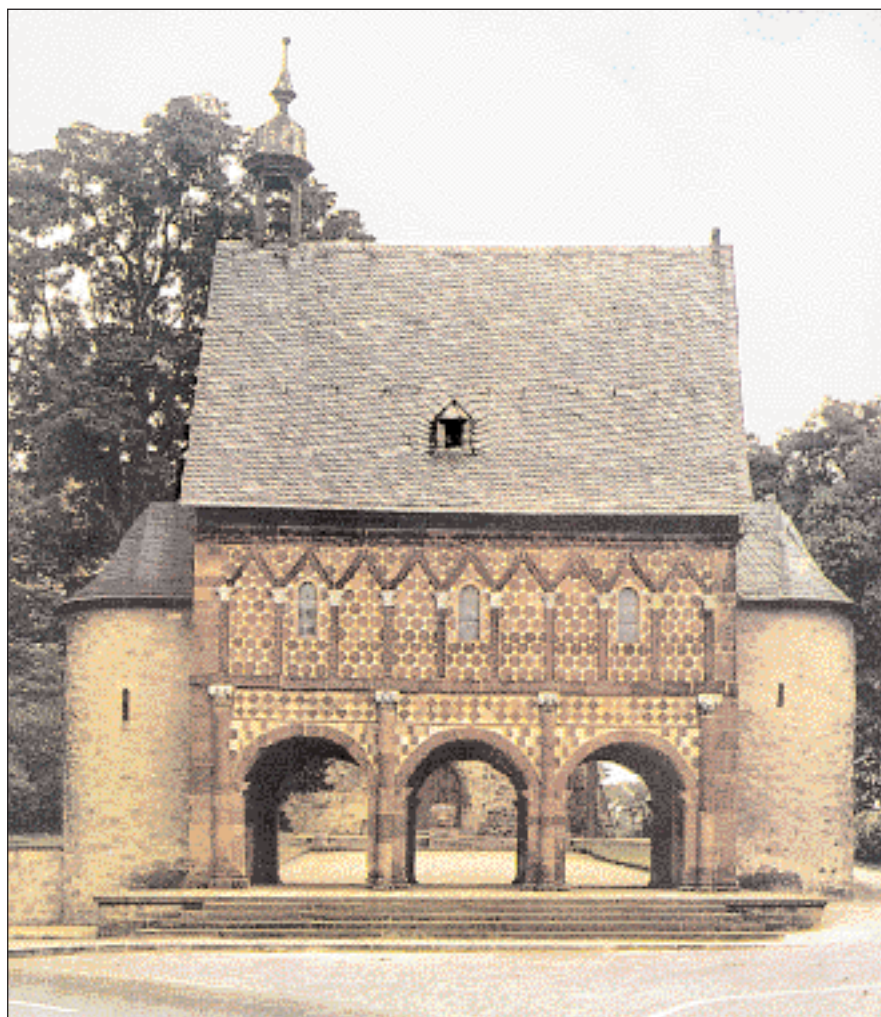
► Η πύλη του μοναστηριού του Lorsch (στο έδαφος της σημερινής Γερμανίας). Το μοναστήρι, κτίσμα των 8ου αι., επωφελήθηκε ιδιαίτερα από τις δωρεές του Καρλομάγνου. Εκεί εικονογραφήθηκε το ομώνυμο εναγγελιστάριο, σημαντικό και χαρακτηριστικό δείγμα της καρολίγγειας αναγέννησης στα γράμματα και τις τέχνες.

Οι Βυζαντινοί έμαθαν πολλά από τη μακρά προστριβή τους με τους Φράγκους. Ο βιογράφος του Καρόλου Εγινάρδος γράφει ότι οι Βυζαντινοί είχαν συντάξει ένα γνωμικό, με το οποίο εξέφραζαν τα αισθήματά τους προς τους κατακτητές της Ευρώπης, το οποίο και παραθέτει στα ελληνικά μέσα στο λατινικό του κείμενο: TON ΦΡΑΝΚΟΝ Φ΄ΙΛΟΝ ΄ΕΧΙΣ, Γ΄ΙΤΟΝΑ ΟΥΚ ΄ΕΧΕΙΣ. Δηλαδή, τον Φράγκο μπορείς να τον έχεις φίλο, αλλά καλύτερα να μην τον έχεις γείτονα! ❗