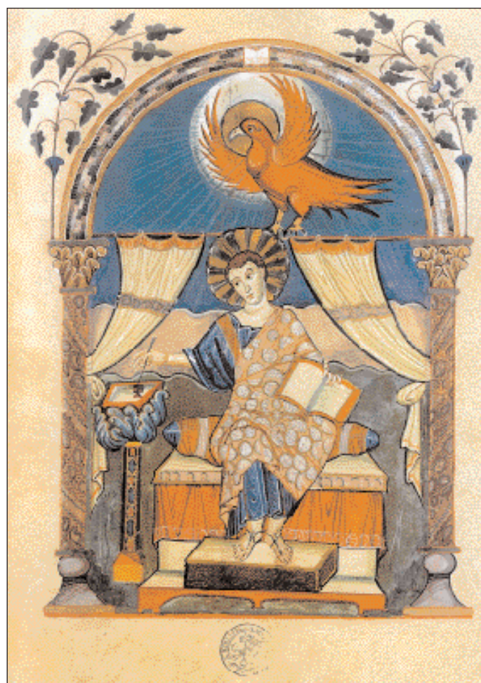
▼ Ο Εναγγελιστής Ιωάννης. Σελίδα του περίφημου εναγγελισταρίου Lorsch, 810, από το ομώνυμο μοναστήρι (Βατικανό, Αποστολική Βιβλιοθήκη).

Αλλά εκκλησιαστικά κτίρια θα μιμηθούν τον αυτοκρατορικό ναό, όπως ο μικρός «ευκτήριος οίκος» στο Germigny-des Pres που ανήκε στη βίλα του Θεοδούλφου, επισκόπου Ορλεάνης που οι σύγχρονοί του ονόμαζαν «Πίνδαρο». Όμως οι Άγγελοι που προσκυνούν την Κιβωτό της Διαθήκης (το θέμα προέρχεται από Ιουδαϊκές Βίβλους), στην ψηφιδωτή διακόσμηση της ανατολικής αψίδας, έχουν διατηρήσει στα πρόσωπά τους την απαλότητα της βυζαντινής αύρας την οποία οι καλλιτέχνες θα την είχαν βιώσει σε μνημεία της Ρώμης.