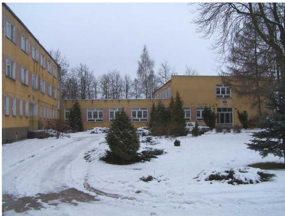
Rys. Nr 6. Nowy budynek szkoły wraz z internatem

W 1974 roku powołano 3 letnie Technikum Rolnicze dla absolwentów zasadniczych szkół rolniczych i szkół przysposobienia rolniczego.