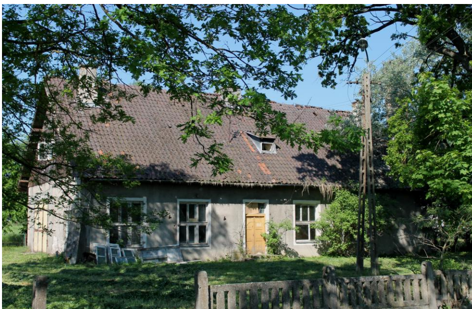
Rys. Nr 4. Stary budynek szkoły

Trudna sytuacja lokalowa szkoły i internatu (rys. 5) oraz wzrost liczby oddziałów sprawiły, iż w 1966 roku rozpoczęto budowę nowego obiektu szkolnego wraz z internatem na 120 miejsc.