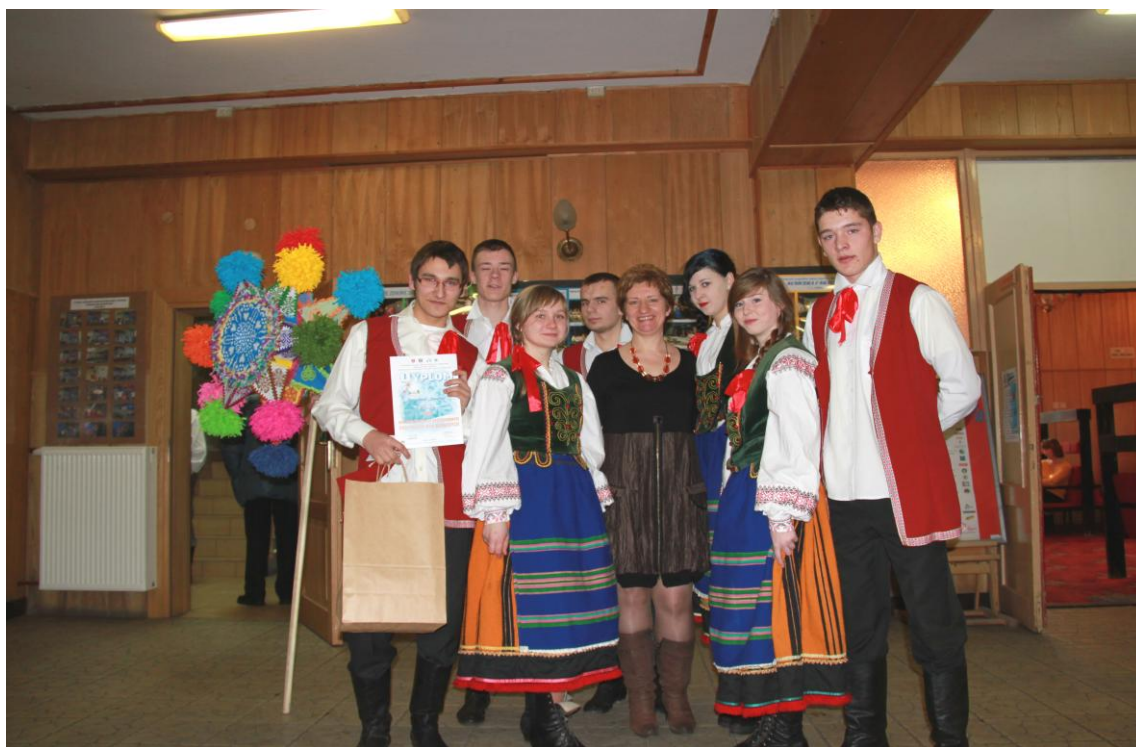
Rys. Nr 12. Hajnówka 3 luty 2013 r.

Istotnym sukcesem szkoły w sferze kultury są osiągnięcia indywidualne uczniów: