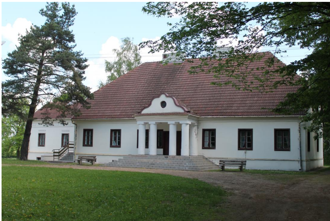
Rys. Nr 3. Dworek szlachecki z 1 poł. XIX w. (widok dzisiejszy z tyłu)