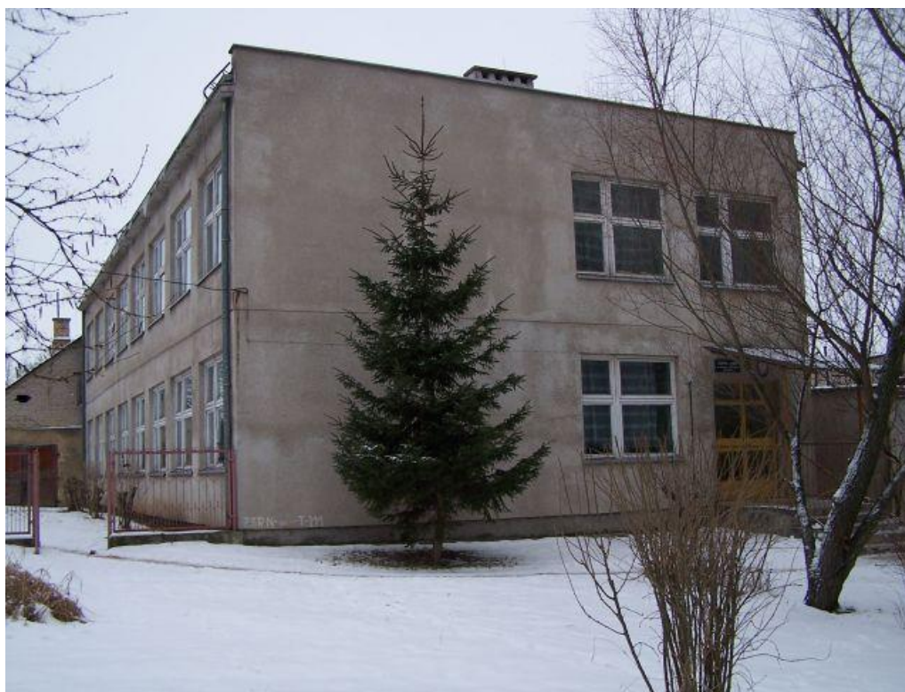
Rys. Nr 7. Budynek szkoły nr 2

W 1982 roku rozpoczęto budowę kompleksu warsztatów szkolnych wraz z budynkiem pracowni teoretycznych, którą zakończono 2 lata później (rys. 7).