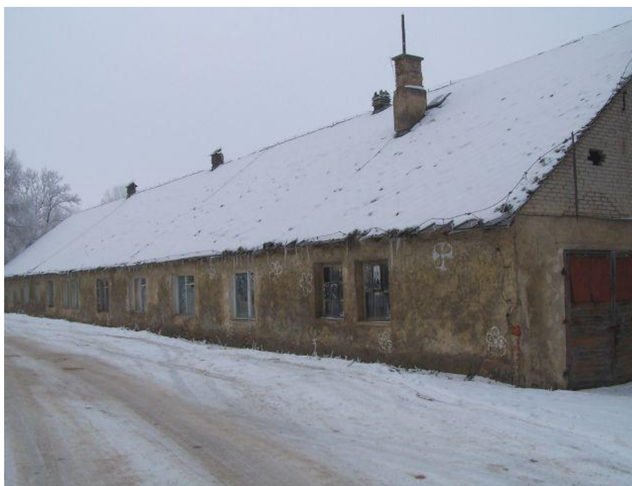
Rys. Nr 5. Budynek starego internatu

Trudna sytuacja lokalowa szkoły i internatu (rys. 5) oraz wzrost liczby oddziałów sprawiły, iż w 1966 roku rozpoczęto budowę nowego obiektu szkolnego wraz z internatem na 120 miejsc.