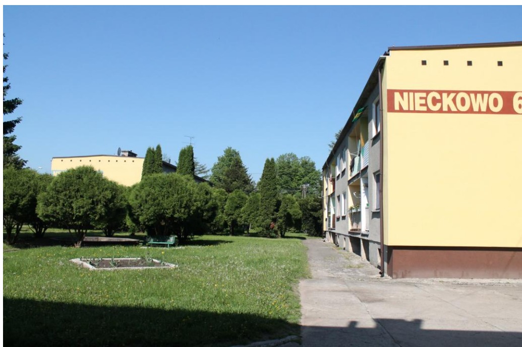
Rys. Nr 8. Osiedle mieszkaniowe

W dniu 29 czerwca 1985 roku szkoła przeżywała wielkie święto. Wtedy właśnie Zespół Szkół Rolniczych otrzymał imię Bolesława Podedwornego (znanego działacza ludowego, syna ziemi łomżyńskiej).