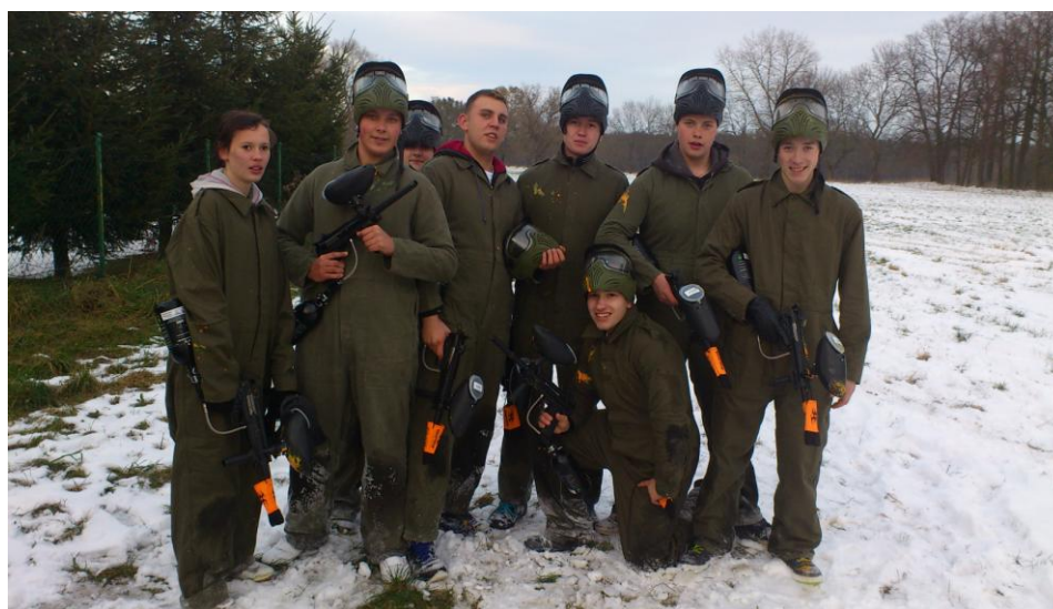
Rys. Nr 21. Drużyna Paintballa

W 2005 roku nasza szkoła nawiązała współpracę z zaprzyjaźnioną szkołą ukraińską z Równego. Niemal każdego roku odbywa się kilkudniowa wymiana