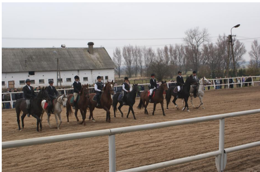
Rys. Nr 10. Obchody Święta Hubertus - Nieckowo 2010 (padok, w tle widok stajni)

Od początku roku szkolnego 2009/2010 szkoła uruchomiła w Technikum na kierunkach dziennych kształcenie w zawodzie – technik hodowca koni. W związku z tym zaadoptowano część starej obory na pomieszczenia dla koni, a obok dworku wybudowano padok (rys. 10).