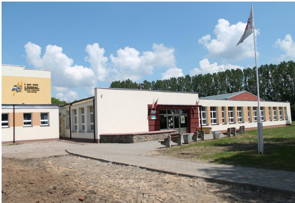
Rys. Nr 15. Wejście do budynku szkoły nr 2