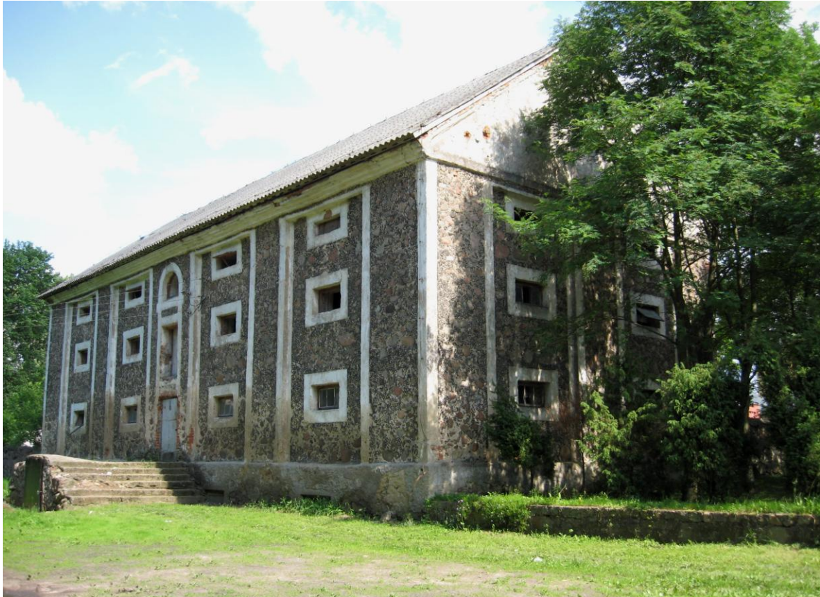
Rys. Nr 1. Spichlerz zbożowy z trzeciej ćwierci XIX w.

Oprócz tego dokonali oni również przebudowy dworu. Gontowy dach zastąpiono czerwoną dachówką, do północno – zachodniego szczytu dobudowano przybudówkę, nad głównym wejściem pojawił się murowany portyk kolumnowy (zwieńczony trójkątnym przyczółkiem o falistych konturach), po stronie przeciwnej portyku pojawił się taras (rys. 2,3).