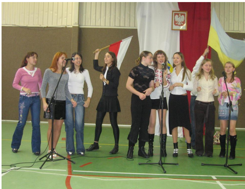
Rys. Nr 22. Występ pożegnalny gości z Ukrainy

Nasza szkoła to instytucja podejmująca problemy i wyzwania, jakie wynikają z dzisiejszych realiów gospodarki wolnorynkowej. Potwierdzeniem tego są chociażby organizowane corocznie od kilku już lat konferencje pod nazwą Agro - Podlasie (rys. 23), na które zapraszani są przedstawiciele władz centralnych, wojewódzkich, samorządowych oraz osoby reprezentujące różne branże i instytucje. Ich adresatem są głównie tutejsi rolnicy i przedsiębiorcy, którzy u samego „źródła” mogą dowiedzieć się o ważnych dla nich sprawach.