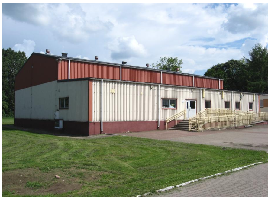
Rys. Nr 9. Sala gimnastyczna