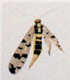
Skorpionfliege aus Rauental. Beide Flügel auf der rechten Seite sind deformiert. Das Abdomen ist mit verschobenen Segmenten aufgeblasen. Scorpionfly from Rauental. Both wings on the right side are deformed and the abdomen looks blown up and deformed.