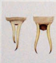
Cerci von zwei Ohrwürmern aus Gösgen, der Linke des linken Ohrwürms ist deformiert. Cerci of two earwigs from Gösgen, the left cerci of the left earwig is deformed.