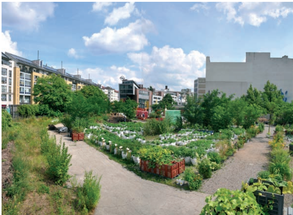
Temporäre Gärten: Prinzessinnengarten von Nomadisch Grün

Ton Matton (NL) fasst den öffentlichen Raum als Produktionsraum auf und versteht ihn als Plattform zur ästhetischen Vermittlung von Krisen der Gesellschaft. Surviving the Suburb handelt von der Transformation der westlich geprägten Vorstellung von Stadt hin zu Metropolen globalen Charakters. Durch Aneignung neuer Produktionsräume entstehen informelle Ökonomien und eine Überlebenschance für die sogenannten Verlierer der Globalisierung. 34