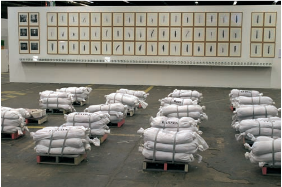
Dan Peterman, Installationsansicht civil defense II als Ausstellungsmöblierung: Matrosenhosen, Reis, Linsen, Paletten aus recyceltem Plastik, Foto: Installationsansicht ZNE!

Hier ist Kunst nicht nur Gestalterin von Nachhaltigkeit, hier wird auch eine klassische Win-Win-Situation erzeugt. Allgemeiner ausgedrückt entsteht aus Kunst Nutzen und aus dem Nutzen wiederum Kunst.