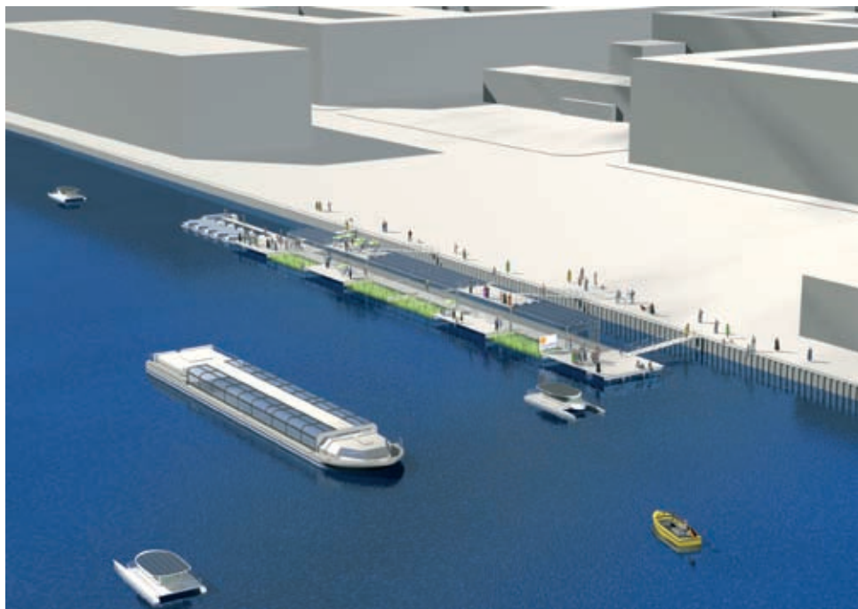
LURI.watersystems GmbH Spree 2011, (3 D Visualisierung: Sven Flechsenhar @LURI)

Spree 2011: Sieben Prozent der Stadtfläche Berlins besteht aus Wasser, jedoch gibt es keine Badestellen in der Innenstadt, das Freizeitvergnügen endet zumeist am Ufer. Das Projekt Spree 2011 hat sich zum Ziel gesetzt, die Spree wieder zum Badefluss zu machen und setzt eine neue, weltweit einmalige und übertragbare Technologie gegen den größten Verschmutzer der Spree ein: Ungeklärtes Mischwasser, das bislang nach starken Regenfällen in die Spree geleitet wurde, wird vorher in mehreren im Wasser liegenden Speichern aufgefangen, die unter öffentlich nutzbaren Pontons liegen. Die Entwicklung eines Prototyps wurde jahrelang durch Zuständigkeitswirrwarr verzögert, was angesichts der Fülle von Vorteilen schwer nachvollziehbar ist, als da sind: Schaffung von Arbeitsplätzen und exportfähiger Technologie, Reduzierung des Verkehrs durch Schaffung von Stadterholungsgebieten, Wiederaneignung des Flusses und Erhöhung der Lebensqualität. Der Prototyp wird jetzt im Frühjahr 2012 in Berlin fertiggestellt.