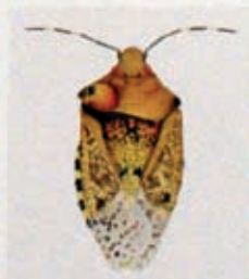
Gartenwanze aus Küssaberg Deutschland. Die Blase mit dem schwarzen Auswuchs verändert die Form des Halschilts. Garden bug from Küssaberg, Germany. The cyst with the black outgrowth changes the shape of the pronotum.

Cornelia Hesse-Honegger, Heteroptera – Bilder einer mutierten Welt, Präsentationsansicht, Foto: Installationsansicht ZNE!