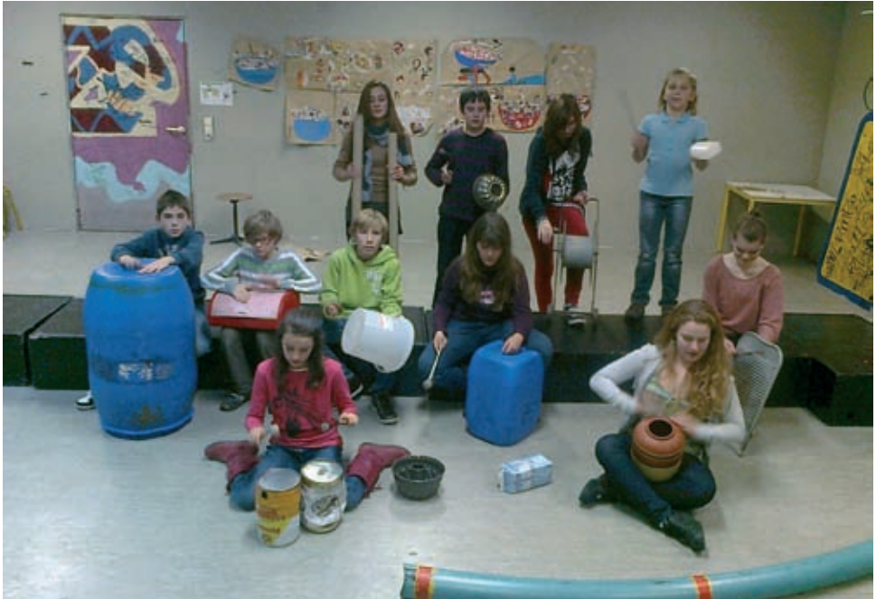
Recycling Orchestra, Foto: Holly Holleber, Initiator und Orchesterleitung