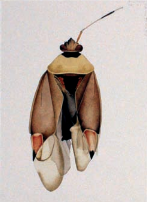
Die Flügel dieser Weichwanze aus Rohr sind ungleich lang. The wings of this soft bug from Rohr are asymmetrical.

In 1988, the artist collected true bugs and other insects around the Swiss nuclear power plants Gösgen and Leibstadt in the canton of Aargau. She did not at that time collect the same number of insects at the different research points. Nonetheless, she was horrified by the heavy deformation she found and decided to go on with this research.