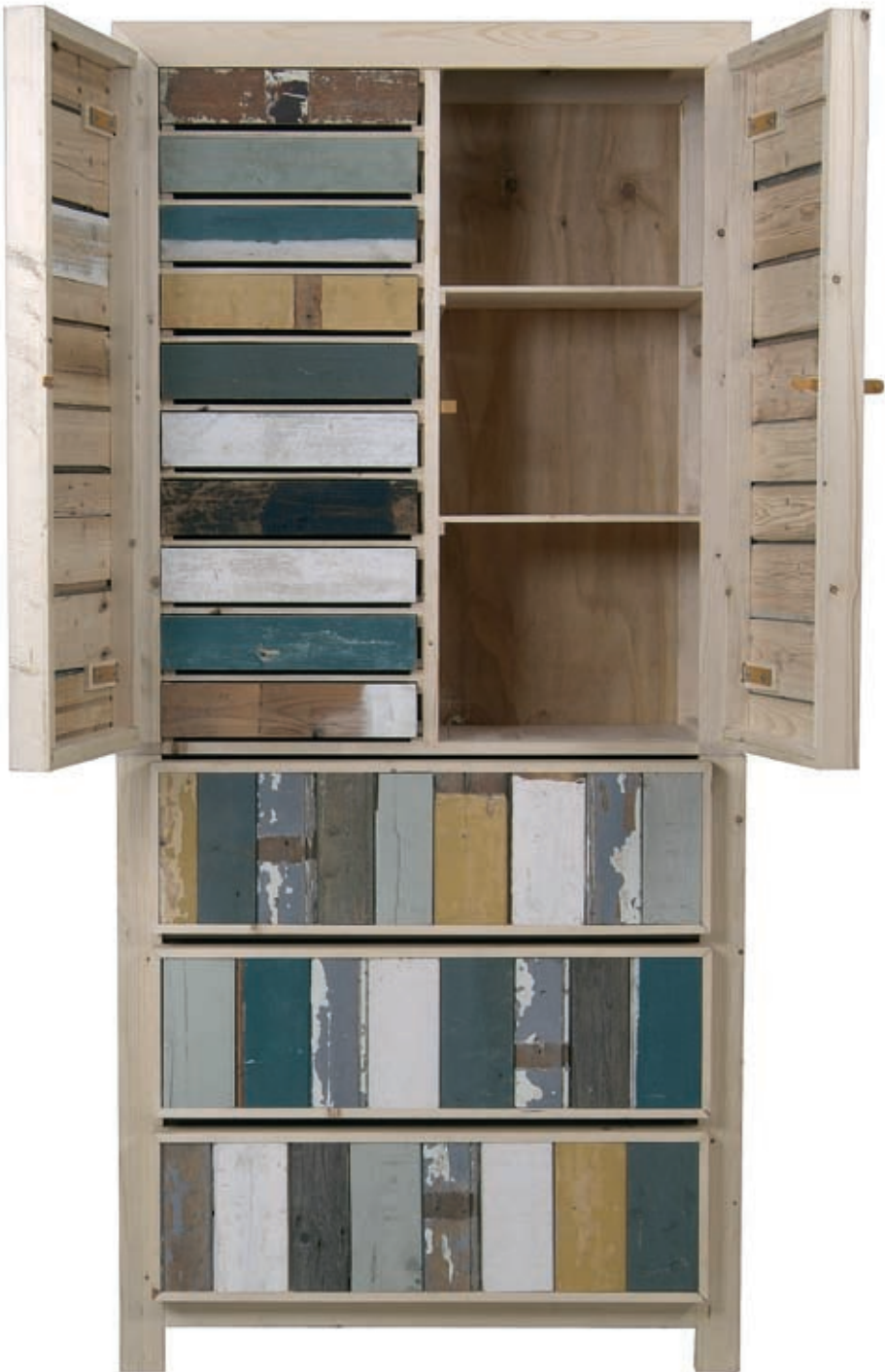
Piet Hein Eek, Designmöbel aus Abfallholz 28