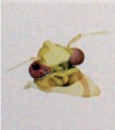
Kopf einer Weichwanze aus Schönenwerd. Aus dem Auge wächst eine Zyste und die Facetten sind unregelmässig und zum Teil zu groß. Head of a soft bug from Schönenwerd. A growth out of the left eye and disturbance of the facets are visible.