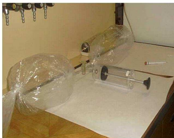
Fot. 3 Statyczne rozcieńczenie próbki wonnego gazu z użyciem worków z folii żaroodpornej i strzykawki gazowej do pobierania próbek (1500 cm 3 )

Próbki dostarczone do laboratorium są rozcieńczane z użyciem olfaktometrów. Wykaz zamieszczonych w normie podstawowych haseł pozwala przypuszczać, że dopuszczalne jest stosowanie zarówno olfaktometrów dynamicznych, jak statycznych. Zamieszczono analogiczne definicje pojęć: „ dynamic olfactometer ” i „ static olfactometer ”, nie zostało jednak wyjaśnione, w jakich warunkach dopuszczalne jest stosowanie olfaktometrii statycznej, preferowanej przez zespół Politechniki Szczecińskiej.