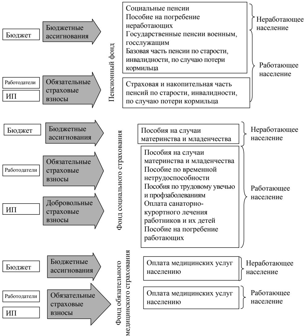
Рис. 1. Взаимосвязь источников формирования и направлений расходования средств внебюджетных фондов по видам страхования

Налог же представляет собой безвозмездный обязательный индивидуальный платеж, уплачиваемый в целях финансового обеспечения деятельности государства. Единый социальный налог (ЕСН) в 2001 г. заменил собой различные страховые взносы работодателей. ЕСН, сохранив свое целевое назначение, тем самым привнес в налоги возможность индивидуальной возмездности, нарушив классическое восприятие налога как индивидуально безвозмездного платежа. Кроме того, зачисление большей части ЕСН в федеральный бюджет еще более нарушало страховую природу выплат, подчеркивало распреде-