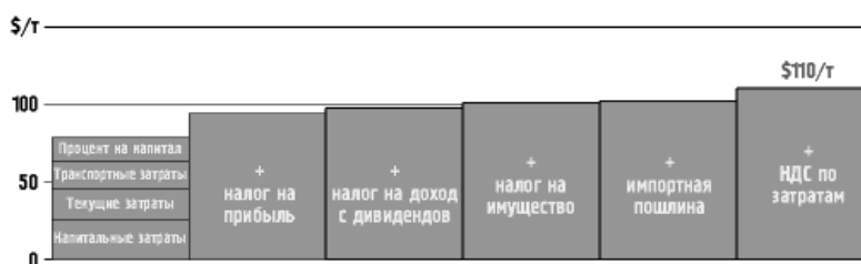
Рис. 2. Динамика увеличения налогового бремени

Качество сложившегося сегодня в нефтяной отрасли России инвестиционного климата наглядно иллюстрируется опытом компании Сопосо в этой стране: вот уже более трех лет сама компания пытается сдвинуть с места процесс переговоров по СРП для реализации проекта «Северные территории», который разрабатывается совместно с российскими партнерами — «Архангельскгеологодобычей» и «ЛУКОЙЛом». К сожалению, как для нас, так и для России, этот процесс продвигается гораздо медленнее, чем мы надеялись. Непосредственная причина такого положения состоит в отсутствии законодательно-нормативной базы для СРП. Базовой же причиной, как я полагаю, является распространенное мнение, что режим СРП не нужен, так как общая система налогообложения и нормативного регулирования обеспечивает достаточно выгодные условия для привлечения инвестиций. Однако это не так: налоги, наоборот, увеличивают издержки производства. Аргументы, доказывающие, что такая точка зрения ошибочна, иллюстрируется данными показателями (рис. 2).