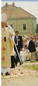
es Paul II. Gurk