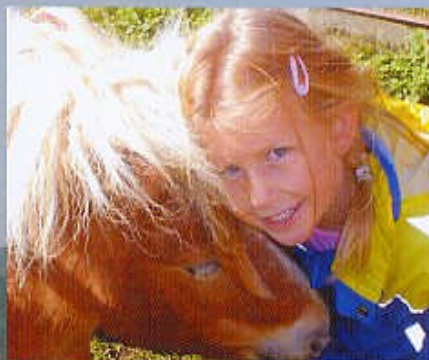
Urlaub am Bauernhof