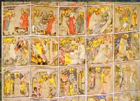
Ausschnitt aus dem auf Leinen gemalten spätgotischen Gurker Fastentuch (1458), das älteste und größte Österreichs.