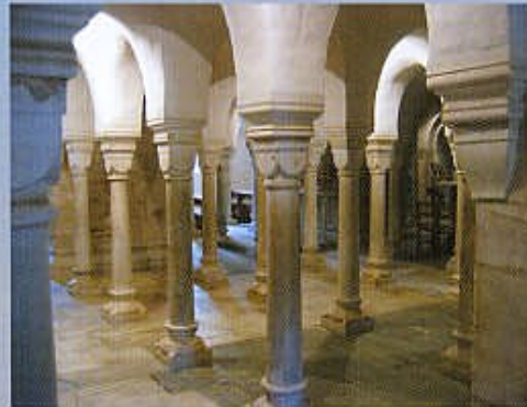
Die 100-säulige Krypta mit dem Grab der Hl. Hemma