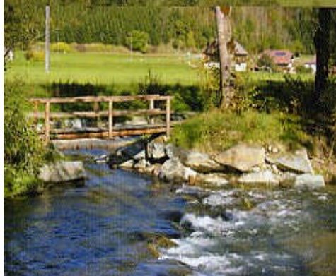
Wassererlebniswelt an der Gurk