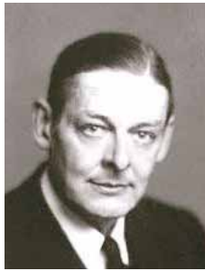
ഷെല്ലി, കീറ്റ്സ്, ടി.എസ്. എലിയറ്റ്

അതൊരു ക്ലാസിക് കാലഘട്ടത്തെ ഓർമ്മിപ്പിക്കുന്നു. കാളിദാസൻ കമ്മ്യൂണിസ്റ്റായിരുന്നില്ല. ഏതെങ്കിലും തരത്തിലുള്ള സോഷ്യലിസ്റ്റ് മൂല്യങ്ങളിൽ കാളിദാസൻ വിശ്വസിച്ചിരുന്നോ എന്നുമറിയില്ല. ഉജ്ജയിനി എഴുതിയ ഒ.എൻ.വിയേക്കാൾ എനിക്കിഷ്ടം കോതമ്പുമണികളെഴുതിയ ഒ.എൻ.വിയെയാണ്.