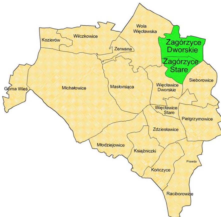
Miejscowość Zagórzycze Stare i Zagórzycze Dworskie na tle Gminy Michałowice