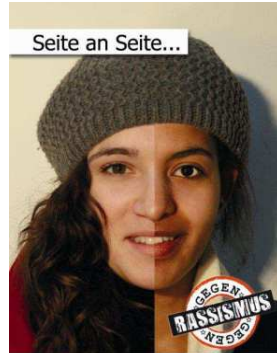
© Annemarie Nielsen und Viktoria Stößberg (im Rahmen der Internationalen Woche gegen Rassismus 2012)