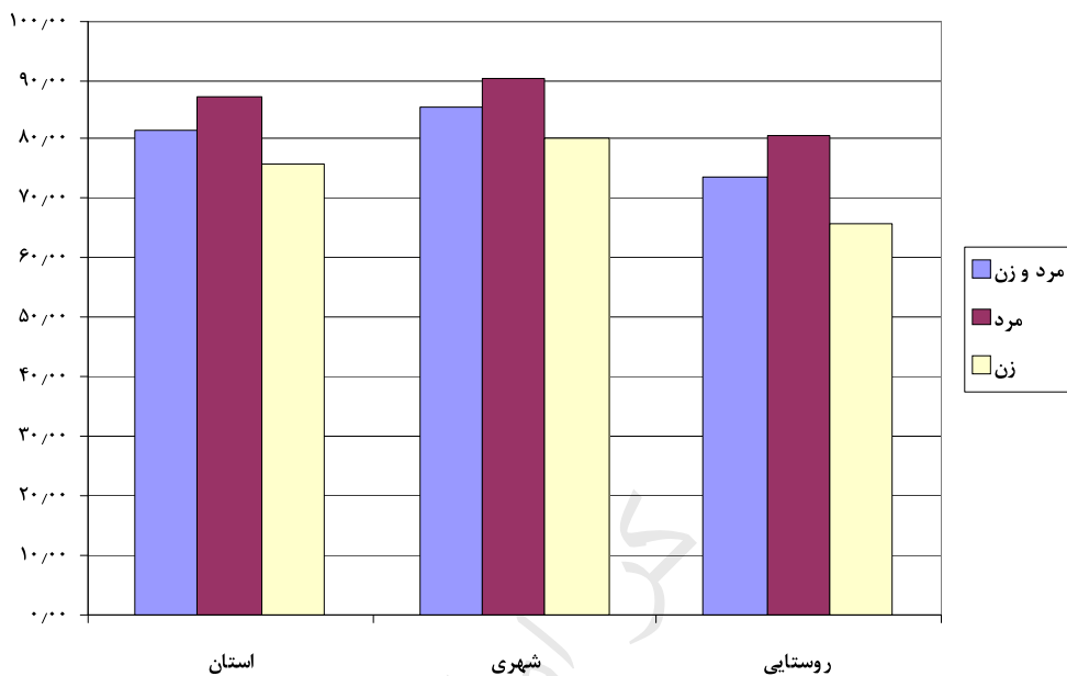
۱۲-۱- توزیع مهاجران وارد شده به استان طی ۱۰ سال گذشته بر حسب آخرین محل اقامت قبلی و محل اقامت فعلی - ۱۳۸۵