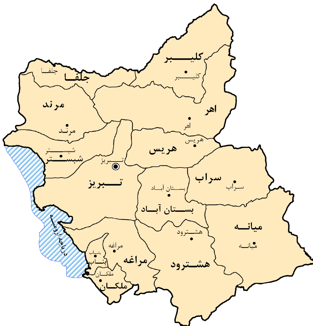
نقشه تقسیمات استان آذربایجان شرقی به تفکیک شهرستان سال ۱۳۷۵