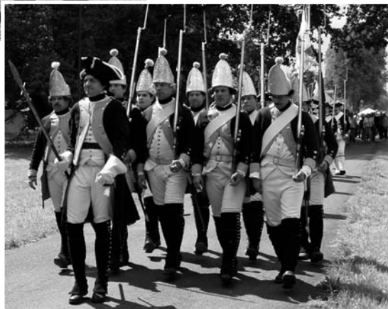
Grenadiere des Hessen-Kasselschen Füsilierregiments von Ditfurth in der Uniform von 1776 ( Amerikanischer Unabhängigkeitskrieg)