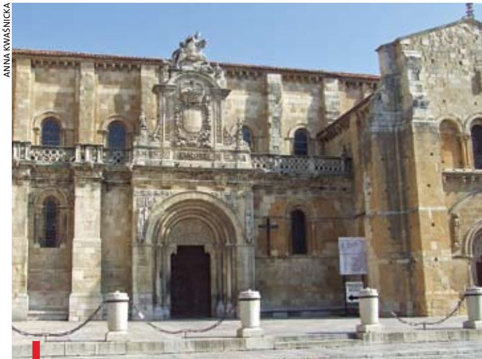
Wejście do kolegiaty św. Izydora w León, gdzie znajduje się grób patrona Internetu