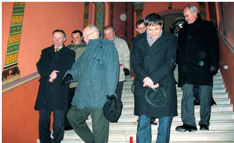
Kaplica Świętych Schodów annogórskiej kalwarii