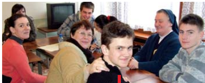
W warsztatach wzięło udział ponad 90 osób