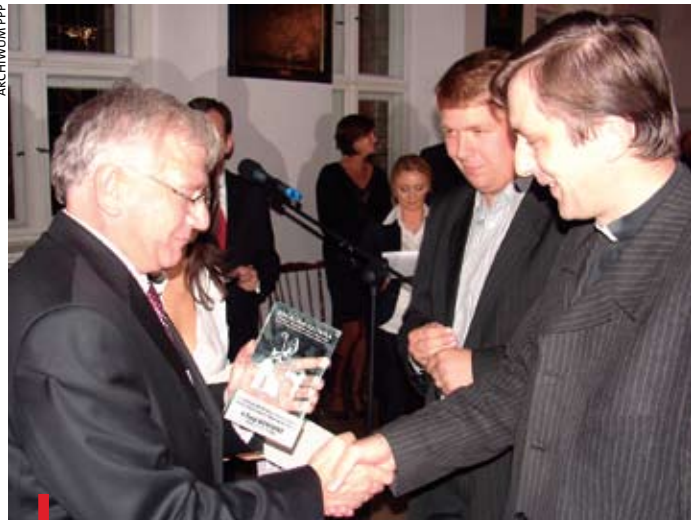
Administratorzy strony opolskiej par. Przemienienia Pańskiego laureatami Konkursu św. Izydora na najlepszą stronę parafialną

krótkie notki opatrzone zdjęciami z odbywających się koncertów, nabożeństw, dni skupienia czy turniejów sportowych służby liturgicznej. Często redaktorzy administrujący witryną zamieszczają również takie perełki, jak homilie z każdej niedzieli czy, tak jak na stronie parafii św. Piotra i Pawła z Opola, w dniu zakończenia rekolekcji udostępniono plik z treścią nauk wygłoszonych przez rekolekcyjnego. Ważne jest to, aby strona parafialna była efektem współpracy duszpasterzy i parafian, czego przykładowym efektem jest działająca niecały rok strona parafii Bożego Ciała i św. Norberta w Czarnowasach, na której znajdziemy przejrzyste ułożone artykuły zarówno o Kościele lokalnym, wydarzeniach parafialnych, jak i cykl „Myśli na dobry tydzień”. Administratorzy szukają różnych rozwiązań urozmaicających strony parafialne. Stąd filmy prezentujące kościół parafialny, odnośniki do wartościowych stron, teksty czytań na dany dzień. Autorzy strony parafii św. Rocha w Starych Budkowicach wprowadzili trzy wersje językowe: polską, niemiecką i angielską. Pomysł bardzo dobry, jednak nie cały serwis został przetłumaczony,