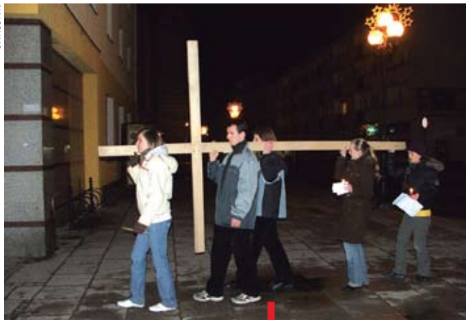
Około 200 osób szło za krzyżem

NYSA. Franciszkańskie Duszpasterstwo Akademickie „Fraternia” oraz Duszpasterstwo Akademickie przy parafii św. Jakuba w Nysie, po raz piąty zorganizowały 27 marca akademicką Drogę Krzyżową ulicami Nysy. Około 200 osób zgromadziło się o godz. 19:30 przy budynku głównym Państwowej Wyższej Szkoły Zawodowej przy ulicy Chodowieckiego, by w głębokim skupieniu modlić się za całą społeczność akademicką Nysy. Po rozpoczęciu modlitwy, pod czujnym okiem policji i straży miejskiej, które zapewniały modlącom się bezpieczeństwo, wyruszone z krzyżem i zapalonymi świecami, w miejsca, gdzie