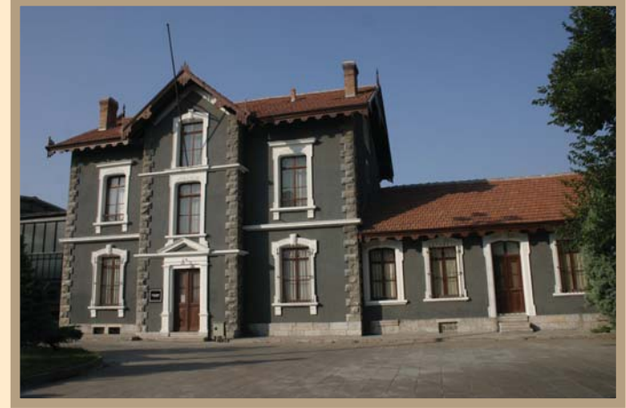
Ankara Milli Mücadele İstasyon Atatürk Evi