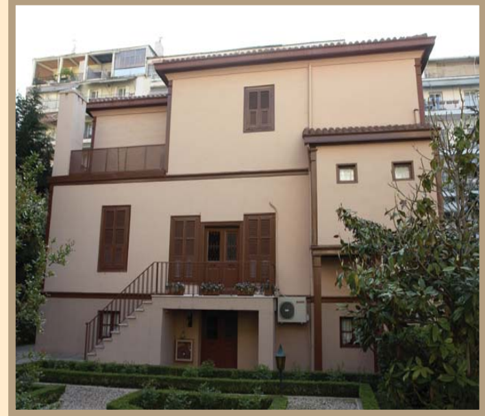
Selanik Atatürk Evi