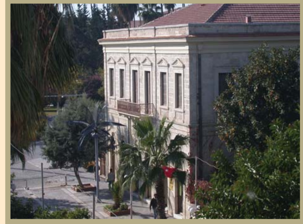
Mersin Atatürk Evi