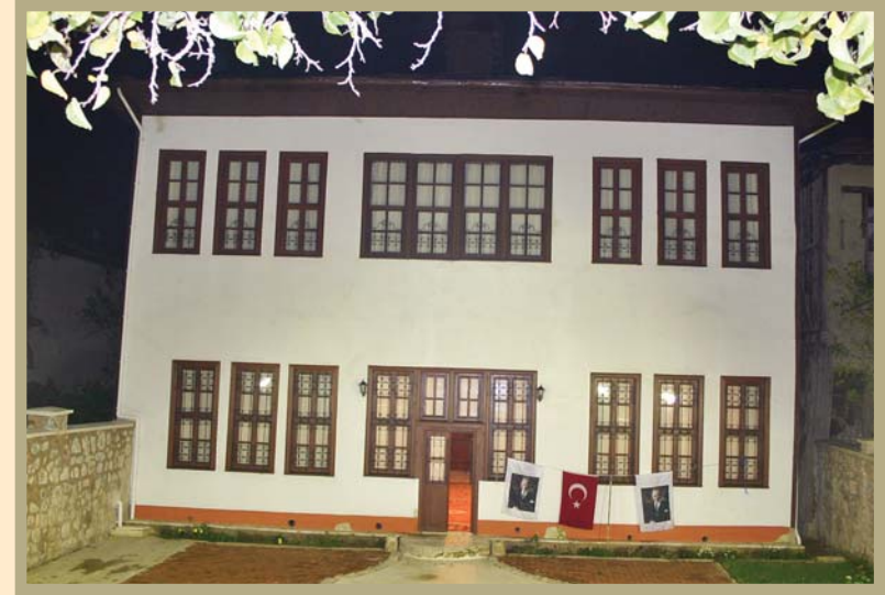
Tokat Atatürk Evi