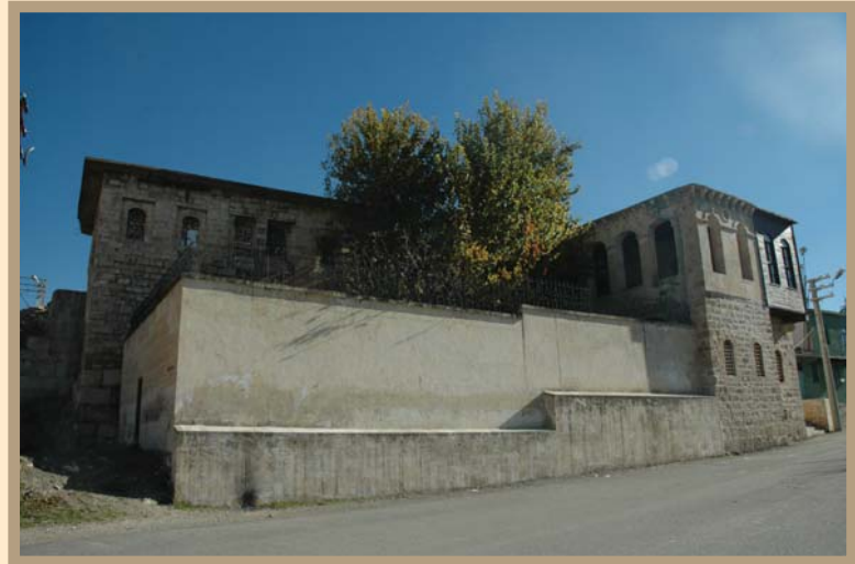
Silvan Atatürk Evi