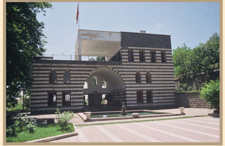
Diyarbakir Atatürk Köşkü