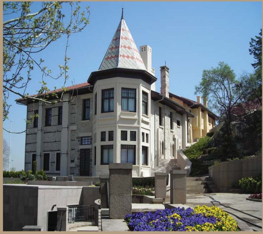
Ankara Çankaya Atatürk Köşkü (Müze Köşk)