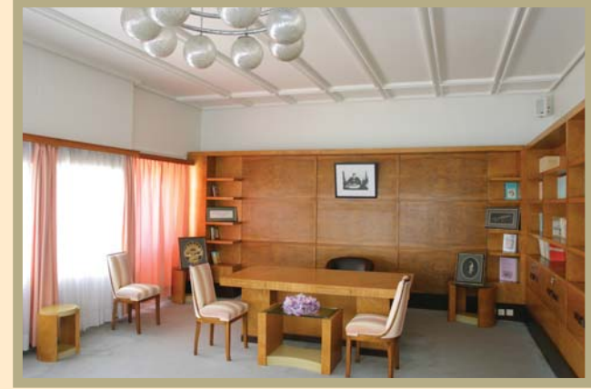
Florya Atatürk Köşkü