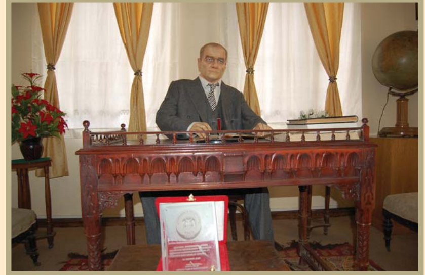
Konya Atatürk Evi