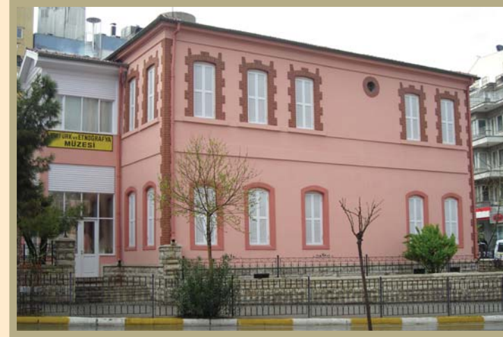
Denizli Atatürk Evi