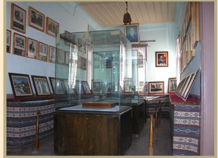
Sebinkarahisar Atatürk Evi