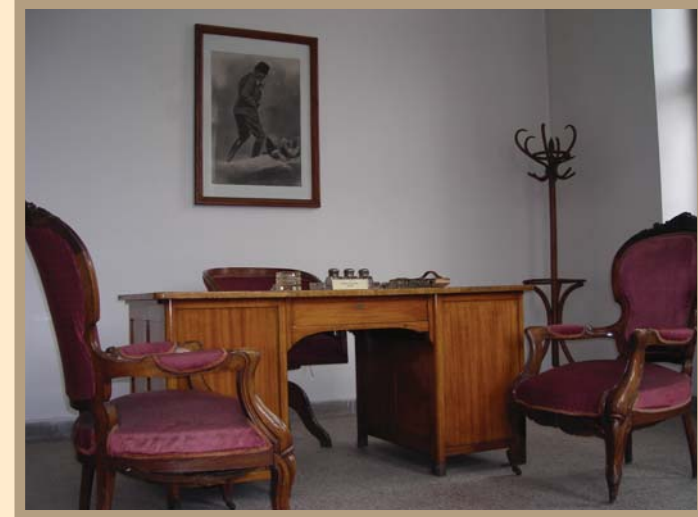
Afyon Zafer Müzesi