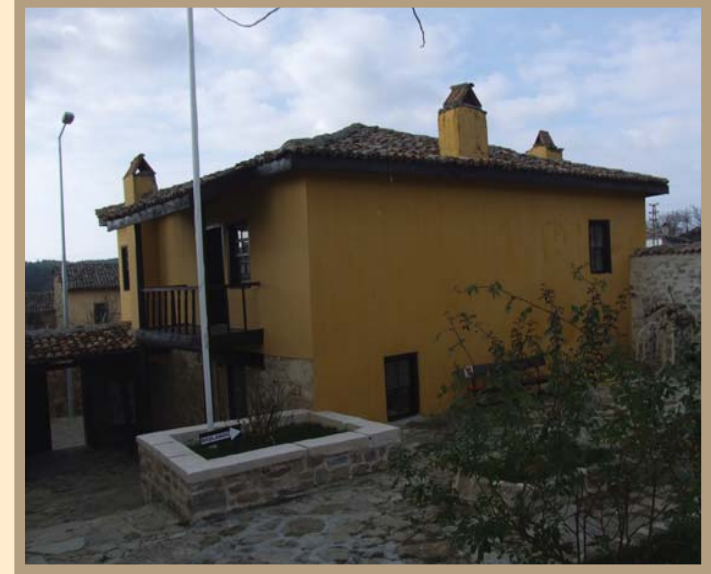
Bigalı Çamyayla Atatürk Evi