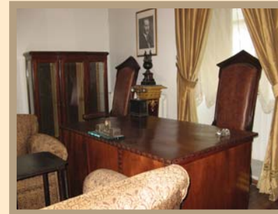
Izmir Atatürk Müzesi