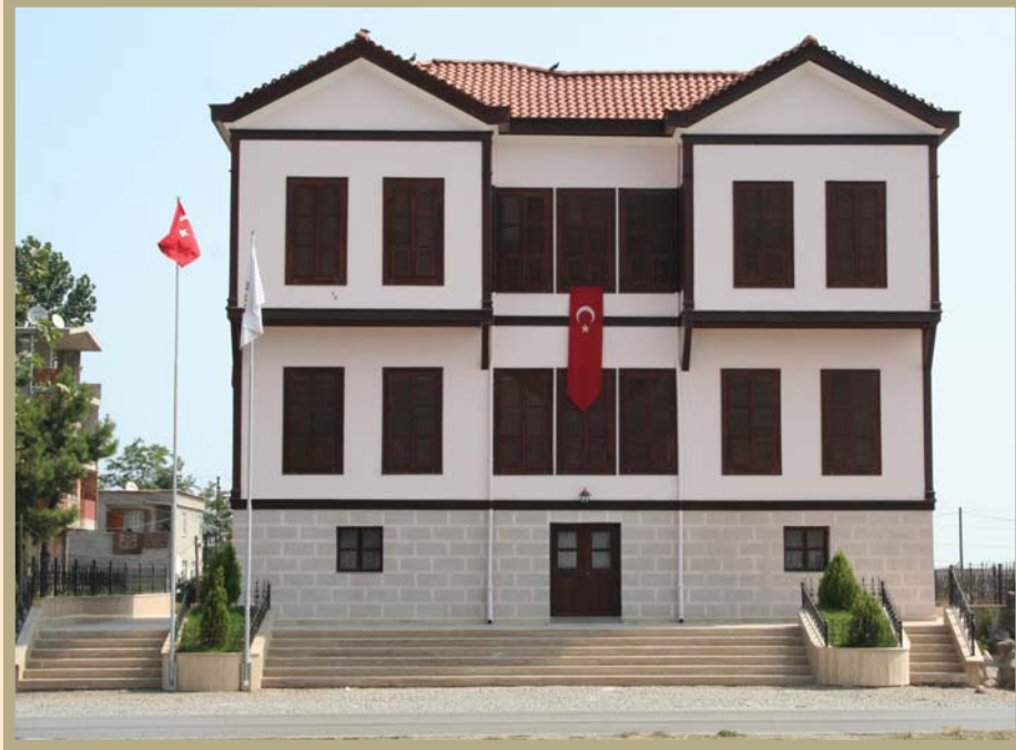
Samsun Kutlukent Atatürk Evi