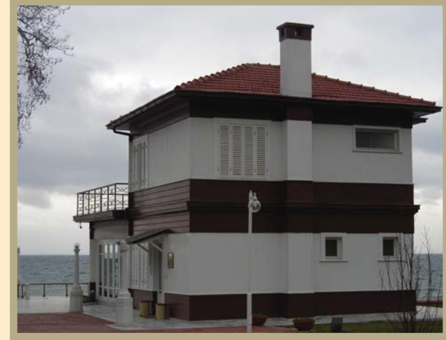
Yalova Yürüyen Köşk