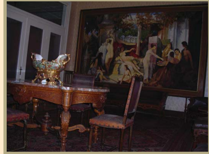
Yalova Termal Atatürk Köşkü