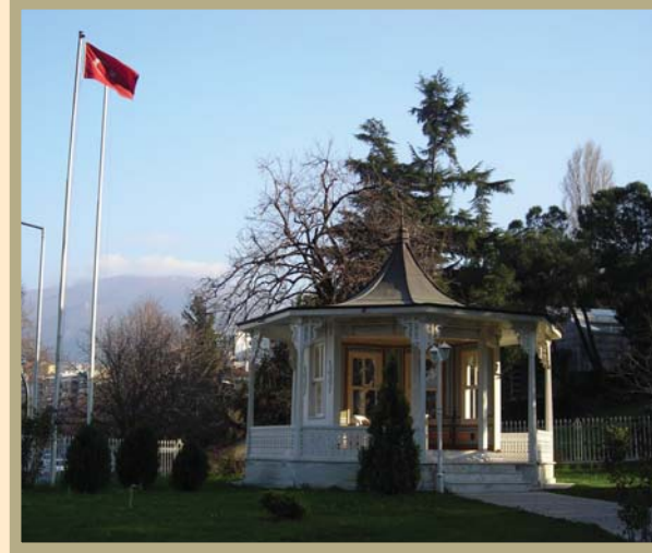
Bursa Atatürk Köşkü