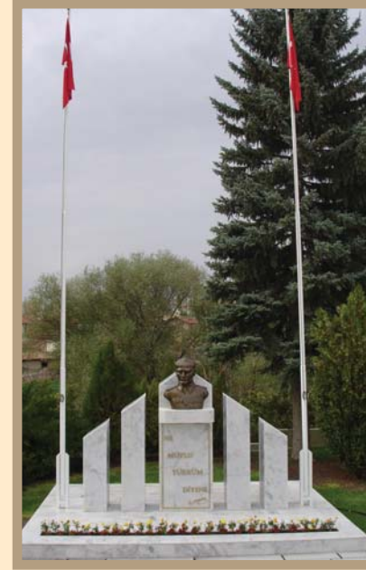
Alagöz Karargâh Müzesi