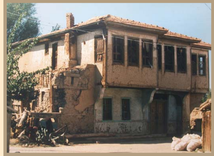
Şuhut Atatürk Evi