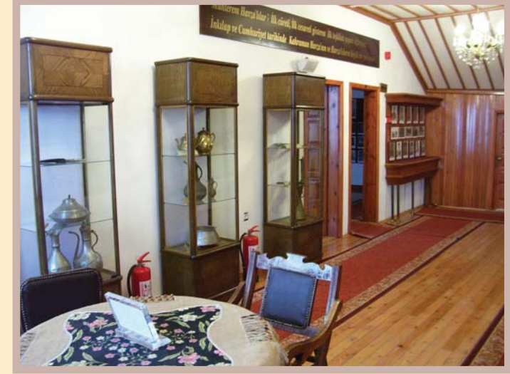
Havza Atatürk Evi