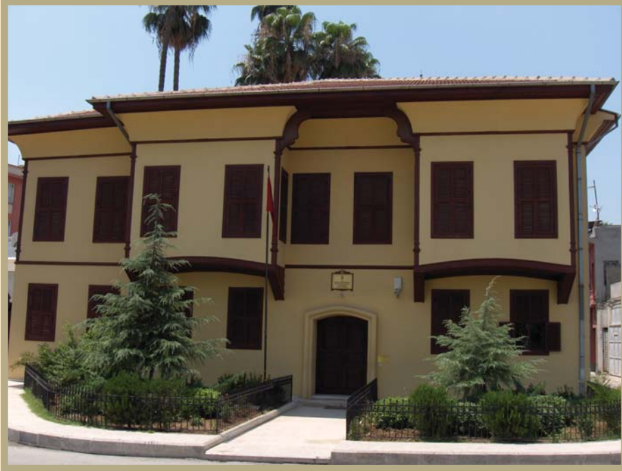
Adana Atatürk Bilim ve Kültür Müzesi