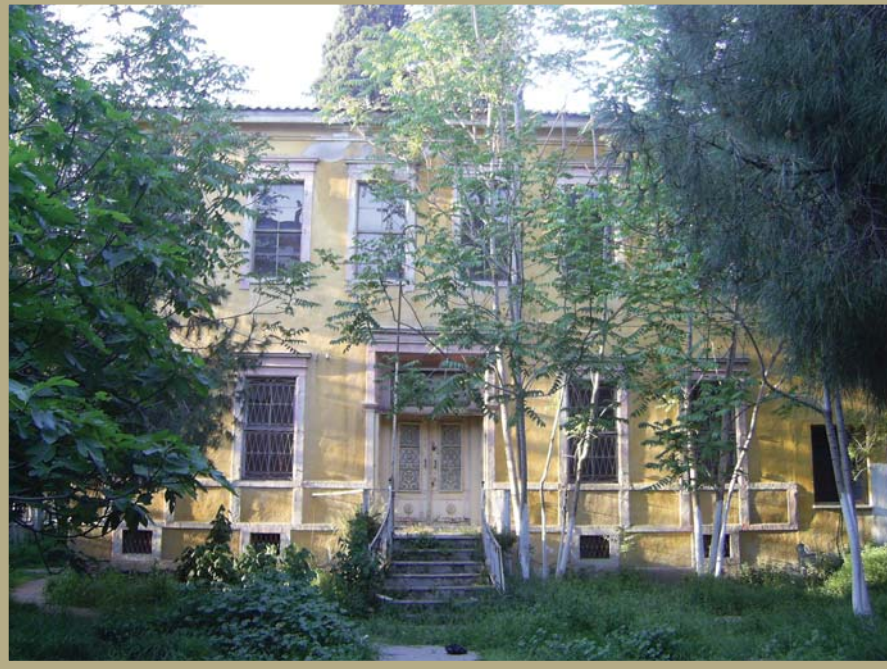
Karsiyaka Lâtime Hanım Köşkü