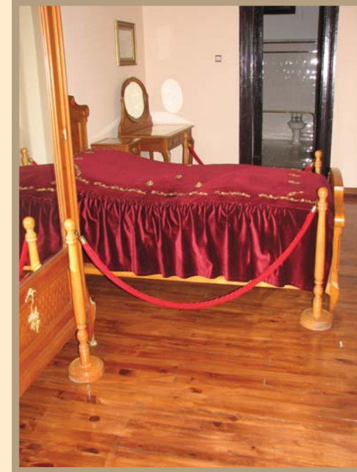
Samsun Gazi Müzesi