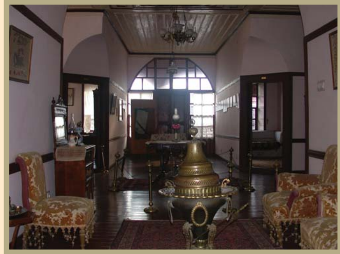
Silifke Atatürk Evi