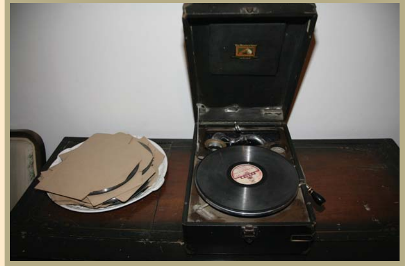
Alanya Atatürk Evi