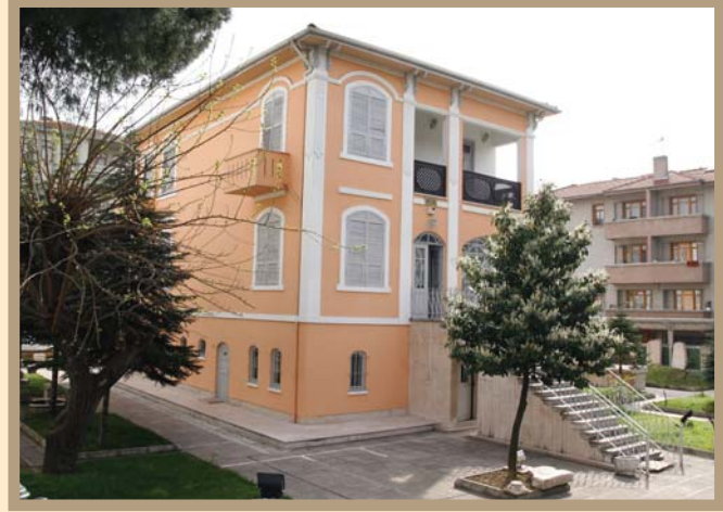
Sakarya Atatürk Müzesi