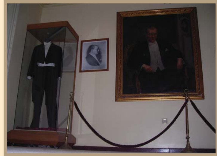
Istanbul Atatürk Evi