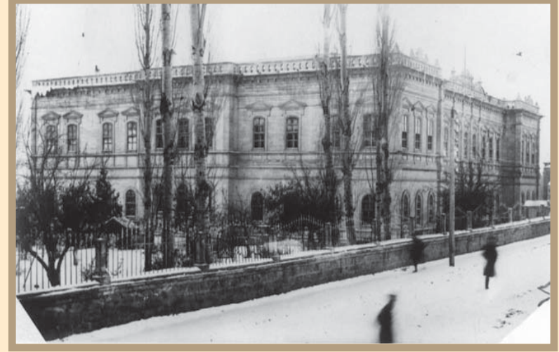
Sivas Kongre Binası