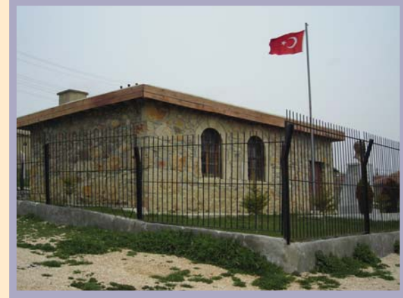
Haymana Çalis Köyü Atatürk Evi