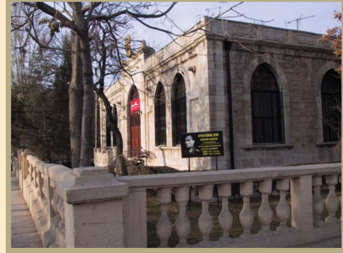
Malatya Atatürk Evi