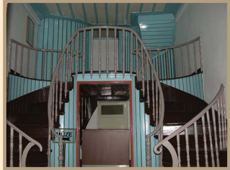
Kayseri Atatürk Evi