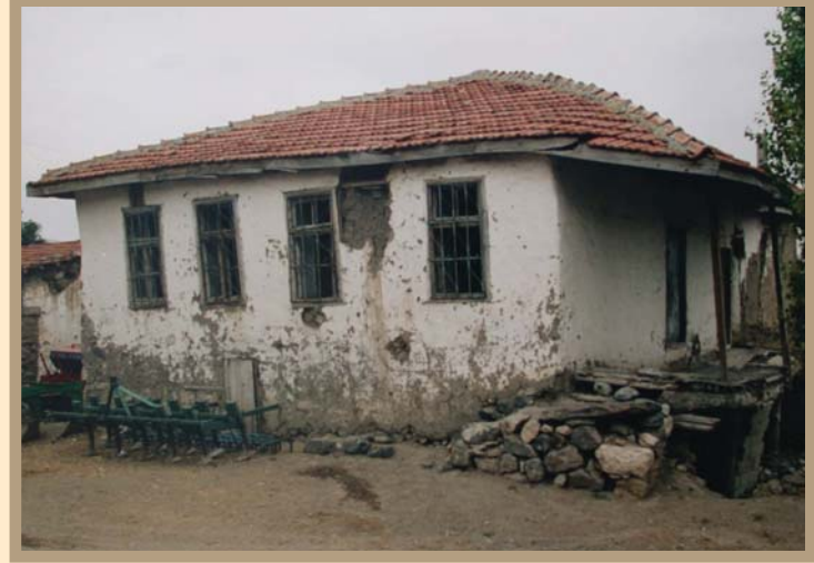
Ankara (Bâlâ) Beynam Atatürk Evi