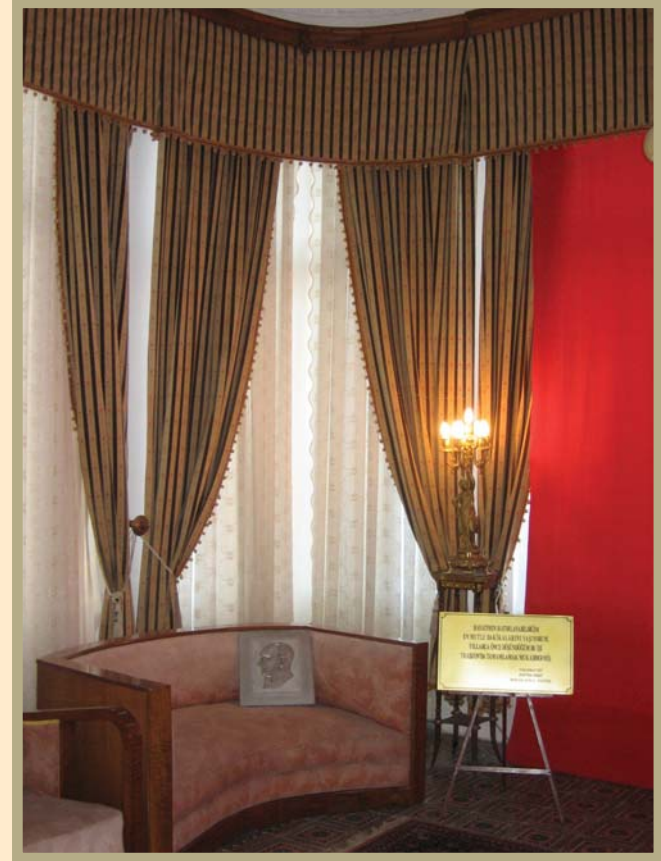
Trabzon Atatürk Köşkü