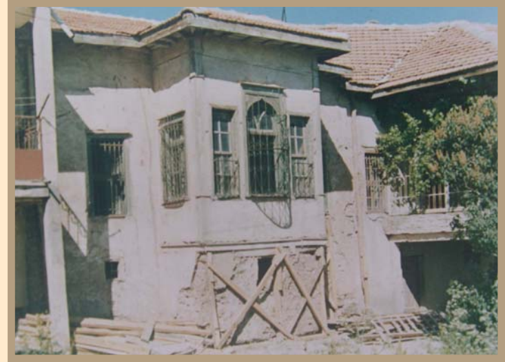
Hacibektaş Atatürk Evi