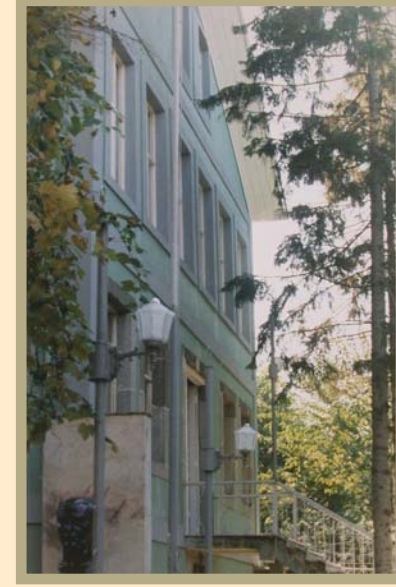
Rize Atatürk Müzesi