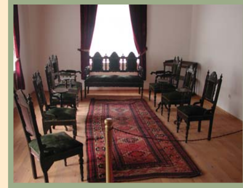
Erzurum Atatürk Evi