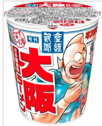
産経新聞 大阪ラーメン（12食入り）