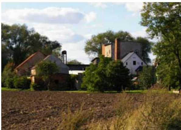
■ fot. Kozłów - zabudowania młyna

dają się stosunkowo typowe dla wsi dolnośląskiej z pocz. XX wieku. To co je wyróżnia to płaskorzeźba wmurowana w szczycie budynku gospodarczego, a przedstawiająca żniwiarkę ze snopami zboża w rękach. Nad wrotami stodoły data budowy zabudowań gospodarczych- 1917 r. i inicjały właściciela- H. W.