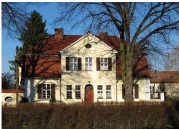
■ fot. Smolec - plebania

Kościół wzmiankowany już w 1323 r. Obecny kościół p.w. Najświętszej Marii Panny powstał w latach 1905-1908, w formie neobarokowej. Nowy kościół ufundowali ewangelicy wg projektu Ericha Graua z Wrocławia. Kościół halowy z wieżą przekrytą hełmem cebulastym. Wyposażenie z XX wieku, poza barokowym konfesjonalem. Na wieży płaskorzeźba „Zesłanie ducha świętego”, nad oknami korpusu płaskorzeźby przedstawiające czterech ewangelistów w postaciach zwierząt.