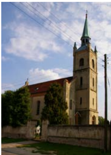
■ fot. Nowa Wieś Kącka - kościół

Na początku XX wieku ludność miejscowa zajmowała się przede wszystkim uprawą roli i hodowlą zwierząt. W pobliżu wsi, na zachód od niej, istniał wiatrak typu koźlak (wspomniany już w 1845 r.- istniał