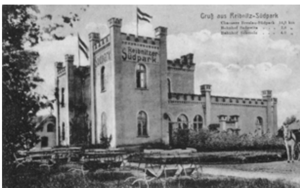
■ fot. Rybnica - nieistniejący zajazd Reibnitzer Südpark