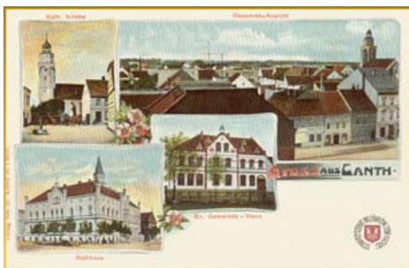
■ fot. Kąty Wr. - pocztówka z 1903 r.- kościół kat., widok z lotu ptaka, ratusz, nieistniejący Dom Wspólnoty Ew.

prawie magdeburskim przez księcia Bolka I świdnickiego, a właściwie przejęło prawa miejskie Milina, którego lokacja okazała się błędem. Kąty rozwijały się szybciej i miały lepszą lokalizację- w widłach rzeki Bystrzycy i Strzegomki, w pobliżu przeprawy wodnej, na skrzyżowaniu szlaków jeleniogórsko- wrocławskiego i legnicko- brzeskiego. Przejęcie praw miejskich książę Bolko I potwierdził w dwóch dokumentach z 25.10.1297 i 22.10.1298, sam akt lokacyjny nie zachował się- prawdopodobnie spłonął w jednym z pożarów miasta. Głównym powodem lokacji prawdopodobnie była kwestia militarna. Zamek Canth, wzniesiony jako graniczna twierdza, stanowił ochronę względem księstwa wrocławskiego. Pierwsze wzmianki pisane o nim pochodzą z 1293 r., do roku 1474 pozostał w posiadaniu Piastów.