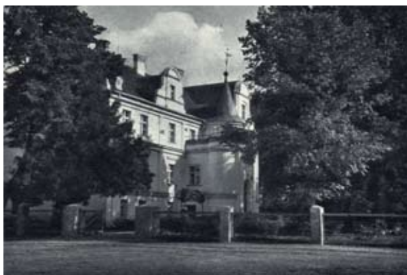
■ fot. Bliż - pałac w latach 30- tych XX w.

Do 1810 r. wieś stanowiła własność biskupstwa wrocławskiego. Po wojnach napoleońskich, majątek kościelny uległ sekularyzacji, a Bliż, podobnie jak inne folwarki biskupie, przeszedł na własność państwa- początkowo zarząd sprawował urząd domen- Königl. Domain Amt Kanth- kilka lat później przemianowany na Königl. Rent Amt Kanth.