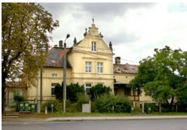
■ fot. Pietrzykowice - willa ul. Fabryczna 1

Administracyjnie Pietrzykowice znajdowały się w powiecie Wrocław- Kreis Breslau, po II wojnie światowej, w latach 1945-1954 w gminie Smolec, obecnie Kąty Wrocławskie. Po 1945 r. teren cukrowni określano jako Pietrzykowice I, wieś- Pietrzykowice II pod zarządem ZPNZ (Zrzeszenie Państwowych Nieruchomości Ziemskich), przeznaczone do parcelacji i na PGR. Do lat 90-tych we wsi funkcjonował Zakład Przetwórstwa Owocowo-Warzywnego, na terenie dawnej cukrowni oraz Ferma Zwierząt Futerkowych.