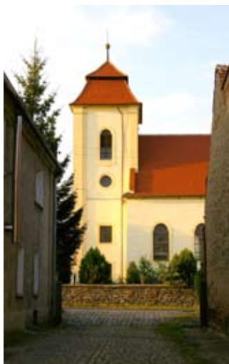
■ fot. Pelcznica - kościół

nonawowa z węższym, trójbocznie zakończonym prezbiterium, oskarpowana z wieżą, od strony zachodniej. Przykryta dachem dwuspadowym i pięciospadowym nad prezbiterium. Wieża kryta dachem mansardowym. Sklepienia krzyżowo-żebrowe. Wyposażenie barokowe i rokokowe. Wmurowane w elewacje zewnętrzne płyty nagrobne z XIX wieku. W kamienny mur, częściowo od wschodu ceglany, wmurowano kapliczkę pokutną z ostrofukowym otworem wnętrza.