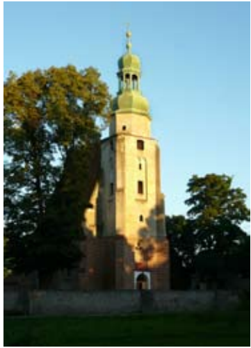
■ fot. Małkowice - kościół