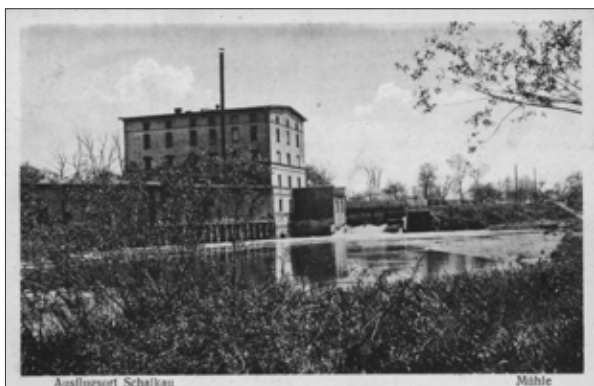
■ zdjęcie archiwalne młyna

Od roku 1945 r. miejscowość występowała pod spolszczonej nazwą Siołków, bezprawnie zajęta przez Armię Czerwoną i Wojsko Polskie, została przeznaczona przez DOW IV na osadnictwo wojskowe, następnie PUZ nadzorował parcelację pomiędzy osadników.