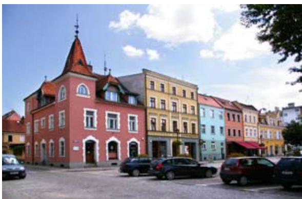
■ fot. Kąty Wr. - pierzeja wschodnia (z apteką)

miejscu starych- drewnianych i fachwerkowych. Przeważająca część zachowanych kamienic powstała w stylu neoklasycystycznym (ul. Świdnicka 5, 21; Rynek 37). Z XVIII wieku pochodzi kamienica Rynek 35 z obdasznicami, gzymsem na konsolach i wykończeniem sztukaterią. Kamienicę ul. Świdnicka 35 prawdopodobnie równie starą - z XVIII wieku - wyróżnia wejście ujęte zdwojonymi pilastrami, powyżej balkon. Pod względem detalu architektonicznego wyróżnia się kamienica nr 26, w