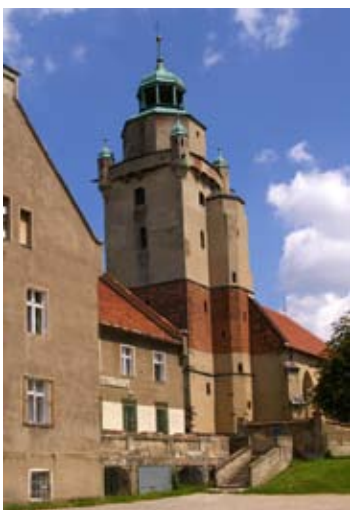
■ fot. Kąty Wr. - kościół katolicki p.w. św. Piotra i Pawła

W tym samym czasie, w którym powstał kościół, miastu