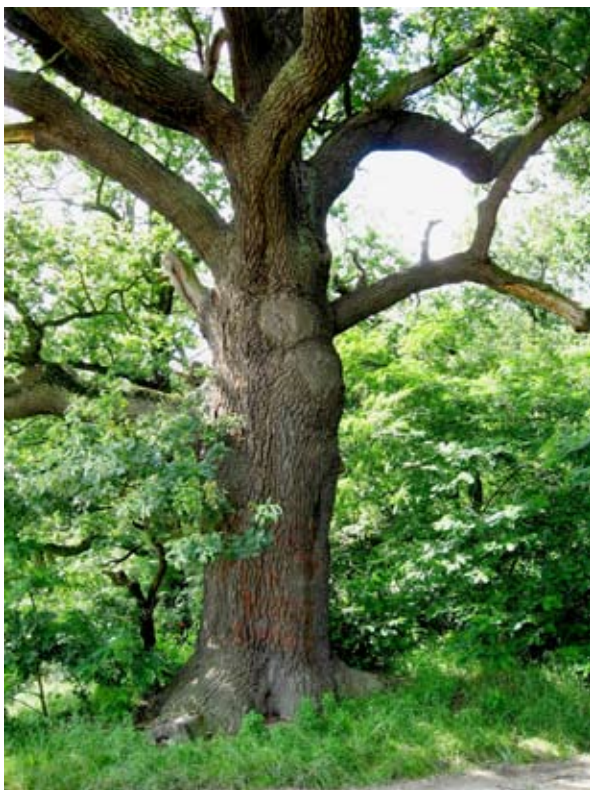
■ fot. dąb w okolicy Skałki

obrębnie parku występują również rzadko spotykane ostrożeń siwy i koniopłoch łąkowy, często można natrafić na śnieżyczkę przebiśnieg, konwalię majową, kopytnik pospolity, kalinę koralową, rzadziej zdarza się widzieć szafirek drobnokwiatowy, śnieżycę wiosenną i lilię złotogłów. Świat fauny reprezentują przede wszystkim liczne ptaki- modraszka, zięba bogatka, świstunka, kowalik, rudzik i pierwiosnek. Spośród ssaków pojawiają się wydry i nietoperze. Gady i płazy reprezentują traszka zwyczajna, żaba trawna i wodna, ropucha zwyczajna, kumak zwyczajny, jaszczurka zwinka i zaskroniec. Spośród licznych gatunków ryb warto wymienić okonia, płoć, liczne kiełbie, a także ciernika, szczupaka, śliza, sandacza i leszcza. Zdarzają się unikatowe gatunki owadów: kozioróg dębosz, paź królowej, a także największa kolonia rzadkiego motyla przeplatki maturalny.