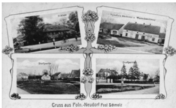
■ fot. Nowa Wieś Wroc. - pocztówka z XIX/XX w.

17 km na południowy zachód od Wrocławia, 14,5 km na wschód od Kątów Wrocławskich leży wieś ulicówka powstała ze średniowiecznego folwarku, przynależącego do posiadłości biskupów wrocławskich w Jaszkotlu- przez około dwieście lat istnienia od XII do XIV wieku nie posiadała własnej nazwy. W 1382 r. została opisana w źródłach po raz pierwszy jako Jescutyl alias Nouauilla. Od 1393 r. należała do kapituły katedralnej we Wrocławiu- w źródłach wspominana jako Newdorff (1443, 1593 r). Z czasem przyjęła się niemiecka nazwa Polnische Neudorf.