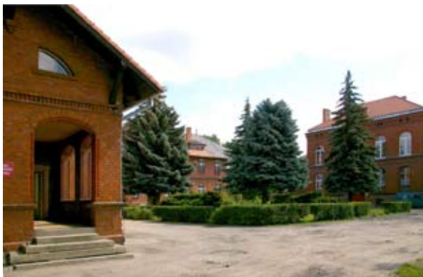
■ fot. Kąty Wr. - Dom Małego Dziecka

typowe dla architektury użyteczności publicznej z tego okresu- to proste i funkcjonalne zabudowania z czerwonej cegły li-cówki, z wysokimi dachami dwuspadowymi, z dekoracyjnym wykończeniem ciesielskim drewnianych elementów.