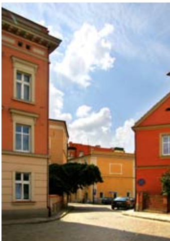
■ fot. Kąty Wr. - widok od str. ul. Świdnickiej

nowoczesna placówka z oddziałem zakaźnym, salą operacyjną i pierwszym na Dolnym Śląsku aparatem rentgenowskim. Gdy w latach 1935-36 władze hitlerowskie zakazały siostram działalności, przenieśli się one do innego budynku. W czasie II wojny światowej szpital nie ucierpiał, dopiero po zajęciu Kątów przez Armię Czerwoną budynek spłonął- prawdopodobnie przyczyniły się do tego duże zapasy spirytusu w magazynie