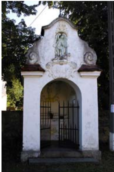
■ fot. Bogdaszowice - kaplica w murze kościelnym