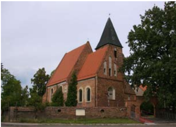
■ fot. Jasz kotle - kościół

Do 1945 r. administracyjnie Jaschgüttel podlega powiatowi Wrocław- Kreis Breslau, po 1945 r. najpierw przynależał do gminy Smolec jako Jesionowice, z czasem przyjęła się nazwa Jasz kotle, a po reformie administracyjnej z 1954 r. wieś podlega już Kątom Wrocławskim. Od początku przeznaczona została na parcelację pomiędzy osadników. Dominującymi obiektami we wsi były i są kościół oraz klasztor- jeszcze przed wojną należał do elżbietanek. Obecnie przy klasztorze funkcjonuje Zakład Leczniczo – Wychowawczy Zgromadzenia Sióstr Maryi Niepokalanej.