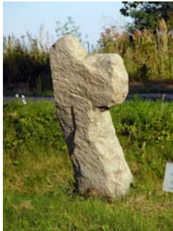
■ fot. Kąty Wr. - krzyż pokutny

bieranych w tym czasie murów miejskich. Od tamtej pory nie wykonano z pewnością żadnych wyroków, a w latach 50-tych XX wieku szubienicę rozebrano.