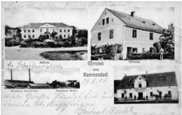
■ fot. Kamionna - pocztówka z pocz. XX w. z widokiem pałacu i cegielni w Stradowie

W XV wieku wieś należała do rodu von Reydeburg, kolej-