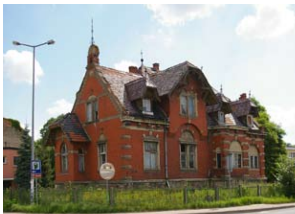
■ fot. Kąty Wr. - Willa Różana ul. Wrocławska

Od końca XIX wieku na terenie Kątów, poza granicami staro- go miasta, zwłaszcza przy głównej drodze- dziś ul. 1-go Maja, wiodącej do dworca oraz przy ulicy Wrocławskiej z