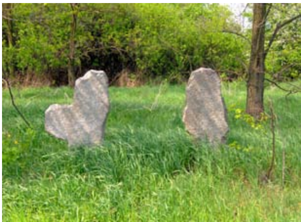
■ krzyże pokutne na Karnczej Górze

zaginione krzyże pokutne z XIV-XVI wieku. Pierwszy, 1.3 m wysokości, z utraconym ramieniem. Z drugiego zachowały się dwa fragmenty trzonu, bez ramion. Trzeci z grupy krzyży obecnie znajduje się przy drewnianym kościółku w Parku Szczytnickim.