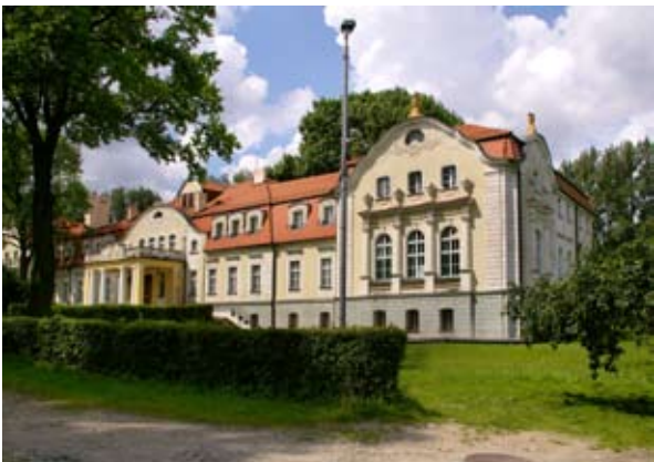
■ fot. Sadowice - pałac

Niemiecka nazwa Sadewitz została w 1937 r. zmieniona na bardziej niemiecko brzmiącą Schill, administracyjnie leżała w powiecie Wrocław- Kreis Breslau do 1945 r. Przez kilka lat po wojnie wieś nazywano Sadowiec, dopiero z czasem przyjęła się nazwa Sadowice. W 1945 r. Sadowice zostały zajęte przez Wojsko Polskie, następnie dzierżawione w roku 1946 przez Samodzielny Pułk Samochodowy Rządu. Folwark nie objęła parcelacja- przeznaczono go „na cel kultury rolnej”, jednak z czasem to rolnictwo indywidualne dominowało we wsi.