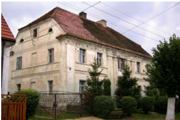
fot. Kilianów - dom nr 27

Dom nr 27 z bogatą dekoracją elewacji, z II połowy XIX wie-