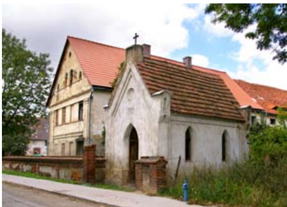
■ fot. Wojtkowice - kaplica przydrożna

Do domu przylega od tyłu budynek gospodarczy, również dwukondygnacyjny z dachem dwuspadowym. Po drugiej stronie podwórza ustawiona kalenicowo obora z 1880 r., murowana z dachem dwuspadowym, połączona ze stodołą z tego samego okresu. Otwory wejściowe i okienne wykończone cegłą. Zachował się ceglany mur częściowo otynkowany, z pozostawionymi bez tynku ceglanymi słupkami i fryzmem z ustawionych narożnie cegieł. Gospodarstwo jest dobrym przykładem bogatej zagrody XIX-wiecznej z wielopokoleniowym domem mieszkalnym i rozbudowanymi budynkami dla zwierząt hodowlanych i magazynowania plonów.