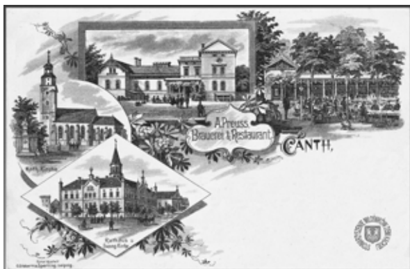
■ fot. Kąty Wr. - pocztówka z 1902 r.- kościół, dawny browar, ratusz