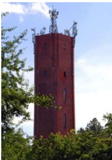
W Kątach funkcjo- ■ fot. Kąty Wr. - wieża ciśnień ul. Popiełuszki

Pod koniec II wojny światowej fabrykę zajęła Armia Czerwona- najcenniejszą część sprzętu wywieziono do ZSRR, jednak już w 1947 r. udało się uruchomić na nowo fabrykę krochmalu. Około roku 2000 zabudowania zostały wyburzone, ostatni ślad po fabryce- dziewięćdziesięciometrowy komin zniknął w 2008 r.