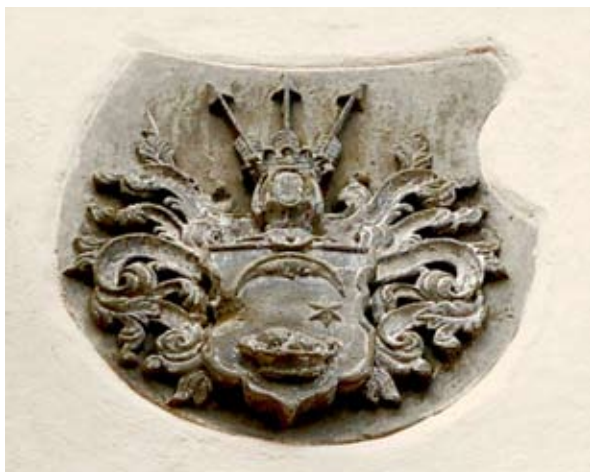
■ fot. Baranowice - herb na elewacji frontowej pałacu

W źródłach historycznych wspomniana po raz pierwszy jako posiadłość rycerska Baranowicz w 1341 r. Nazwa ewoluowała w ciągu wieków, w wyniku zmian pisowni i wymowy- w 1361 r. Baran, w 1683 r.- Bara. Do 1939 roku funkcjonowała nazwa Baara, którą przekształcono na Bahra.