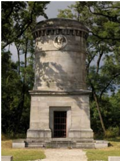
■ fot. Krobielowice - mauzoleum G. Blüchera

Blücher, jako naczelnny wódz wojsk napoleońskich od 1813 roku stał się sławny przede wszystkim po zwycięstwach nad wojskami francuskimi pod Kaczawą, a zwłaszcza po bitwie pod Waterloo w 1815 r., kiedy to stał się bohaterem narodowym Niemców. Marszałek osiadł w dobrach krobielowickich i tu zmarł. Historia mauzoleum Blüchera ciągnie się na przestrzeni lat. Uroczystość pogrzebu w 1819 r., w Wojtkowicach uświęcił sam król pruski Fryderyk Wilhelm III. Wkrótce narodził się pomysł wystawienia bohaterowi pomnika w miejscu, które szczególnie sobie upodobał podczas spacerów po swoich dobrach. Prace nad grobowcem trwały ponad 40 lat. Pomnik autorstwa znanego rzeźbiarza Jana Henryka Strack miał zostać wystawiony ze składek żołnierzy- pierwotnie mauzoleum przypominało piramidę ze ściętym stożkiem, na której szczy- cie znajdowała się rzeźba lwa, wejścia do mauzoleum strzegły rzeźby dwóch mniejszych lwów. Gen. von Zieten nadzorujący cały projekt, zakupił olbrzymi głaz granitowy w sobóckich kamieniołomach o masie zbliżonej do 589 680 kg. Głaz okazał się tak wielki, a prace tak drogie, iż nie udało się go przetransportować, a sprawa