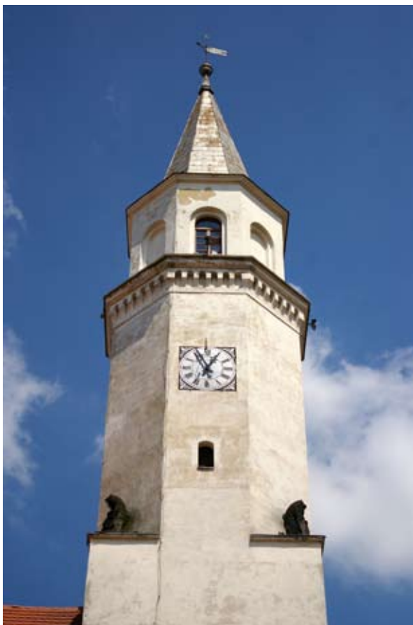
■ fot. Kąty Wr. - wieża ratuszowa od str. pd