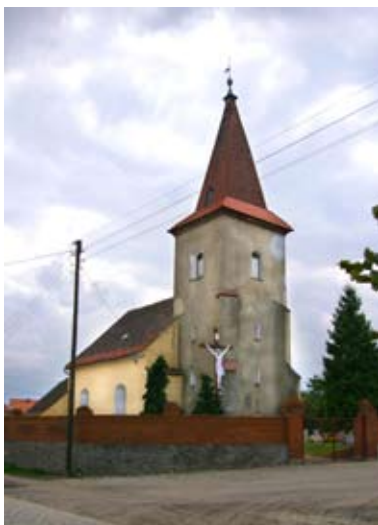
■ fot. Kilianów - kościół