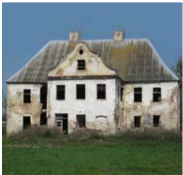
■ fot. Górzyce - pałac

W latach 80-tych snuto plany odremontowania obiektu i przeznaczenia go „na potrzeby socjalne pracowników PGR- cele kulturalne i pokoje gościnne”. Plany zarzucono, a po rozpadzie państwowego gospodarstwa, w latach 90-tych, do pomysłu nie powrócono.