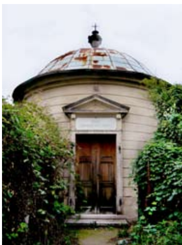
■ fot. Sadków - mauzoleum von Rothkirchów