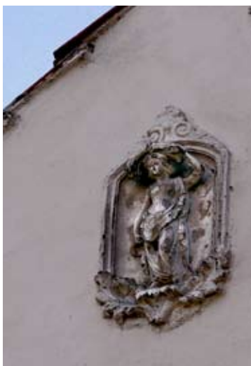
fot. Kozłów - płaskorzeźba - dom nr 7