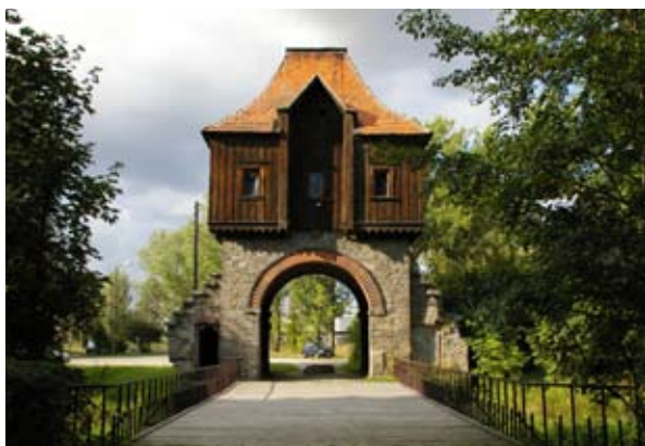
fot. Krobielowice - brama

Pałac powstał w południowej części wsi. Poprzedza go folwark z XIX wieku, przy czym od strony wschodniej istniały zabudowania gospodarcze wcześniejsze- z 1878 roku. Za pałacem do dziś funkcjonuje podłużny staw - jedyny zachowany z zespołu stawów rybnych istniejących w baroku. W pobliżu przepływa rzeka Czarna Woda. Na teren pałacu prowadzi brama z tego samego okresu. Jej przyziemie wykonano z ciosów kamiennych, piętro obłożono drewnem. Portal półkolisty zdobią rozety i czworoboczne kłińce.