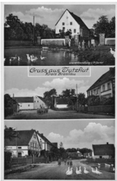
■ fot. Sokolniki - pocztówka z pocz. XX w.

Dom mieszkalny nr 11 z 1848 r. (data nad wejściem zapisana cyframi rzymskimi: MDCCCXLVIII, z inicjałami U.K.E. oraz domalowanymi później cyframi 48, na zapisie rzymskim). Budynek murowany, piętrowy, ustawiony szczytowo, z dachem dwuspadowym (pierwotnie z lukarnami). Część otworów okiennych zmieniono. W części centralnej wejście i portal z łukiem koszowym, ujęty parami pilastrów, podobnie krawędzie ścian zdobią pilastry. Do domu przylega budynek gospodarczy. Obora naprzeciwko budynku mieszkalnego, szczytowo ustawiona do ulicy, z końca XIX wieku. Murowana, sklepienie