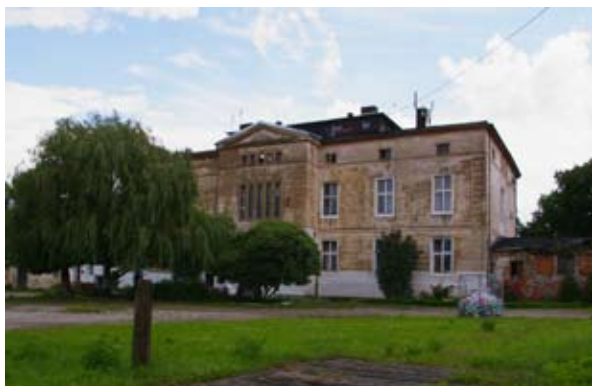
■ fot. Małkowitz - pałac

Pośród zabudowań przynależących do klasztoru zachowała się oficyna klasztorna z przełomu XIX/ XX wieku, parterowa budowla o konstrukcji szachulcowej, wypełnionej cegłą, przekryta dachem dwuspadowym ze świetlikiem. Za głównym gmachem stoi altana drewniana z początku XX wieku, na podmurówce z drewnianą balustradą, nakryta daszkiem brogowym.