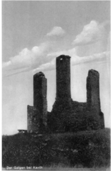
■ fot. Kąty Wr. - szubienica w 1942 r.

Zanim powstała szubienica na wzgórzu miał rosnąć dąb, na którym zgodnie ze średniowiecznym prawem wieszano skazańców. Dąb jednak spłonął od uderzenia pioruna, a ówczesny burmistrz Kątów Noe Pordens ok. 1578 r. nakazał budowę szubienicy. Znajdowała się ona na skraju miejskich gruntów i miała przede wszystkim pełnić funkcję prewencyjną. Podobno nikt nigdy nie został w tym miejscu stracony. Kiedy pewnego razu zebrała się Rada Miasta i wszyscy mieszkańcy, by obejrzeć egzekucję, okazało się, że zapomniano sznura. Postanowiono wysłać do miasta po powróż samego skazańca, jakież musiało być zdziwienie, gdy po wielu godzinach oczekiwania złoczyńca nie powrócił i nigdy już w Kątach się nie pojawił. Na początku XIX wieku przeprowadzono remont obiektu, z wykorzystaniem cegły z roz-