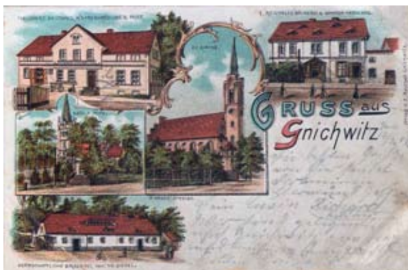
■ fot. Gniechowice - pocztówka z końca XIX w. z widokiem obu kościołów

Badania archeologiczne potwierdziły ciągłość osadnictwa od czasów neolitu, ale w dokumentach historycznych wieś pojawia się dopiero w 1288 r. pod nazwą Gnekowiz, Gniechowicz, w 1310 r. - Gnichwicz, Gnechewitz. Nazwa Gnichwitz została zmieniona po 1936 r. na Altenrode ze względu na polskojęzyczne brzmienie. Jest pewne, że już w roku 1299 Gniechowice posiadały własny kościół i proboszcza Wilhelma.