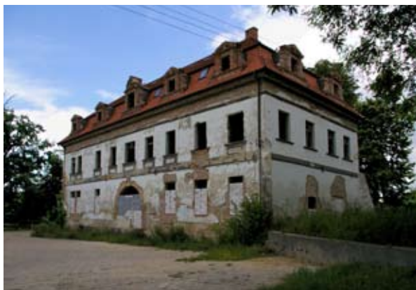
■ fot. Gniechowice - pałac

We wnętrzu obecnie brak wyposażenia. W północno-zachodniej części na piętrze znajdował się kominek z XVIII wieku. Pomieszczenia kondygnacji dekorowały stiuki i malowidła- nie zachowały się do dziś w pierwotnym stanie.