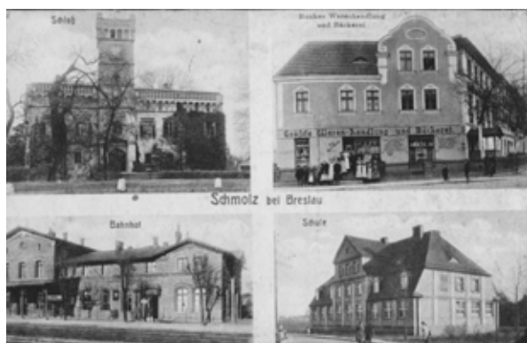
■ fot. Smolec - pocztówka z pocz. XX w.- pałac, kamienica ul. Główna, dworzec, szkoła

Wieś położona 14 km na południowy zachód od Wrocławia, 16.5 km na północny wschód od Kątów Wrocławskich.