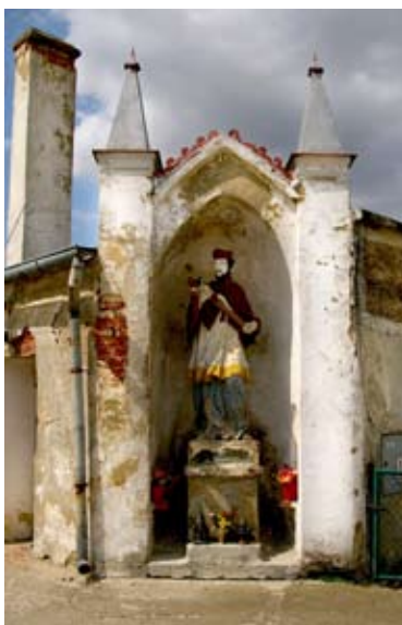
■ fot. Wszemiłowice - figura św. Jana Nepomucena

Dom nr 20 z połowy XIX wieku, przebudowany w XX wieku, murowany, piętrowy, ustawiony szczytowo, z dachem naczółkowym ze świetlikami. Obok ustawiony kalenicowo parterowy budynek mieszkalny nr 18, z dachem dwuspadowym. Między nimi wjazd przez bramę z łukiem koszowym oddzieloną filarem od wejścia dla pieszych, również zamkniętą arkadowo, szczyt