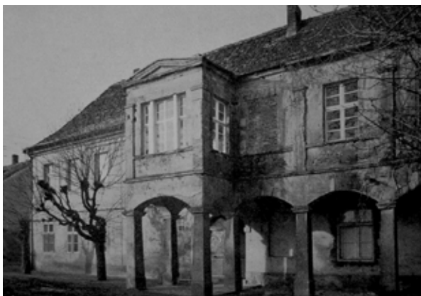
■ fot. Gądów - pałac w latach 30-tych