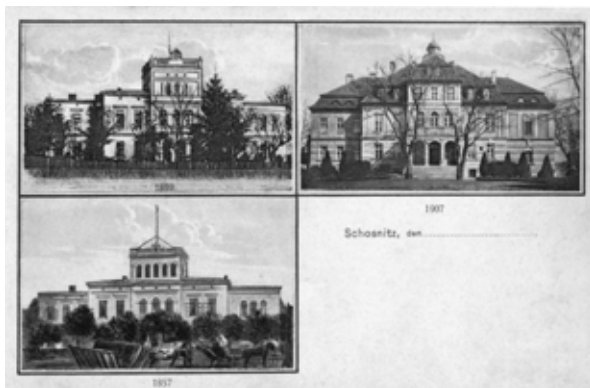
Sośnica - pałac w 1857, 1889 i 1907 r.