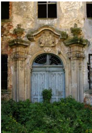
fot. Czerńczyce - portal wejściowy pałacu