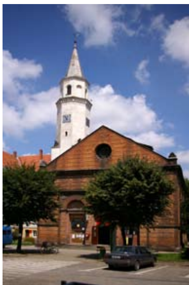
■ fot. Kąty Wr. - dawny kościół ewangelicki, Rynek

Pierwszy kościół ewangelicki powstał w Kątach około 1600 roku. Większość mieszczan była wyznania ewangelickiego, jednak miasto do 1810 roku podlegało biskupom wrocławskim. Z nakazu biskupiego zarządcy świątynię rozebrano. W okresie reformacji od 1632 roku funkcję zboru pełnił kościół św. Piotra i Pawła. Po przywróceniu katolikom ich świątyni, nabożeństwa odbywały się prawdopodobnie w sali ratuszowej. Możliwość budowy kościoła pojawiła się dopiero po sekularyzacji majątku kościelnego w 1810 roku. Lata 1831-33 to okres starania się o zgodę na budowę świątyni przez stowarzyszenie ewangelickie. Ewangelicy zwrócili się do głównego urzędu budowlanego Prus z gotowym projektem, jednak zainteresował się tą sprawą jeden z najlepszych architektów niemieckich okresu klasycyzmu Carl Friedrich Schinkel (1781-1841)- nadworny architekt pruski, autor projektu pałacu w Kamieńcu Żąbkowickim, zamku Babelsberg w Poczdamie i licznych obiektów publicznych na terenie Berlina.