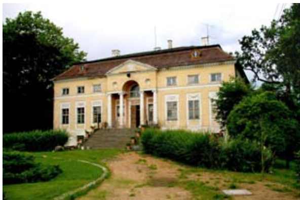
fot. Samotwór - pałac