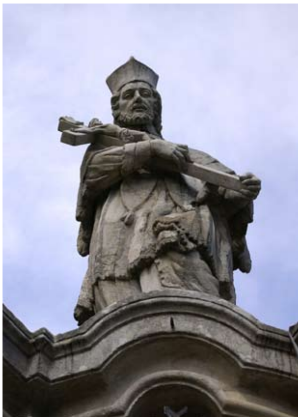
■ fot. Kamionna - figura św. Jana Nepomucena