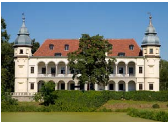
■ fot. Krobielowice - pałac

Opuuszczona przez Blücherów w 1945 r. siedziba popadła w ruinę. W ewidencji zabytków z 1958 zaznaczono, że o ile w 1945 r. pałac był w dobrym stanie, to już w 1958 r. zastano go „częściowo zdewastowanego”. Książki i obrazy ze zbiorów krobielowickich przejął Uniwersytet Wrocławski. Meble, porcelana, zbiory sztuki częściowo wywieziono, część znalazła nowych właścicieli w okolicy. Pałac zostaje przeznaczony na mieszkania dla pracowników gospodarstwa PGR, jednak w latach 70-tych, po wybudowaniu bloków mieszkalnych, ostatni mieszkańcy opuścili go i popadł w ruinę. W 1978 r. przejęty przez Biuro Turystyki Młodzieżowej, od 1989 r. właścicielem został Urząd Miasta i Gminy Kąty Wrocławskie. W wyniku przetargu w latach 90-tych pałac odkupił potomek rodu Potockich i Blücherów, który przywrócił dawną świetność założeniu. Remont trwał od 1992 do 1995 r. Obecnie istnieje tu hotel z centrum konferencyjnym i polem golfowym, będącym sporą atrakcją.