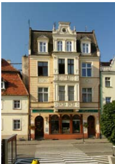
Kąty Wr. - kamienica nr 26, Rynek