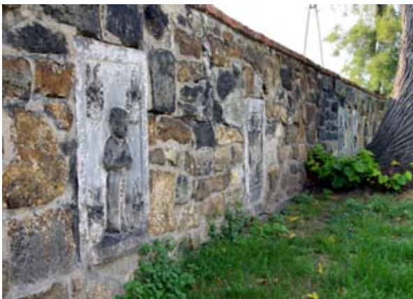
■ fot. Zachowice - mur kościelny z płytami nagrobnymi

• Epitafium renesansowe pana z Mierschelwitz, Schiebgangwitz, Wiegemonda, przedstawia stojącego rycerza z opuszczonym mieczem.