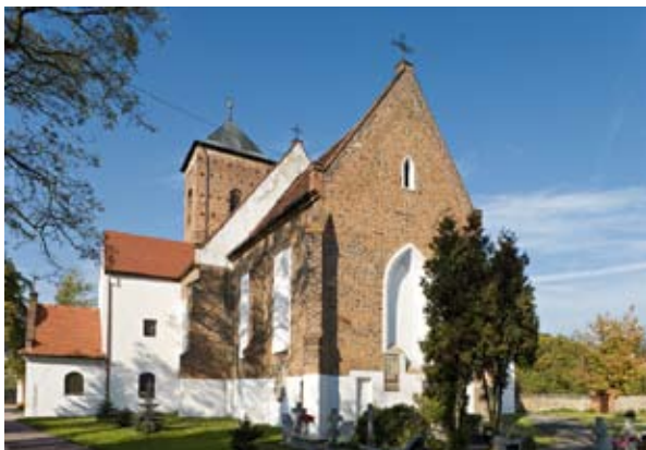
■ fot. Sośnica - kościół

Po 1945 r. majątek dzierżawiony był przez PKP od PNZ (Państwowe Nieruchomości Ziemskie) - istniały plany przystosowania pałacu na dom dla pracowników kolei. W 1949 r. powstało tu jednak gospodarstwo PGR, a pałac przeznaczono na mieszkania pracownicze, od lat 90-tych własność Agencji Nieruchomości Rolnych.