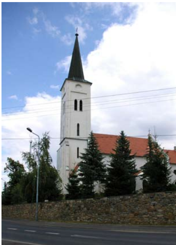
■ fot. Gniechowice - kościół katolicki

Naprzeciwko pałacu znajduje się kościół p.w. Św. Filomeny- jest obecnie jedynym kościołem we wsi, do lat 50-tych XX wieku funkcjonowały dwa- katolicki i nieużytkowany od czasów wojny kościół ewangelicki.