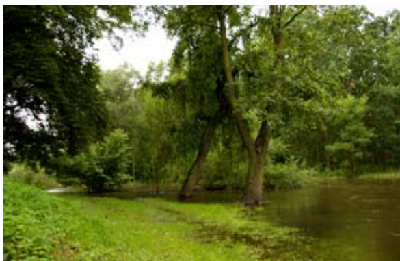
fot. rzeka Bystrzyca

Powstał w 1998 roku w celu zachowania i promocji walorów przyrodniczych doliny rzeki Bystrzycy- jednego z najważniejszych dopływów lewobrzeżnych Odry. Pod względem geograficznym to doskonały przykład doliny rzecznej z w pełni wykształconym korytem, licznymi starorzeczami, terenami bagiennymi i leśnymi.