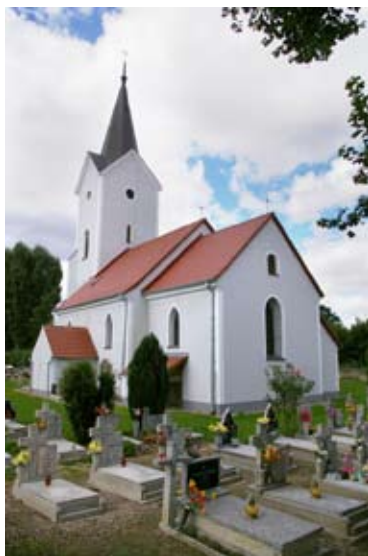
fot. Wojtkowice - kościół

Kościół p.w. Św. Jana Nepomucena stanowi dominujący obiekt we wsi. Wzmiankowany po raz pierwszy w 1329 r. Obecny renesansowo-neogotycki, wzniesiono staraniem opata Jana Cyrusa w 1569 r., na miejscu starszego. Murowany, jednonawowy z węższym prezbiterium na planie kwadratu. Czworoboczna czterokondygnacyjna wieża z zachowanym herbem opata Jana Cyrusa. Między