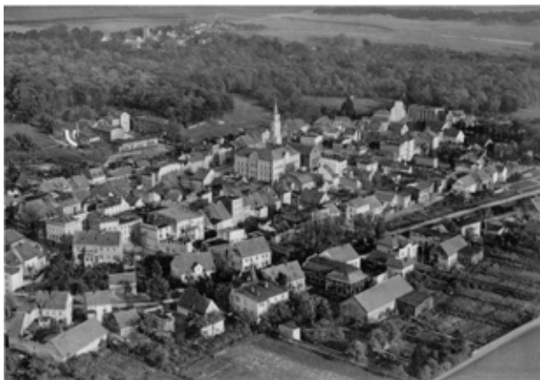
fot. Kąty Wr. - zdjęcie lotnicze z 1938 r.

Słowianie, jako grupa etniczna, pojawili się na tych terenach dopiero w VII wieku n.e. Według badań archeologicznych ziemie Kątów Wr. były zamieszkiwane przez ludy prasłowiańskie, a najstarszy gród, pochodzący z VIII-IX w., znaleziono na terenie Gniechowic. We wczesnym średniowieczu okoliczne ziemie należały do Ślężan, potem historia okolic Kątów była ściśle związana z historią całego Śląska.