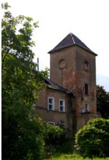
■ fot. Jurczyce - pałac

koracje zostały zredukowane, kształt dachu uproszczony, budynek otynkowany. Dzisiejsza budowla nie oddaje charakteru pierwotnej rezydencji o skomplikowanej bryle z główną wieżą prostopadłościenną zwieńczoną spadzistym hełmem ostrosłupowym i czterema mniejszymi sterczynami w narożu- co nadało romantyczny charakter założeniu, podobnie jak wysokie dachy, mniejsze wieżyczki, lukarny i