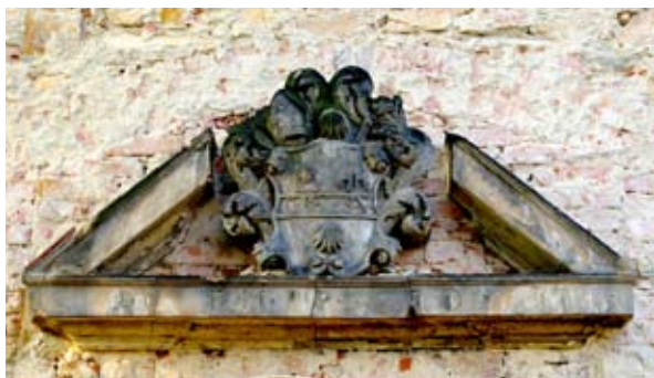
■ fot. Pelcznica - naczółek nad wejściem domu nr 26

frontu również ryzalit z facjatą i dachem dwuspadowym- w szczycie dwa okna zakończone łukowo i wyżej okulus. W latach 80-tych budynek był jeszcze własnością klasztoru sióstr elżbietanek. Obecnie dom mieszkalny.