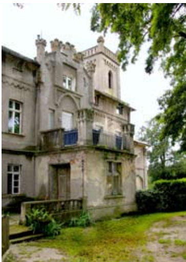
■ fot. Rybnica - pałac

Pałac nr 9 położony jest w środkowej części wsi. Powstał ok. 1860 r. i rozbudowano go na przełomie XIX/ XX wieku. To neogotycka, murowana budowla trójkondygnacyjna, podpiwniczona. Na planie litery L, z dachem dwuspadowym spłaszczonym, w elewacji frontowej pięć osi, w części centralnej- ganek murowany z balkonem. Na osi głównej szczyt w formie ściętego tym-