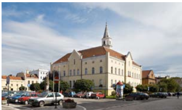
■ fot. Kąty Wr. - ratusz

Starszy ratusz spłonął w 1624 r. i przez wiele lat w obrębie bloku śródrynkowego stała samotna wieża ratuszowa, waga miejska, studnie i kramy, a od 1822 r. również pierwsza apteka. Renesansowa wieża pochodzi z 1613 r., wysoka na 36 m, u podstawy na planie prostokątnym, wyżej przechodzi w ośmiobok zwieńczony ostrosłupowym hełmem. W północnej ścianie zachowały się tablice herbowe wrocławskich biskupów z XVII wieku: herb starosty kąckiego Hansa von Reibnitz z 1613 r.; herb biskupa Karola austriackiego; herb Jana Scultetusa- biskupa sufragana wrocławskiego (1604-1613). Od południa znajduje się wejście główne z łukiem pełnym, ujęte pilastrami. Krawędzie wieży podkreślają lizeny. W części ośmiobocznej cztery figury lwów trzymających tarcze i zegar.