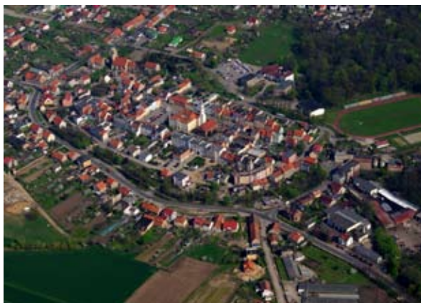
■ fot. Kąty Wr. - zdjęcie z lotu ptaka

Okolice Kątów Wrocławskich, ze względu na żyzne gleby i dobre warunki klimatyczne, od początków osadnictwa miały charakter rolniczy. Wpłynęło to zarówno na gospodarkę, jak również formy budownictwa. Przeważająca część wsi rozwinęła się wokół folwarków, nastawionych na uprawę zboża i hodowlę zwierząt. Do początku XX wieku istotnym elementem krajobrazu kulturowego były młyny wodne i wiatraki (najczęściej typu koźlak), a także browary. O ile młyny wodne, głównie z XIX i początków XX wieku nadal istnieją, to po wiatrakach niestety nie zachował się żaden ślad. Rozwój przemysłu w połowie XIX wieku przyniósł zmiany w dotychczasowej zabudowie wsi, jednak należy zauważyć, że rozwijał się przemysł związany z przetwórstwem rolniczym, zwłaszcza uprawa buraka cukrowego stała się opłacalna- powstają cukrownie w Sośnicy, Pietrzykowicach i Smolcu, fabryka superfosforatu w Smolcu. Poza tym rozwijają się cegielnie (Sośnica, Stradów).