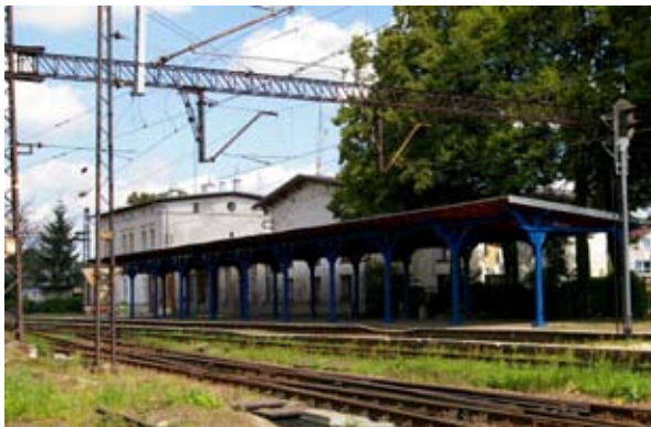
■ fot. Kąty Wr. - dworzec PKP

czątkowo przeważał ruch towarowy- węgla, płodów rolnych i produktów rzemieślniczych. Z czasem transport osobowy zyskał na popularności. Obecny budynek dworca z drewnianą