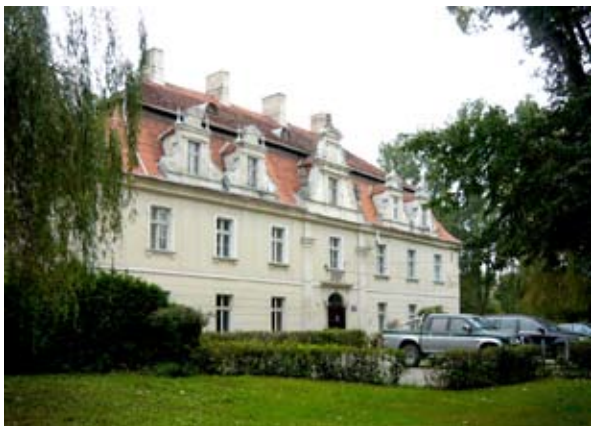
fot. Sadków - pałac

ku. Po roku 1594 pojawiają się pewne informacje o istnieniu renesansowego dworu nawodnego Szymona von Haniwaldt z Pilczyc i Żórawiny, prawdopodobnie pierwszą decyzją po zakupie wsi było zlecenie wybudowania dla siebie siedziby. Ślady pierwotnego dworu są obecne do dziś w fundamentach obecnego pałacu: piwnice, sień z czterema potężnymi kolumnami, na parterze pomieszczenia południowo-wschodnie ze sklepieniami kolebkowymi oraz południowa część zachodniego muru magistralnego o znacznej grubości. Dowodami na to, że ówczesna budowla była dworem otoczonym fosą są istniejący do dziś staw w pobliżu pałacu oraz bagnisty grunt na południe od pałacu. Posiadłość została odkupiona w roku 1714 od rodziny von Arzat przez Hioba Heinricha von Rothkircha (1682-1748), krótko po narodzinach jego pierworodnego syna Carla Siegismunda (1714-1791). Jednak renesansowy pałac uległ zniszczeniu w pożarze w 1739 roku, którego przyczyn dziś nie da się już ustalić. W czasie odbudowy rodzina Rothkirchów mieszkała w parterowej oficynie nazywanej przez właścicieli „Schlössel” tzn. „Zameczkiem”. Znajduje się ona na zachód od obecnego pałacu. Z końca XVIII wieku, klasycystyczna, murowana, otynkowana, na planie prostokąta, dwutraktowa, parterowa z mieszkalnym poddaszem, dach mansardowy z prostymi lukarnami. Elewacja pięcio- i trójosowa, naroża boniowane i dzielone lizenami w tynku. Po 1949 r. oficyna została przeznaczona na mieszkania i pomieszczenia gospodarcze PGR Sadków. Obecnie nieużytkowana.