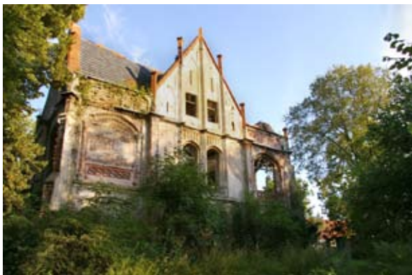
■ fot. Stoszyce - pałac

wschodnim z maswerkiem ślepym w strefie podokiennej. W fasadzie głównej jednoosiowy ryzalit z trójkątnym szczytem i sterczynami, na piętrze balkon z kamienną, ażurową balustradą. W skrzydle wielkie okna, w części parterowej w formie podcieni, wyżej loggia. Dach dwuspadowy z facjatkami.