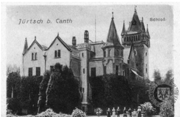
■ fot. Jurczyce - pałac w 1911 r.

W północno-wschodniej części wsi, w pobliżu rzeki, po-