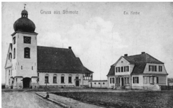
■ fot. Smolec - kościół na pocz. XX w.

Po wojnie funkcjonowała Spółdzielnia Przetwórcza Smolec, Mokronos Górny i Rybnica oraz Spółdzielnia Owocowa Tymbark.