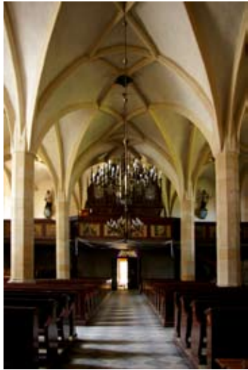
fot. Kąty Wr. - wnętrze kościoła p.w. św. Piotra i Pawła

W okresie reformacji kościół kątcki od 1632 roku pełnił funkcję świątyni ewangelickiej- w tym czasie większość mieszkańców Kątów była wyznania luterskiego. Dopiero kontr-reformacja przywróciła