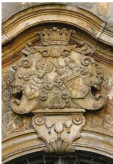
fot. Czerńczyce - herb w supraporcje