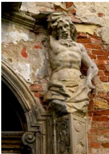
■ fot. Kamionna – atlant, fragment portalu pałacowego

w narożach skrzydła północnego- prawdopodobnie z 1850 r. Elewacja frontowa dziewięciosiowa z ryzalitem trójosiowym w części centralnej, otwory okienne prostokątne na parterze z ozdobnymi obramieniami i gzymsami nadokiennymi naprzemiennie prostymi i falistymi, na piętrze okna ujęte w prostsze obramienie zakończone zwornikiem w tynku. Cała elewacja spięta wielkim porządkiem z kapitelami kompozytowymi. Ryzalit zamknięty trójkątnym tympanonem z okulusem. Barokowy portal główny, z lat 1740-44, z wejściem zamkniętym łukiem koszowym z kluczem zdobionym maszkaronem, ujęty dwoma hermami z rzeźbami atlantów, podtrzymujących balkon o barokowej balustradzie wklęsło-wypukłej, ażurowej, z dekoracją taśmową, wsparty dodatkowo na dwóch wysuniętych kolumnach kompozytowych (obecnie nieistniejących). Otwór wejściowy balkonu powtarza łuk koszowy wejścia głównego- w bardziej spłaszczonej formie, zdobiony profilowaniem w tynku. Elewacja dziedzica z zachowanymi trzema arkadami pełnołukowymi dawnych krużganków, fragment