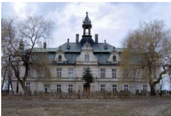
■ fot. Kębłowice - pałac

Pałac był siedzibą PGR, w latach 60-tych odremontowany- z