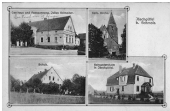
■ fot. Jaszkotle - pocztówka z pocz. XX w.

Położona 12 km na południowy zachód od Wrocławia i 12 km na wschód od Kątów Wrocławskich wieś wielodrożnicowa, rozwinęła się przy kościele parafialnym. Początkowo pod jedną nazwą funkcjonowały dwa folwarki - dopiero z czasem Gądów wyodrębnił się w osobną wieś. Jaszkotle wzmiankowane po raz pierwszy w 1155 r. jako Jascotele pośród dóbr biskupa wrocławskiego. W 1226 r. źródła historyczne podają pierwszego znanego z imienia właściciela wsi- była nim kobieta- pani von Wysocka (Wessig). Pod datą 1282 r. wspomniany jest kolejny właściciel Jeschkotel – Jeszko Qualis. Pod koniec XIII wieku wsią zarządza Klemens de Yescotel. W 1293 r. biskup wrocławski sprzedaje wieś mieszczaninowi Heidenricusowi de Mulnheim, w celu lokacji na prawie niemieckim- de Mulnheim zostaje sołtysem wsi. Jeszcze w tym samym roku allodium na terenie Jaszkotla znalazło się w posiadaniu sióstr