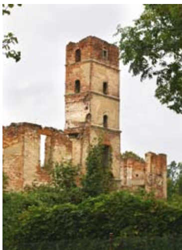
■ fot. Smolec - ruiny pałacu

W otoczeniu fosy, którą można było przebyć murowanymi mostkami pałac na planie nieregularnego czworoboku, podpiwniczony, parter sklepiony kolebkowo z lunetami, na osi centralnej wieża na planie kwadratu, stanowiąca dominantę budowli- pięciokondygnacyjna, z gzymsami i bramą zamkniętą łukiem pełnym. Układ dwutraktowy, z sienią na osi poprzecznej. Na kamiennym cokole,