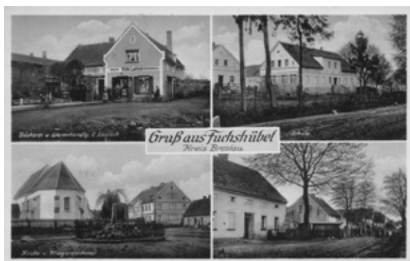
■ fot. Strzegano- wice - pocztówka z pocz. XX w.