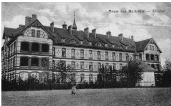
■ fot. Małkowitz - dawny klasztor

wy, gzyms międzykondygnacyjny i fryz- również wykonano w cegle. Wszystkie te zabiegi nadają bryle i elewacjom bogaty i dekoracyjny wyraz.