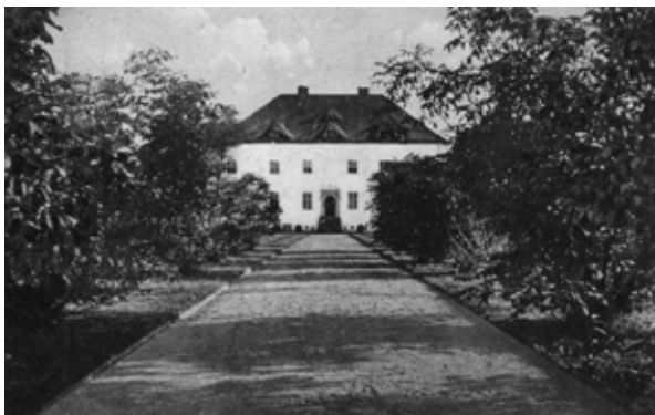
■ fot. Zybiszów - zdjęcie pałacu z lat 30-tych XX w.

dle wschodnim zachowała się dawna stajnia z oborą- obecnie magazyn, w skrzydle zachodnim obora- dziś również magazyn Stacji Doświadczalnej Oceny Roślin. Pałac pochodzi z lat 20-tych XX wieku. To budynek dwukondygnacyjny z poddaszem i suteroną. Dach czterospadowy z pięcioma lukarnami wole oczy. Wejście północne i południowe zdobią piaskowcowe portale z supraportami- portal północny w formie łukowej przerywanej, kształt zbliżony do korony, z podwieszona latarnią kutą z żelaza o dekoracyjnej formie oraz dekoracja kamienna z liści akantu. Portal południowy półkolisty z belkowaniem i palmetą. Od wschodu dobudowano węższe skrzydło, a obecnie jeszcze dodatkowo parterową przybudówkę. Otwory okienne zmieniono. Pałac jest budynkiem mieszkalnym wielorodzinnym i siedzibą firmy rolnej. Zachował się fragment ogrodzenia z słupkami w formie zbliżonej do bastionów.