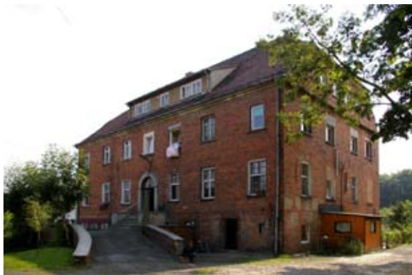
■ fot. Gniechowice - dom nr 34 - dawny szpital

Warto jeszcze zwrócić uwagę na budynek mieszkalny przy ul. Kąckiej nr 34. Murowany z cegły licówki budynek powstał w II połowie XIX wieku, na planie prostokąta. Dwukondygnacyjny, z dachem naczółkowym i lukarną- szparą wzdłuż całej połaci dachu. W elewacji frontowej wejście na osi głównej ujęto kamiennym portalem, zakończonym łukiem pełnym ze zwornikiem. Wejście poprzedza monumentalny podjazd, w jego centralnej części znajduje się brama wjazdowa prowadząca do piwnic. Elewacja ogrodowa z ceglaną przeszkloną werandą z wejściem po schodach, na wysokości piętra balkon, dwie lukarny w formie wolic oczu. Obecnie użytkowany jako budynek mieszkalny, pierwotnie pełnił funkcję szpitala prowadzonego przez siostry zakonne. Następnie przez krótki okres czasu znajdowały się tu biura Zespołu PGR, przeniesione do pałacu. Na przełomie lat 50-tych i 60-tych w budynku mieścił się ośrodek zdrowia z salą porodową, potem zlikwid-