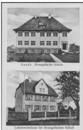
■ fot. Kąty Wr. - szkoła ewangelicka i dom nauczyciela ul. Żeromskiego

wano prowadzić lekcje w kamienicy prywatnej, ale i tym razem szkoła została zamknięta. Dopiero po sekularyzacji w 1810 r. pojawiła się możliwość legalnego otwarcia szkoły- przy ul. Mireckiego powstała pierwsza jednoklasowa szkoła. W 1890 r. rozbudowano ją do trzech, a następnie pięciu klas. Po 1925 r. przy ul. 1-go Maja postawiono cały kompleks szkolny razem z ogrodem, domem nauczyciela i małym osiedlem przy ul. Żeromskiego.