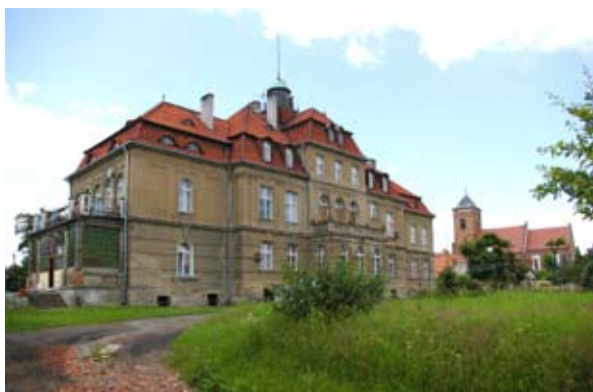
fot. Sośnica - pałac

downie ok. 1890 r. za sprawą Friedricha von Walkhoffa. Kolejny projekt odnowy, na podstawie pomysłów architektów Kleina i Wolffa z Wrocławia, został wykonany w 1907 r. W latach 1919-1920 wnętrza przearanżował architekt wrocławski Paweł Klein. Ostatecznie pałac zyskał formę neobarokowej, piętrowej budowli na piwnicach sklepionych kolebkowo. Dach mansardowy z facjatami, pokryto dachówką rzymską, w części centralnej glorieta wieńczy całość. Ściany na parterze boniowane w tynku, piętro zdobią podziały ramowe i pilastrowe, podziały lizenami i gzymsami, obramienia okien w tynku. Trzyosiowy i dwupiętrowy ryzalit z gankiem arkadowym, nad nim taras w elewacji frontowej. Otwory okienne prostokątne lub zamknięte pełnym łukiem, w obramowaniach z tynku.