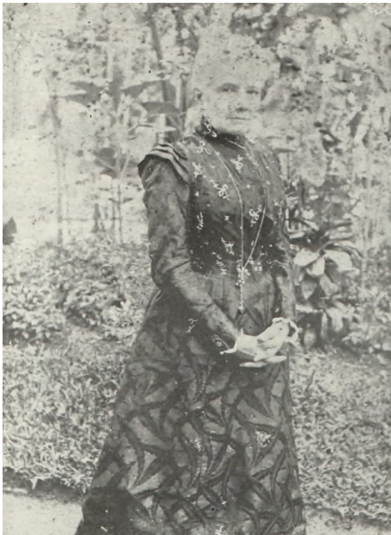
Carolina Augusta Machado de Assis, esposa de Machado de Assis.