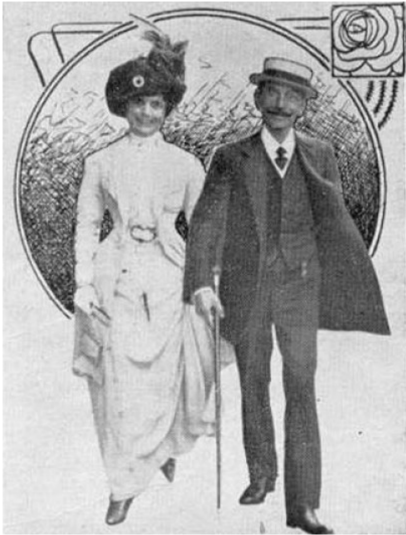
Coelho Neto e sua esposa (Revista "A Cigarra", edição de 1915)