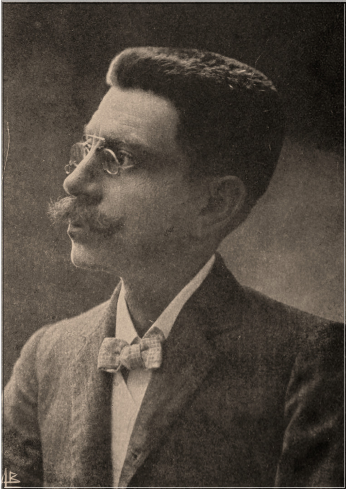
Coelho Neto, em fotografia publicada em 1911