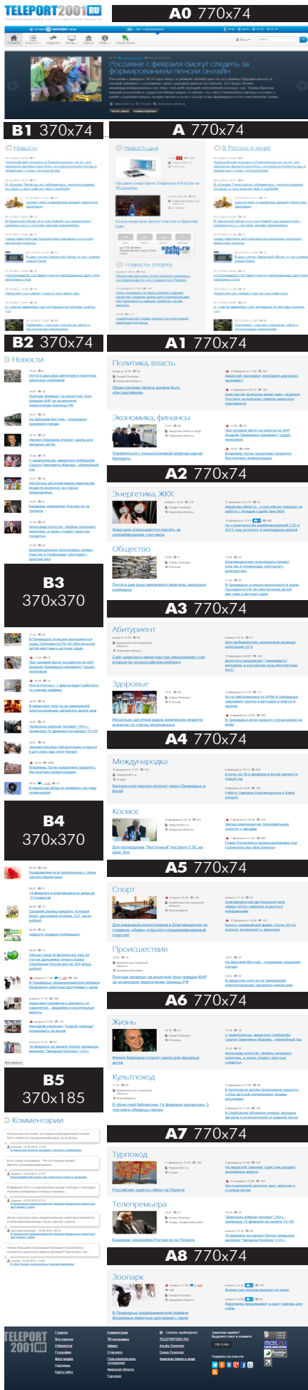
Рис. 1. Главная страница