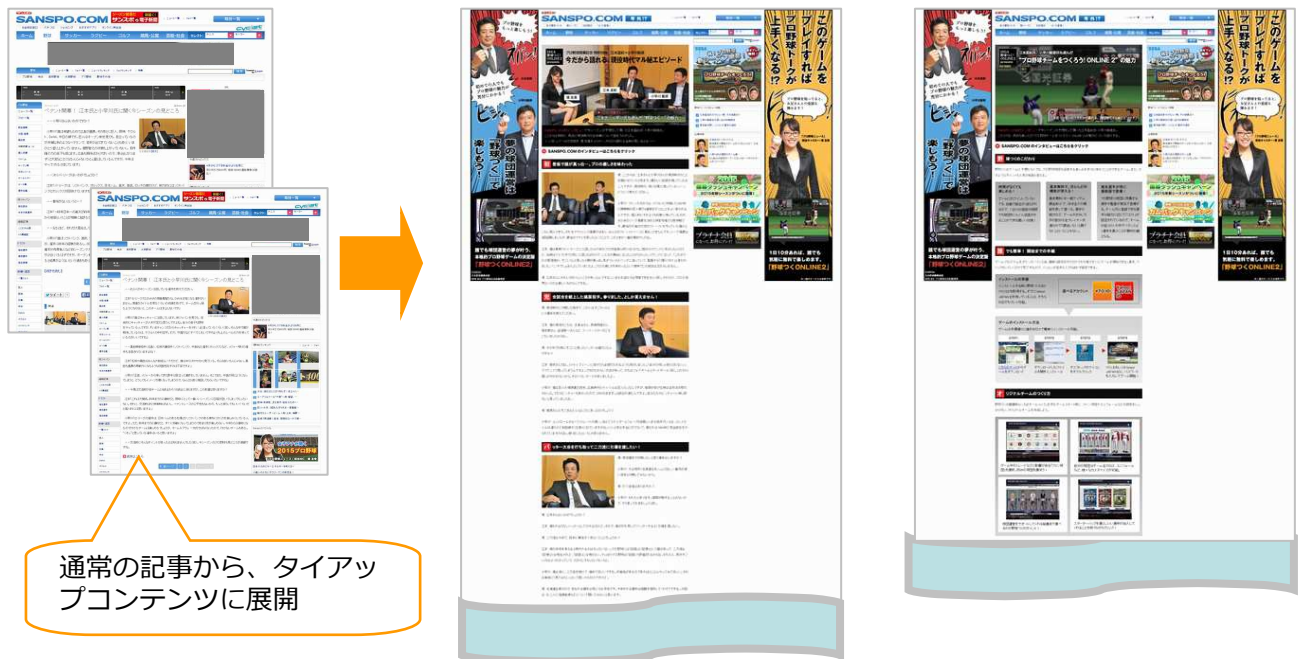
通常の記事から、タイアップコンテンツに展開

産経デジタルのタイアップ広告は、企画、キャスティング、制作まで、新聞社系媒体の媒体力を活用して、オーダーメイドの訴求を行うことができます。ぜひ、営業担当までご相談ください。