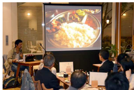
↑各国のグルメとの出会いも自転車旅の魅力