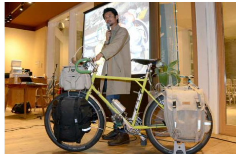
↑愛用のランドナーで旅のハウツーを伝授