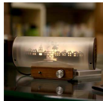
エムズシステム Kagee アンプ内蔵型モバイルスピーカー

販売価格62,640円（税込） サイズ：8.2(H)×15.5(W)×6(D)cm 絵柄：3種から選べます。 生産国：日本