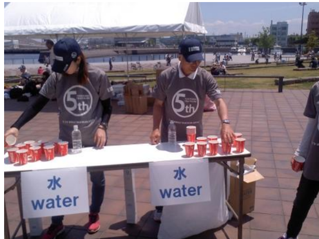
机の上に並べたコップにペットボトルの水を入れ