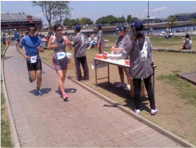
前半は男子の部で