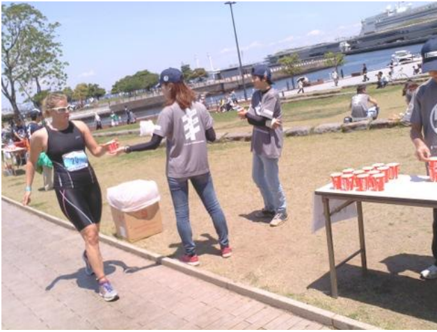
外人の選手には「Water」と言って渡しました