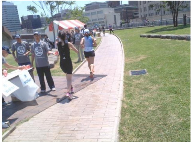
後半は女子の部でした