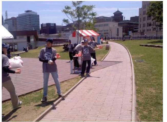
中学生のボランティア