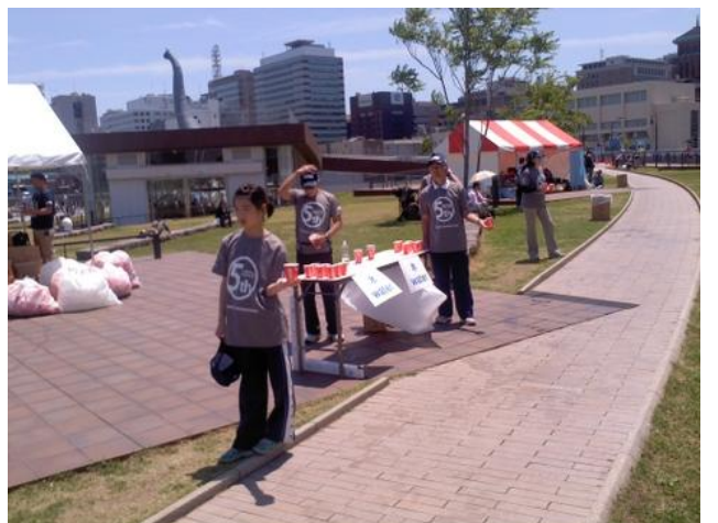
暑い中5時間みんなで頑張りました