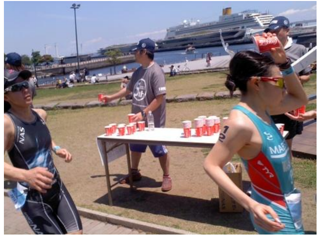
暑い日でしたので、頭に水をかける人もいました