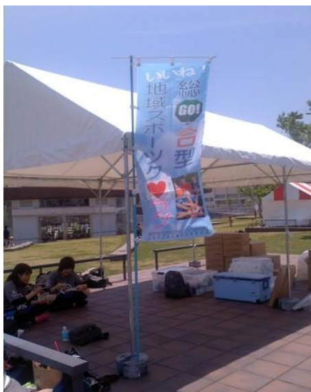
総合型ののぼり（旗）です