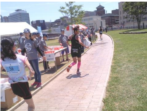
選手も頑張って走り