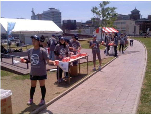
若い人達も頑張りました