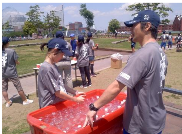
水を入れた容器でペットボトル水を冷やし