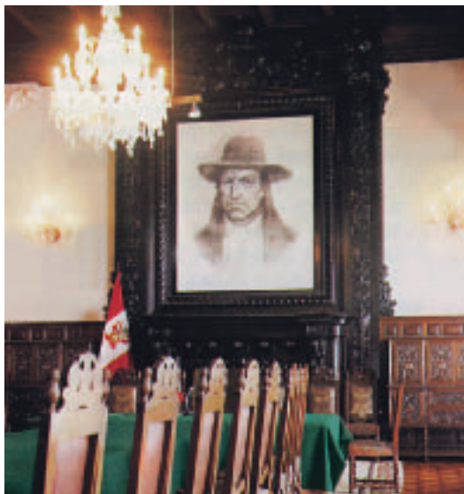
Salón Túpac Amaru II, en Palacio de Gobierno - Lima.

“Pero el curaca que se había levantado en busca de justicia no murió vanamente. Los corregidores y sus repartimientos fueron suprimidos, como él pedía, y en su lugar se estableció el régimen de las intendencias. La creación de la Audiencia del Cusco, otro de los postulados de la rebelión, se hizo realidad años después” (Jorge Gonzales Aguirre).