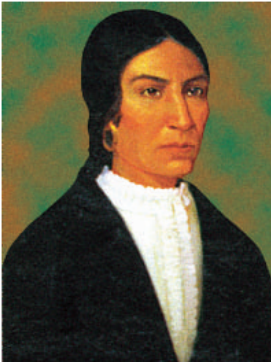
Micaela Bastidas lo llamaba "Chepe" a José Gabriel y éste la decía "mica".