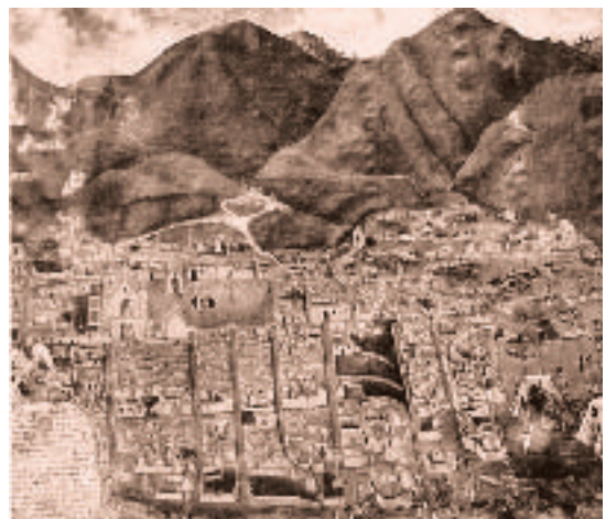
Dibujo colonial del pueblo de Tinta, en donde se inició la revolución de Túpac Amaru II.

Como hijo de nobles incas, estudió en el Colegio de Cacicques de San Francisco de Borja, una de las pocas instituciones educacionales que daba acceso a los indios de abolengo. Los comunes no tenían ese derecho y los indios de abolengo no podían entrar en los colegios mayores y universidades dedicados únicamente a los españoles e hijos de ellos o criollos. José Gabriel era alumno distinguido, muy inteligente y perspicaz y llegó a dominar todas las materias que se enseñaban en aquel entonces, inclusive el latín. Se dice que en uno de sus viajes a Lima por asuntos judiciales no tuvo reparo en asistir a algunas clases de Artes en la Universidad de San Marcos. Se convirtió, pues, en indio leído y culto para el gusto de los conquistadores; pero, enterado y humanista, para esperanza de los conquistados.