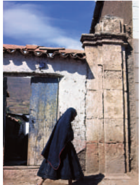
Casa donde vivió Túpac Amaru II.

José Gabriel Condorcanqui Túpac Amaru, desde muy niño heredó los curacazgos (los españoles los llamaban cacicazgos, por la trasposición del nombre caribeño cacique -jefe de comunidad o indio principal-) de Pampamarca, Tungasuca y Surimana. También heredó la ideología de sus predecesores y se hizo llamar Túpac Amaru II.