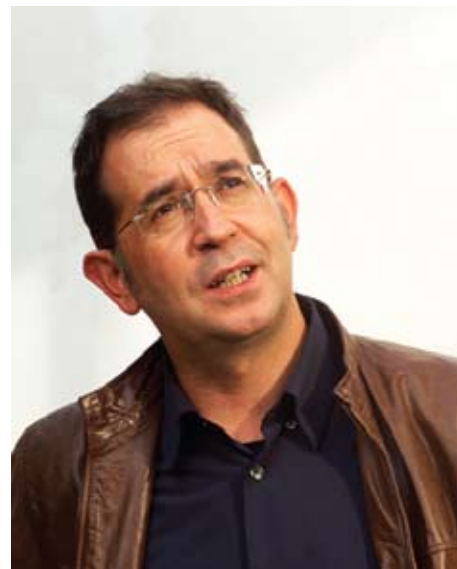
Suso de Toro

En 1996 salen a la luz Conta saldada y los ensayos Eterno retorno y Parado na tormenta . Y sólo un año después Calzados Lola gana el Premio Blanco Amor. En esta obra se desarrollan dos líneas narrativas: la de acción, con investigaciones, y la introspectiva, con desintegración y reconstrucción