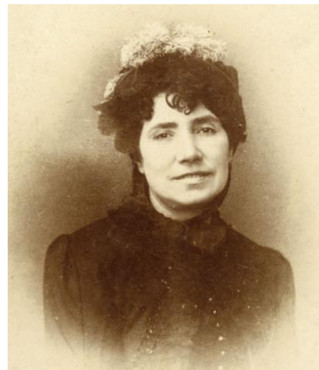
Rosalía de Castro

Desde 1859, año en el que publica la novela La hija del mar , Rosalía vive habitualmente en Santiago de Compostela. Allí verán la luz, sucesivamente, la novela Flavio (1861) los poemas en Álbum de la caridad (1862), y los libros A mi madre (1863) y Cantares gallegos (1863), obra fundamental de la historia de la literatura de Galicia y cuya fecha de publicación fue es-