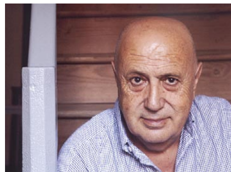
Xosé Luís Méndez Ferrín

Sin embargo, la praxis política lo llevó, dejando atrás el paréntesis de los sesenta, al socialrealismo más elaborado y más explícitamente partidario: de esa fase es Antología popular , de 1972, firmado como Heriberto Bens, y Sirventés pola destrucción de Occitania , de 1975. Sin embargo, al año siguiente Méndez Ferrín da el cambio y muda con él la trayectoria de la poesía gallega. Su Con pólvora e magnolias de 1976 marca el