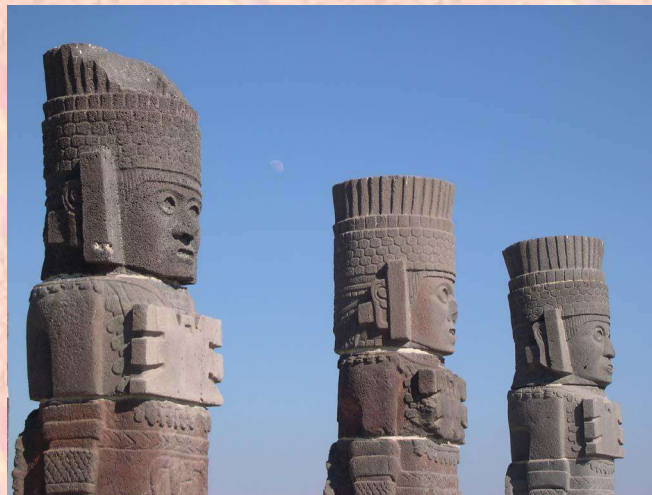
Les Toltèques de Tula

Les Toltèques sont installés à 80km de Mexico dans l'Etat de Hidalgo à Tula (fondée par les Toltèques) dominant la vallée de Mexico. On les trouve au Nord du Mexique et dans la péninsule du Yucatan. On compte à Tula environ 30 à 40000 habitants, on peut y voir des pyramides décorées de sculptures représentant des personnages à demi-couchés qui tiennent sur leur ventre un plateau rond destiné à recevoir le cœur des victimes sacrifiées, et des surfaces de jeux.