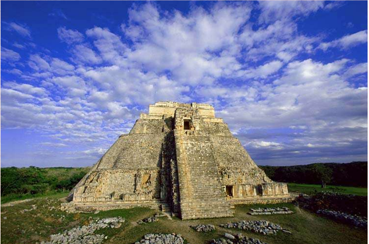
Temple du Magicien, Uxmal, Mexique