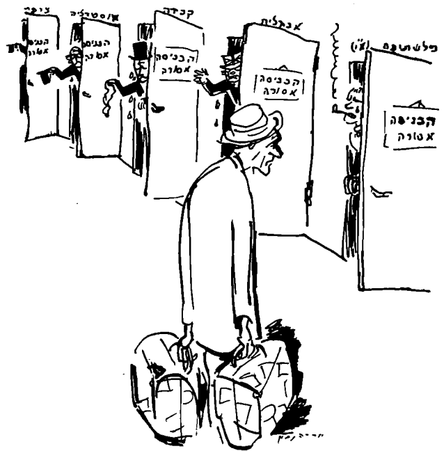
נעילה בוועידת אוויאן, קריקטורה של אריה נבון, 1939

העלייה היתה החוליה המחברת בין כל הגורמים שהזכרנו. הניצולים שיגיעו לארץ, גם אם יודקו לפרק-זמן מסוים בטרם יתחילו את חייהם החדשים, יהפכו את המשימה הזו למכנה משותף של העם היהודי כולו. בגולה תיווצר מנהיגות, שתפקידה יהיה לארגן וליזום את תנועת העלייה, בעזרתם של שליחי היישוב. מנהיגות זו, מבין ניצולי השואה, תוכל להרחיב את מעגל הציבור המעורב על-ידי פעילות ארגונית וחינוכית בקרב הקבוצות השונות המיועדות לעלייה. העלייה תאפשר ליהודים שחיו בקהילות החופשיות, ובעיקר בארצות-הברית, לתרום את חלקם לשיקום הניצולים, לא במחנות באירופה, אלא בארץ-ישראל. בכך תקשור אותם באופן בלתי-אמצעי לבניין הארץ. ארגון העלייה יהפוך את היישוב לפעיל באופן ישיר בהצלת שארית הפליטה, וייצור את שיתוף הפעולה ההכרחי בין היישוב לבין העולים והגולה. ולבסוף, העלייה תחייב את המעצמות להירתם לתמיכה בציונות, משום שלא תוכלנה להתחמק מן האחריות המוטלת עליהן לעשות לשיקומם של יהודי אירופה שניצלו. 27