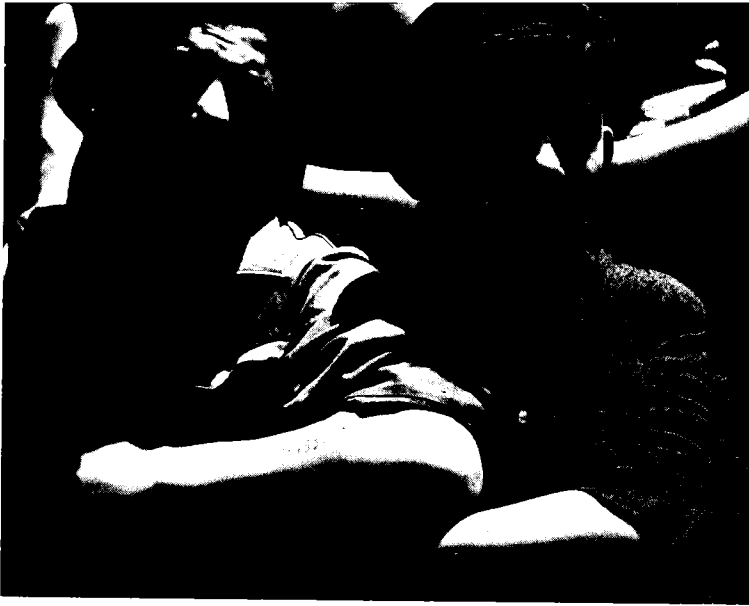
ילדים עולים, מניצולי אושוויץ, באוניה הבריתית מטרופא, חיפה, 15 ביולי 1945

זאת חייב להוביל אל המטרה העיקרית – העלייה; עלייה של כל מי שרוצה ויכול לעלות, עלייה שהיתה לדידו העברת-אוכלוסין, ואשר יש לבצעה בקנה-מידה גדול ובעזרת המעצמות. 32 בן-גוריון ראה בעם היהודי, על כל חלקיו, ציבור בעל אינטרסים משותפים. ודאי, לא נסותרו מעיניו שבמצבים שונים נתקיימו ניגודי-אינטרסים בין חלקים שונים של העם, בין טובת הישוב בארץ-ישראל לבין טובת הציבור היהודי בגולה. הוא לא התבונן אל העם היהודי מתוך האספקלריה של ארץ-ישראל אלא ראה בבנייה של ארץ-ישראל ככל שלב ושלב מטרה המשותפת לציבור היהודי כולו, אפילו למתנגדי הציונות שבקרבו. הוא שינה את עמדותיו, והערכתיו וגישותיו לגבי דרכי ההגשמה והמאבק הראויות על-פי מצבו של העם היהודי כולו. אצלו לא היתה קיימת הבחנה בין גאולה והצלה (הבחנה שערך וייצמן בראשית התקופה הנאצית, וחזר עליה יצחק גרינבוים לאחר שנודעו פרטי ההשמדה). ההצלה והגאולה היחידים והאמיתיים היו בהגשמת הציונות על ידי העם היהודי באמצעים ובדרכים האפשריים.