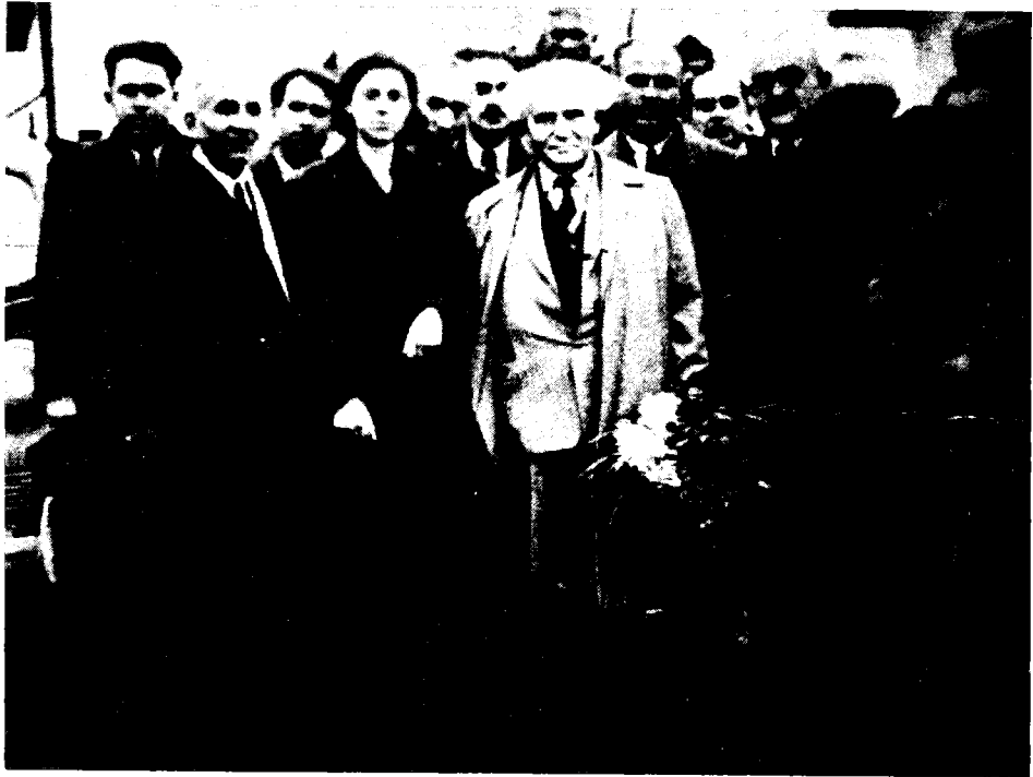
בן-גוריון מבקר אצל יהודי בולגריה, 1 בדצמבר 1944

של התבוללות זו היא הסגרה לקומוניזם... המסקנה העיקרית שלי היא לציונות יש פרובלימה אחת — הצלת שארית היהודים בחדשים או בשנים הקרובות, אני אומר או, כי איני בטוח אם השארית תתקיים במשך השנים, הג'ויינט אינו פעיל שם, ואני חרד לסכנה אם החידקים של הקומוניסטים יתאחדו עם הג'ויינט. 31