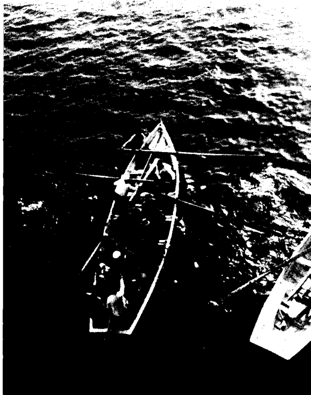
עולים מגרמניה מוקעים בסירות אל חוף יפו, נובמבר 1933