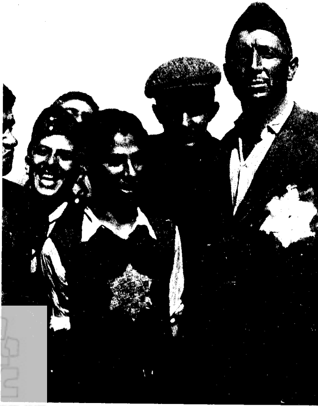
ניצולי שואה במחנה המעפילים בעתלית

השואה, יהודי ארצות האסלאם, ארצות-הברית ואירופה המערבית לפעול בצוותא. גיוס מלא של כל חלקי העם ייצור ריכוז של כוח, שיוכל להפעיל את הלחץ המדיני והמוסרי הנדרש על הממשלות הנוגעות בדבר. ניצולי ההשמדה, יהודים במצוקה ויהודי ארצות החופש — כולם יחדיו היו בהשקפתו של בן-גוריון 'שארית הפליטה' של העם היהודי. הוא השתמש במושג זה בדרך המסורתית היהודית, המבטאת את הקשר שבין התורבן והגאולה. אך בניגוד לרוב חבריו, שראו בניצולי השואה את שארית הפליטה, חשב בן-גוריון שהעם היהודי כולו הוא השארית. כל הציבור שמנה מיליוני יהודים, היה זקוק להצלה, והצלתו אפשרית רק על-ידי שינוי מעמדה המדיני של הציונות. אם תשכיל המדיניות הציונית להפוך את שארית הפליטה לגורם בעל משקל בשיקולים המדיניים של המעצמות, יבוא, לדעתו, השינוי המיוחל. שילוב מצוקתם של ניצולי השואה עם היכולת והנכונות של הציונות לעזור להם, ושיתופן של הקהילות היהודיות האחרות במתקפה מדינית על דעת-הקהל בארצות הדמוקרטיה יביאו להגשמת התכנית הציונית. עיקר ראשון בהשקפתו היה העלאתם לאלתר של הניצולים לארץ, ולא השתתפותם המיידית והמלאה בהתיישבות ובבניין הארץ. שיכונם במחנות ארעיים בארץ ותכנית לשיקום חייהם בה היו מדגימים את עוצמתם המוסרית של הציונות והיישוב גם בשלהי המלחמה ולאחר שהמעצמות לא הראו נכונות לעזור ליהודים, האמין בן-גוריון שלצדקתה של הציונות נודעה חשיבות בשיקולי המעצמות לאחר המלחמה.