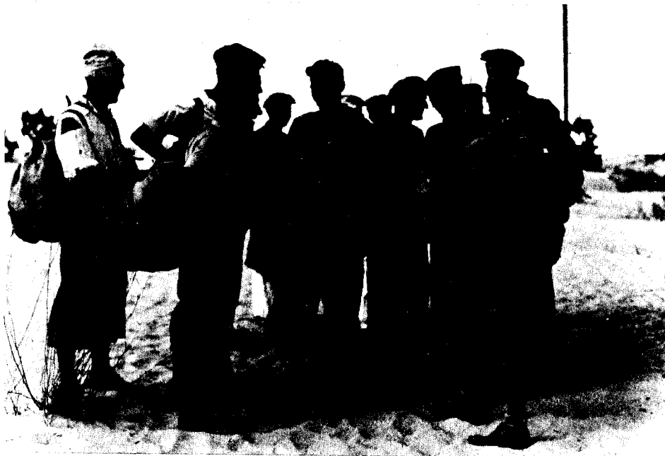
עולים שנחתו על החוף באופן בלתי-לגאלי מתרכזים סמוך לגבעת מיכאל (מצפון לנס- ציונה), אוקטובר 1939

בפני כליון גופני. שאלת הפליטים נעשתה עכשיו שאלה עולמית ושאלה דוחקת ואנגליה מתאמצת להפריד עכשיו בין שאלת הפליטים לשאלת ארץ ישראל. ההיקף האיום של בעיות הפליטים מחייב פיתרון טריטוריאלי, ופתרון מהיר ואם ארץ ישראל אינה קולטת מוכרחים למצוא טריטוריות אחרות. והציונות עומדת עכשיו בסכנה... לא עלייה מצומצמת לא עלייה רחבה, דרושה לנו עלייה המונית עליה של מאות אלפים... בלי עלייה גדולה הציונות עלולה לרדת מעל הפרק ואנו עלולים להפסיד את הארץ... לא מלחמה על עלייה, אלא על ידי עלייה, מרד עלייה (ההדרגות במקור). 21