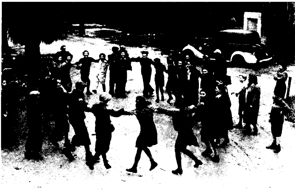
ילדים מהונגריה שהגיעו במסגרת עליית הנוער לחיפה במהלך מלחמת-העולם, 19 בינואר 1943