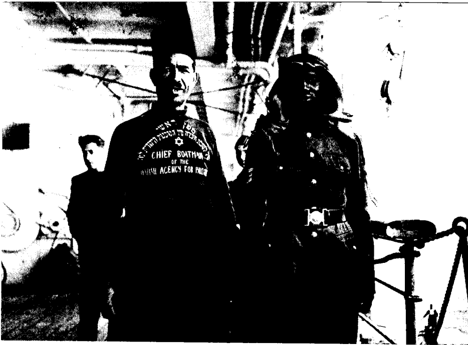
ספן ראשי של לשכת העלייה של הסוכנות היהודית לא"י ושוטר ערבי, מפקחים על ירידת עולים ביפו, נובמבר 1933

בעקבות ההחרפה במצוקת יהודי אירופה גברו הלחץ על המשרדים הארץ-ישראליים והצורך להרחיב את מעגל המשתתפים בפועל בהגשמה הציונית. אף-על-פי ששימש מזכיר ההסתדרות והיה ער במיוחד לבעיות העלייה בתנועת 'החלוץ', לא חיפש בן-גוריון את העולים מקרב תנועות הנוער ומקורבי תנועת הפועלים בלבד. בשיחה עם שליחי ההסתדרות ומנהיגי הנוער שהתקיימה בוורשה באביב 1933, שמע על הגידול הרב בתנועת 'החלוץ', שמנתה (כפי שדיווחו החברים) כחמישים אלף חבר, מהם כחמישית (11,000) בהכשרות. הוא לא נטש את העקרון, שיש לבחור בקפידה את העולים לארץ, גם אם הם חברי 'החלוץ', והתנגד להצגת העלייה החופשית והבלתי-מבוקרת גם כתעמולת בחירות. בדבריו בכינוס מפלגתו שנערך ב-29 בנובמבר 1932, החיל את המושג 'חלוץ' למי שמוכן היה לבוא לארץ ולהעניק לה מכוחו, ולא רק על מי שהוכשר בתנועה חלוצית לקראת ההגשמה. כל מי שחיפש חיים יוצרים ולא פילנטרופיה היה, לדעתו, שותף להגשמה הראויה של הציונות. בן-גוריון, חיפש תשובה לשאלה, 'מי הם האלמנטים היכולים להתיישב בארץ ישראל', וכיצד ניתן 'להציע התישבות לאומית בריאה לא רק של חלוצים כי אם של חוגים אחרים...'. הוא רצה בעלייתם של מי שכינה 'חלוצי ההון', שיביאו לארץ את כל מאורם ורכושם. בן-גוריון לא היה היחיד וגם לא הראשון שביטא עמדה זו בתנועה הציונית או בתנועת הפועלים; הוא הלך בעקבות רופין וארלוזורוב, שהתעמקו בשאלות של מימוש האפשרויות החדשות שהמציאות הגרמנית זימנה להגשמה הציונית. עם זאת, הניסוח שלו קונקרטי יותר ומתייחס לעמדות ברורות של תנועת העבודה, שחייבה בעיקר עלייה של חלוצים. 9 הרחבת המשתתפים במעגל ההגשמה הציונית היה רק מרכיב אחד שהשתנה בגישתו של בן-