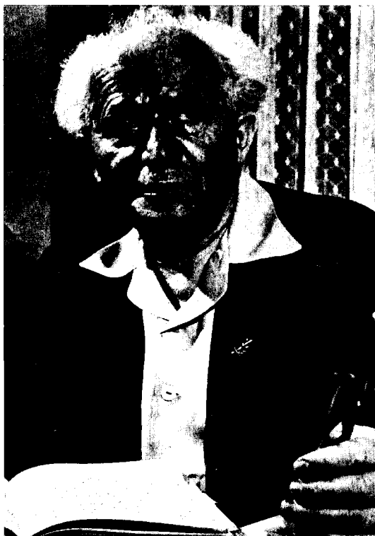
בן-גוריון ליד יומנו

... 'היומנים' של דוד בן-גוריון אינם כיומנים רגילים, שבהם רושמים חוויות, רשמים, מאורעות אישיים, הרהורים, 'מצב-רוח', וידויים, דעות ומחשבות, התרשמות מקריאת ספר, מהצגה, מקונצרט, שיחות עם אנשים תוך תיאור האווירה והתיחסות לאיש-השית. לכל אלה אין זכר ביומנו. ... המאפיין את פנקסיו שאין הם יומנים אישיים-משפחתיים אלא יומני עבודה או יומני פעולות, בחלקם המכריע. 22