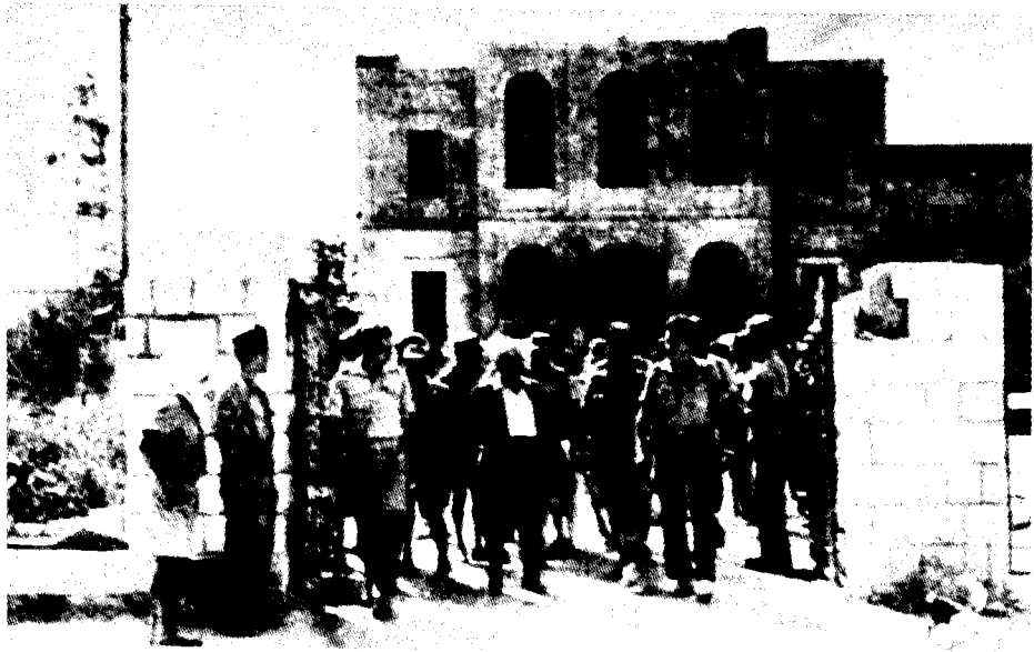
במשטרת באר-שבע בסיום 'מבצע יואב'. משמאלו של בן-גוריון — יגאל אלון וחיים בר-לב, 10 באוקטובר 1949