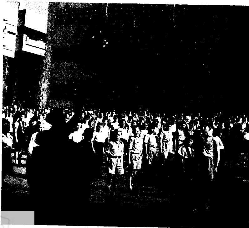
מיסדר-בוקר בבית-ספר עממי, תל-אביב, 1948

אולם דווקא נוכח מציאות זו וההתנגדות בקרב חוגים מן המרכז ימינה לקבל את בית-הספר של זרם העובדים, גברה הנטייה במפא"י להעמיד את הוועד הלאומי במבחן ולהביא לכניסת בית-הספר לילדי העובדים למינהל הכללי. לאחר משא-ומתן מתמשך נחתם, ב-4 ביוני 1935, זכרון-דברים בין הנהלת הוועד הלאומי לבין הוועד הפועל של ההסתדרות בדבר הכללת בתי-הספר של זרם העובדים ברשת המרכזית של מערכת החינוך של כנסת ישראל. 33 בסעיף 3 בהסכם נקבע, כי האוטונומיה החינוכית המובטחת לזרם העובדים לאחר ההעברה, תכלול את הרשות להסכים בבתי-החינוך את המתקם בחיי היישוב ובחיי העבודה, כרוח תפקידיה ותביעותיה של תנועת העבודה הציונית, ולחוג את חגי תנועת העבודה, על תוכנם ותחת דגלי ההסתדרות, תוך שיתוף הילדים בסידור החגיגות וארגונן. הצעת ההסכם עוררה סערת-רוחות ביישוב; זרם העובדים הואשם בחינוך פוליטי, והוחרף הוויכוח בתוך מוסדות תנועת העבודה. חוגים מסוימים איימו לעזוב את הוועד הלאומי, אם יאושר ההסכם; 34 ונציגי ההסתדרות נמנעו מלהביאו לאישור כמליאת הוועד הלאומי. כל השאלות הנוגעות להצטרפותו של זרם העובדים לרשת הכללית, הובאו להכרעה למועצת ההסתדרות. לקראת כינוס המועצה הטיח הבטאון 'השומר הצעיר' ביקורת קשה כלפי מפא"י 'האופורטוניסטית' החוששת מתקיפותו של המיעוט האזרחי: 'את חומת ביה"ס העצמי עוזבים בלי דגל, בלי ערבויות, בלי נשק — מפקירים את עצמם בידי האויב בנפש לחינוכנו'. 35 ברל כצנלסון קרא להבטיח משמעת-רוב במפלגה, כדי למנוע הצטרפות של אנשי מפא"י לעמדת 'השומר הצעיר'. 36