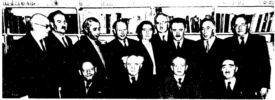
ממשלת ישראל שבתקופתה התקבל חוק חינוך חובה, מרגנת בפני הנשיא, 1953. יושבים (מימין לשמאל): דב יוסף, הנשיא יצחק בן-צבי, דוד בן-גוריון, בן-ציון דינור. עומדים: יוסף ספיר, ישראל רוקח, משה שרת, פנחס רוזן, גולדה מאיר, ישראל טרלין, פנחס לבון, לוי אשכול, פרץ ברנשטיין