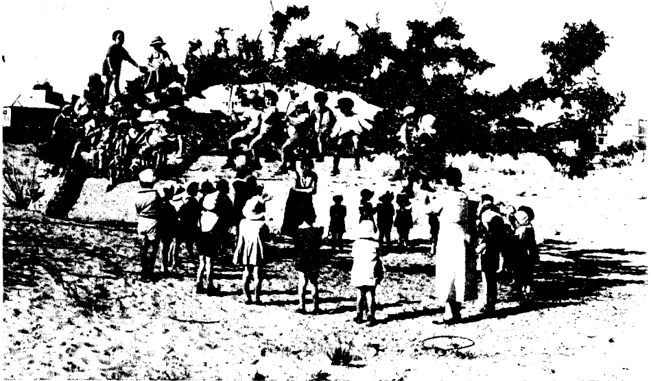
ילדי-גן משחקים סביב עץ-שקמה בחולות תל-אביב, 1933

התנועה ביטוי מעשי לשאיפות השחרור של המוני העם. העתיד, כאשר התנועה היא שתגשים את מאוריי הגאולה המשיחית של העם. 5