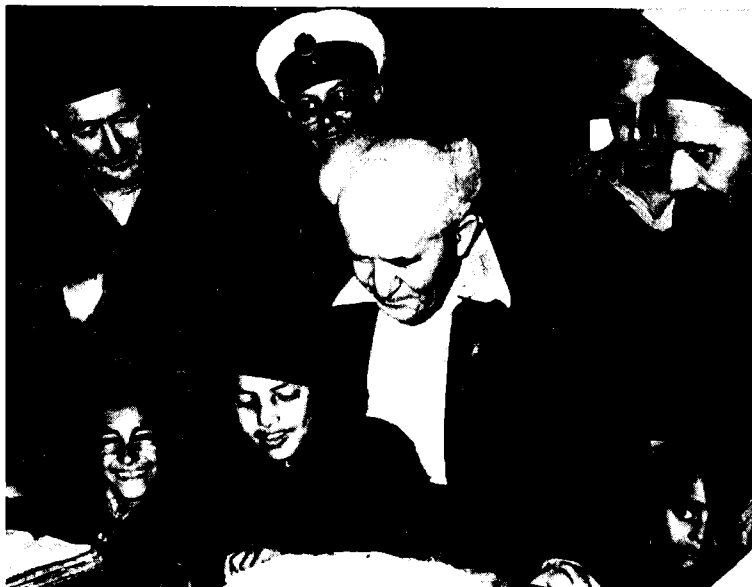
ביקור בן-גוריון במעברה

הלומדים בבית-הספר הכללי. 49 מולם התייצבה קבוצה, בראשות ישראל גורי (גורפינקל), שתבעה לא לדון בשינוי מעמד הזרמים. גישתם זו אמנם התקבלה. 50 אולם סיכום זה לא סיים את הדיון, אלא רק פתח אותו. מאבק הזרמים על נפשות ההורים וילדיהם תבע את הבאת הדברים לכירורג שיטתי וממזה במסודות מפא"י. בדיון שקיים מרכז מפא"י בראשית שנת 1951, הוקראה בפני המשתתפים איגרתו של בן-גוריון, ששהה בחופשה בטבריה. הוא קבע, כי מישטר הזרמים נבע מהעדר רשות ממלכתית של העם. מישטר הזרמים, שמלכתחילה נתכוון לחלוקת ההשפעה בחינוך לשלוש מפלגות, נידון להתפוררות ולהתפצלות כלי סוף. בדרך זו יהפוך החינוך הישראלי פלסתר דווקא בעידן של קיבוץ גלויות, עד כדי כך ש'מישטר הזרמים נהפך לגורם מסכסך ומפריד המעמיד בסכנה שלמות המדינה'. 51 עוד קודם-לכן תיאר בן-גוריון ביומנו את המצב שנוצר במעברות בשל הרישום לזרמים: 'אין די כוחות לחינוך. לא פותחים בתי-ספר, המשקים השכנים [הקיבוצים] לא עוזרים, אין תקציב למעברות. דבר הזרמים מכניס דמורליזציה עצומה — מאימים, משחדים, מזיפים חתימות בהרשמה'. 52 בן-גוריון הבחין בין חופש ההגדרה העצמית לבין שלטון המפלגות בחינוך. גם חופש ההגדרה העצמית של ההורים אינו עקרון אבסולוטי, משום שהדור הצעיר הוא קודם כל של