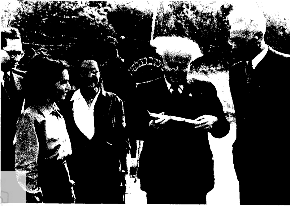
ביקור בן-גוריון בבית-הספר על-שם ברל כצנלסון, גבעתיים, בשנות המדינה הראשונות