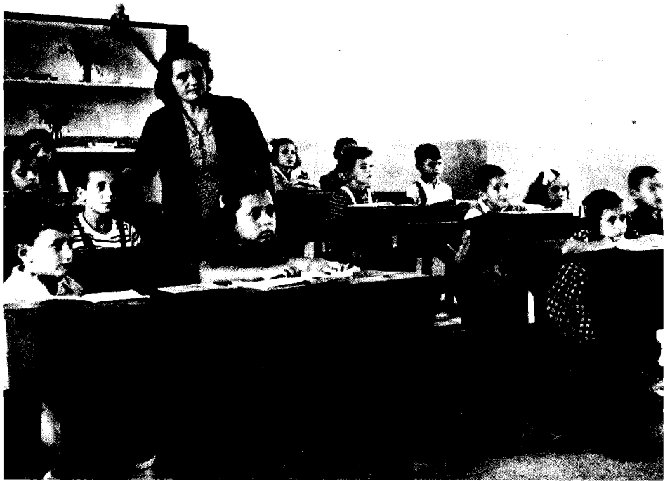
כיתת בית-ספר בכפר הנגיד, יישוב עולים חדשים, 1949

ואוניברסליים. הוא קרא לגאול את התנ"ך מגלותו, להחזירו למולדת ולהשריש בו את הדור הצעיר. הוא הטיפ ליצור קשר ממשי בין הילד לארצו על-ידי הכרת נוף הארץ, את יכולתה הגנוזה וצריך שהמורים יכירו את זאת ולא ישבו כל ימיהם רק בתל-אביב, או בחדרה או בירושלים. 57 הערך השלישי הוא החינוך לגבורה: